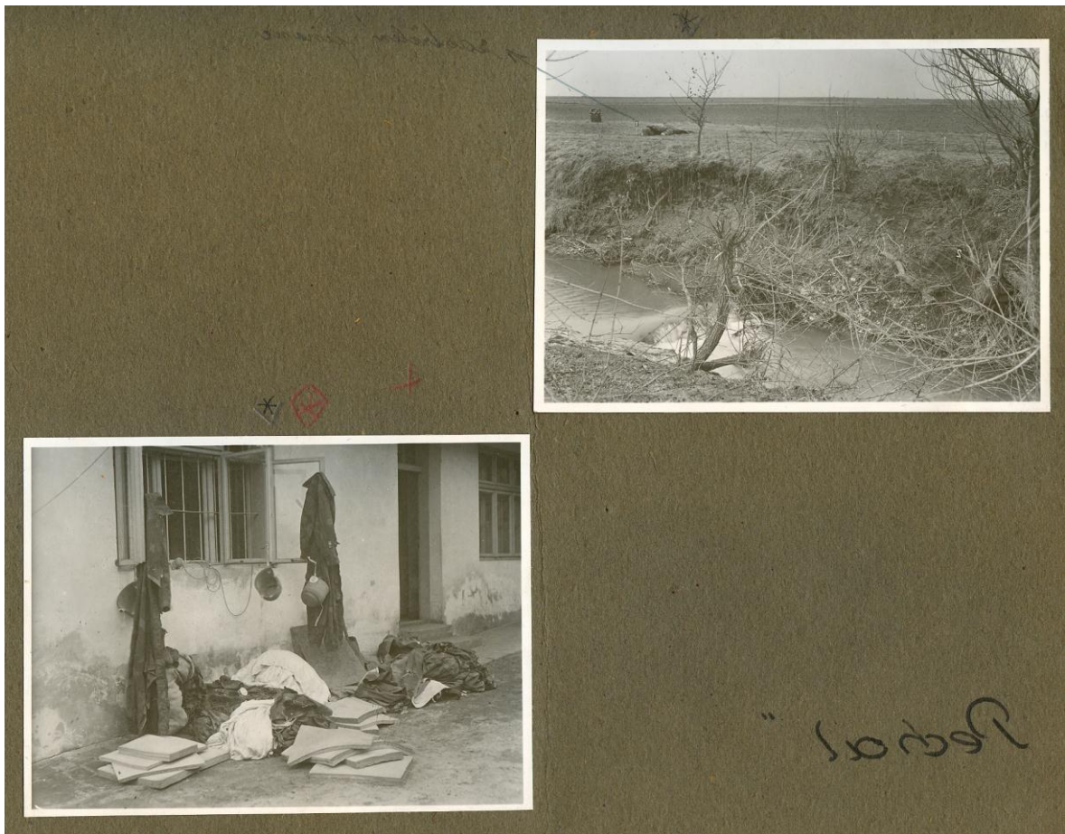
Obrázek 11 - Operační materiál skupiny ZINC