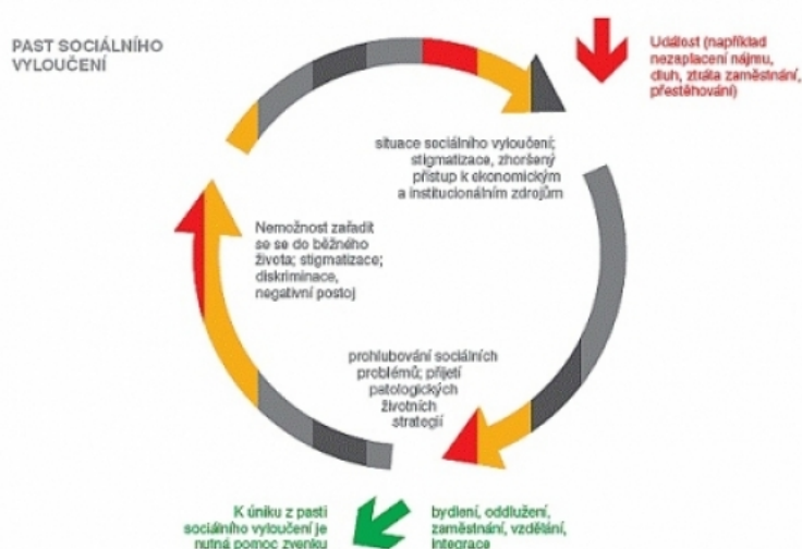
Obrázek č. 1 Schéma sociálního vyloučení