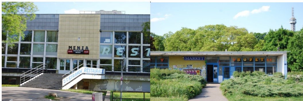
Fotografie č. 16: Menza s možností venkovního posezení.