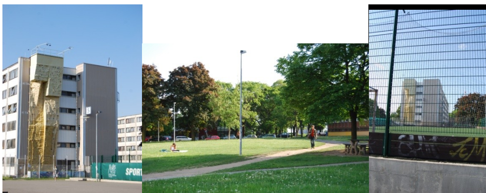
Fotografie č. 15: Ideální využití prostoru. Lezecká stěna na jedné z kolejních budov.