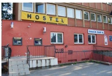
Fotografie č. 13