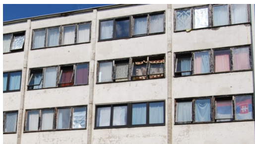
Fotografie č. 5