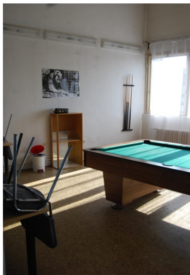
Fotografie č. 10