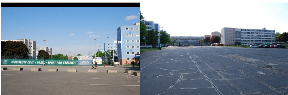
Fotografie č. 2

Foto č. 1: Celkový pohled na strahovské koleje.