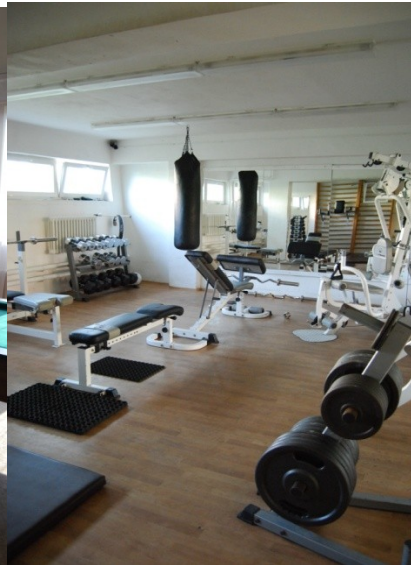
Fotografie č. 11