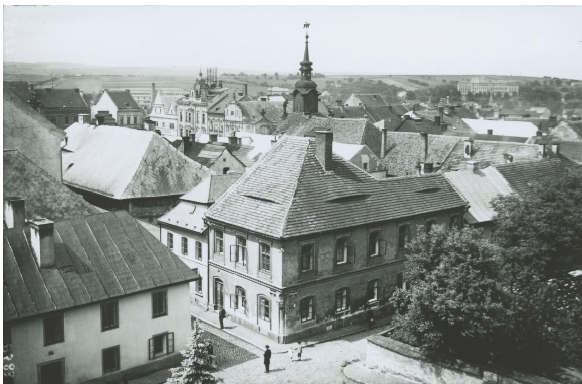
7: Dům čp. 8/I. v meziválečném období.