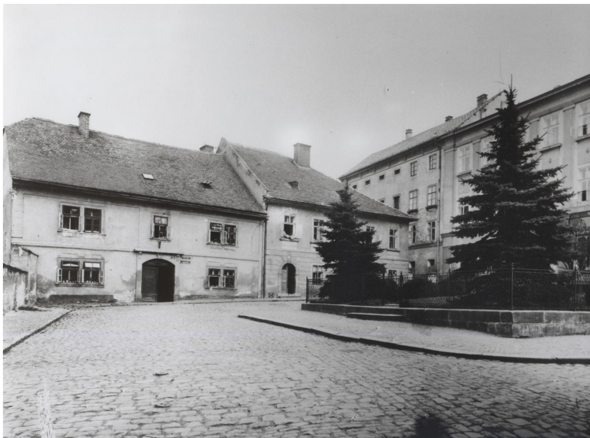
13: Domy čp. 44(vlevo) a 45/1.(vpravo) na Všeřdově náměstí před r. 1929.