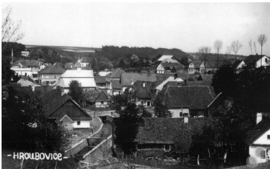
64: Hroubovice v meziválečném období.

Další židovské obce v chrudimském okrese zanikaly většinou ještě dlouho před druhou světovou válkou následkem stěhování do měst. Mezi tyto obce patří Přestavky, kde se dochoval hřbitov a dům, kde byla synagoga, jakož i dům, kde byla rituální lázeň, mikve. Dále Zájezdec, kde se dodnes dochoval pouze hřbitov, a obec Dřevíkov, kde se dochovala celá židovská ulička včetně synagogy, dnes již přestavěné na obytný dům, a v původní podobě jakožto nemovitá kulturní památka existuje dodnes roubená chalupa čp. 47, kde bývala vinopalna a později též pekárna. Pro zajímavost, tento citlivě renovovaný dům byl v nedávné době na prodej za částku o málo přesahující půl milionu korun – tržní cena je dána zcela jinými faktory, ve kterých historická hodnota nemovité kulturní památky na trhu s nemovitostmi bývá považována často spíše jako přítěž. Dále najdeme stopy židovské obce v Hlinsku, a to hřbitov a budovu synagogy, která byla postavená v roce 1907, až 15 let potom, co po právní stránce zdejší židovská obec přestala být samostatnou židovskou obcí a byla přičleněna k obci heřmanoměstecké. Synagoga byla již před válkou prodána, dnes slouží jako muzeum a je k nepoznání přestavěná. Protože židovské osídlení Hlinska spadá především do 2. poloviny 19. století, nenajdeme zde žádnou židovskou čtvrť ani ulici, jako v místech se starším osídlením. Až do druhé světové války hráli Židé v Hlinsku významnou roli na poli průmyslové výroby – můžeme jmenovat kožešnickou továrnu Rudolfa Schulhofa,