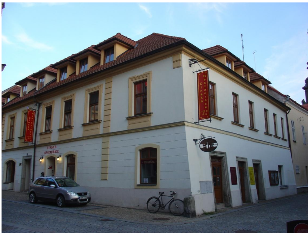
39: Dům ve Filištínské ulici čp. 139/I.