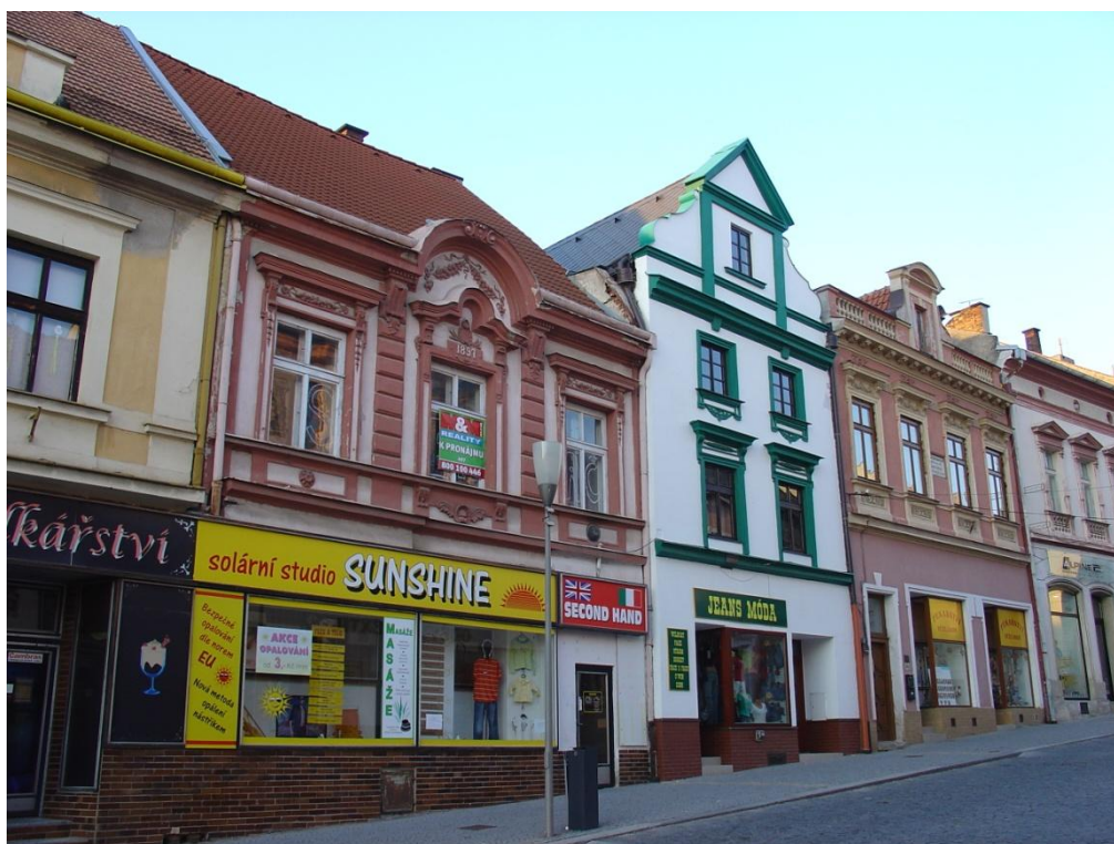
31: Domy v Široké ulici, zleva čp. 122/I., uprostřed čp. 123/I., vpravo čp. 124/I.