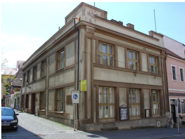
28: Dnešní podoba domu čp. 116/I. pochází z meziválečného období.