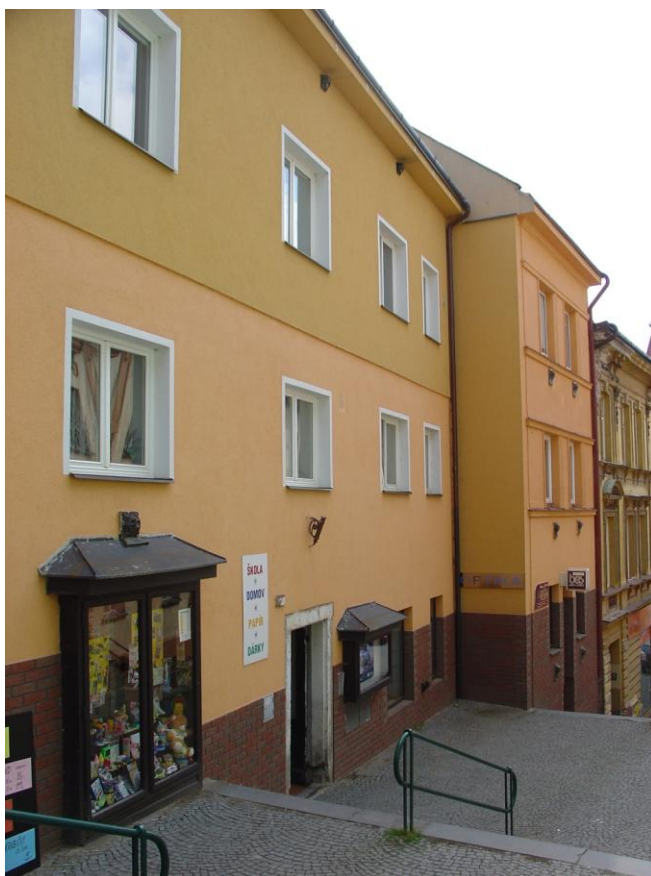
40. Dnešní podoba domu čp. 109/II.