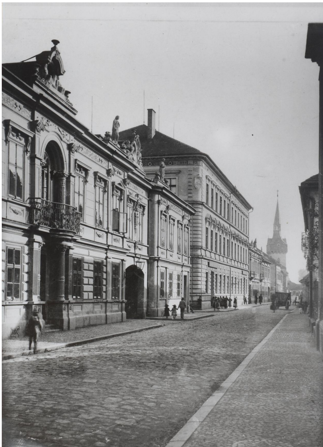
Obrázek 44: Dům čp. 11/III. (na obrázku vlevo) v Husově ulici.

(11/III.) – dnes již neexistující dům rodiny Fitterů v Husově ulici. Sem se přestěhovala (dle údajů z roku 1900) rodina Bernarda Löwyho (viz. čp. 79/I.).