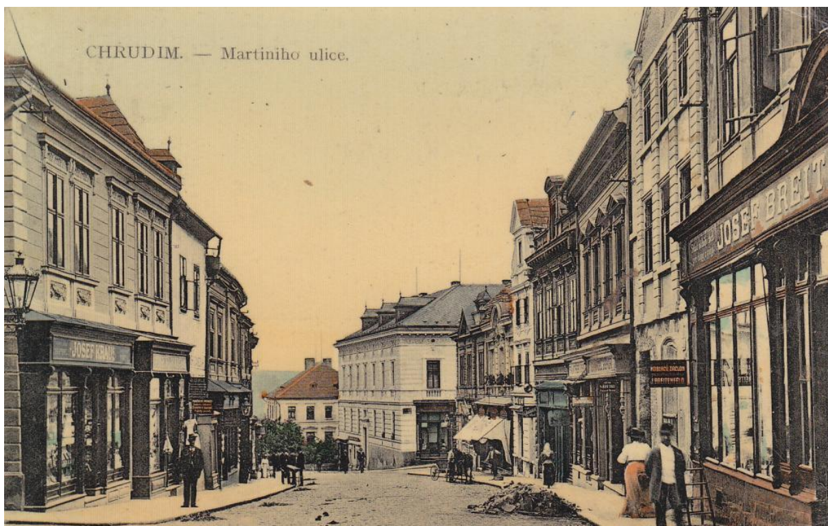
25: Martiniho ulice v roce 1912. Vlevo dům čp. 116/I., papírnictví Josefa Krause a galanterie Josefa Reicha, později provozovaná Theodorem Weissbarthem, zcela vpravo je vidět dům čp. 127/I. s výkladem obchodu střížním zbožím Josefa Breitenfelda.