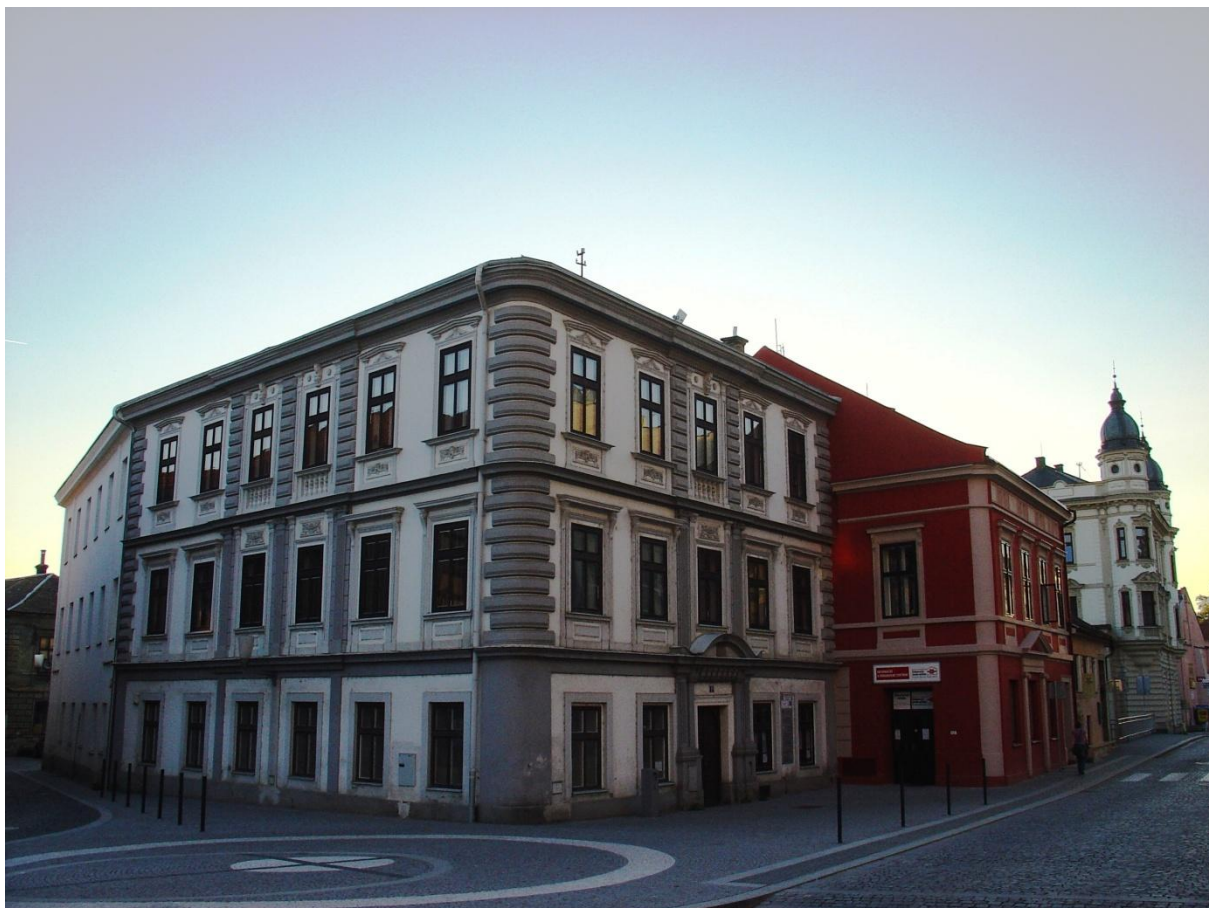
49: Dům čp. 29/IV.