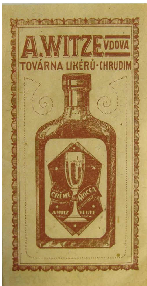
1. Reklamní účtenka Witzovy továrny na likéry z archivu Regionálního muzea v Chrudimi