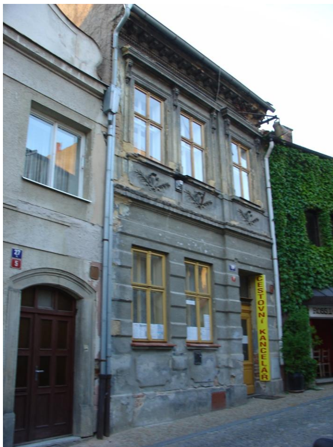
11: Filištiná ul. čp. 28/I.