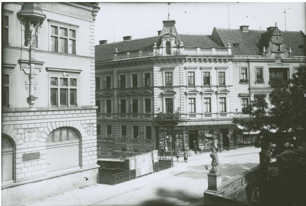
58:Dům Adlerových v roce 1925.