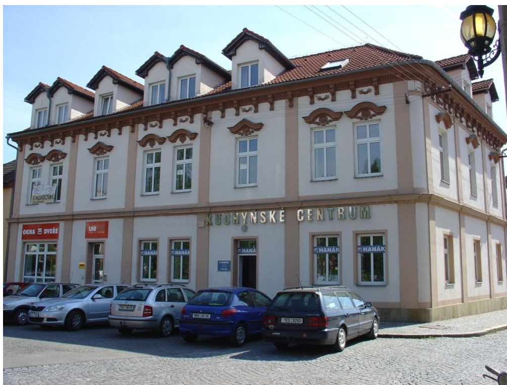
54: Dům čp. 73-74/IV. v Poděbradově ulici