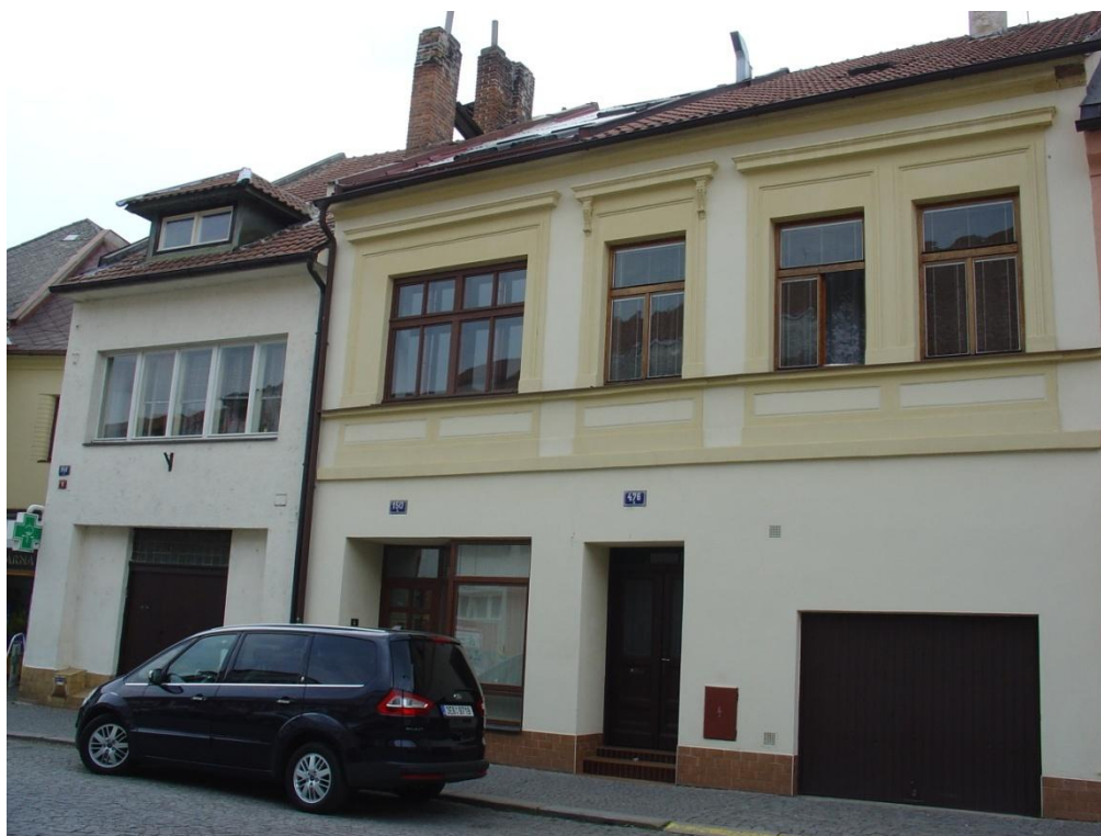
43: Havlíčkova ul. čp. 150/II.