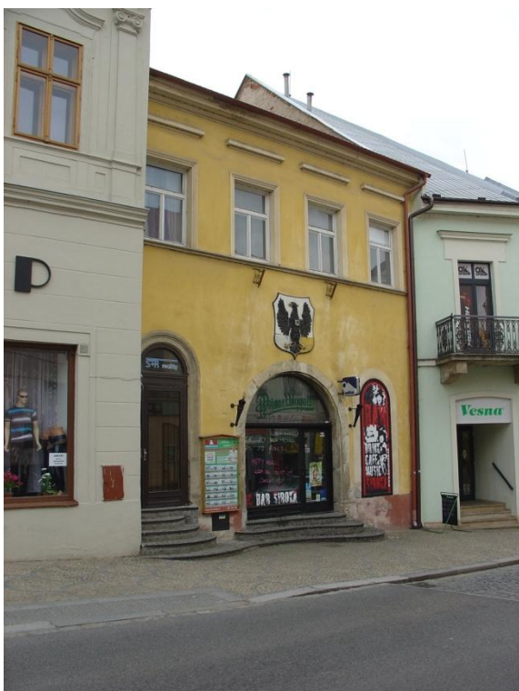
27. Široká ul. čp. 115/I.