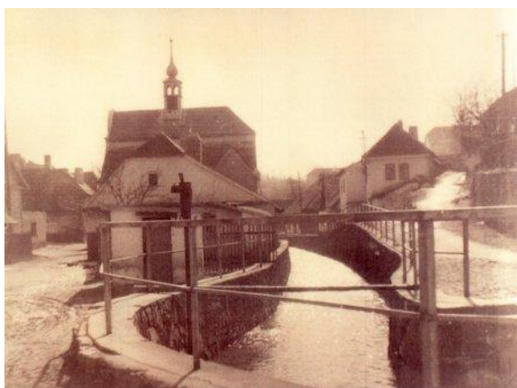
63: Hroubovicá synagoga se židovskou školou.

Barokní synagoga z konce 18. století s mansardovou střechou s věžičkou a hodinami, která stála jen o pár metrů dál, byla jedinou sakrální stavbou v Hroubovicích. Vymkla se díky toleranci zdejší vrchnosti jak církevním nařízením, kvůli nimž se až do emancipace nestavěly synagogy s věžemi, tak unikla i nacistickému běsnění a vypalování. Definitivní zkáza ji však postihla pouhých deset let před koncem komunistické éry, v roce 1979, pět let potom, co „ustoupila“ v akci Zet sousední budova německé židovské školy. Důvodem byl oficiálně mimojiné i špatný stav obou objektů. Další přišel v rámci žízňě po modernizaci na řadu demoliční výměr na chaloupku na tomto obrázku. Chaloupka měla však delší trvání než lidovědemokratický režim internacionálníhoho socialismu a dodones slouží rekreačním účelům.