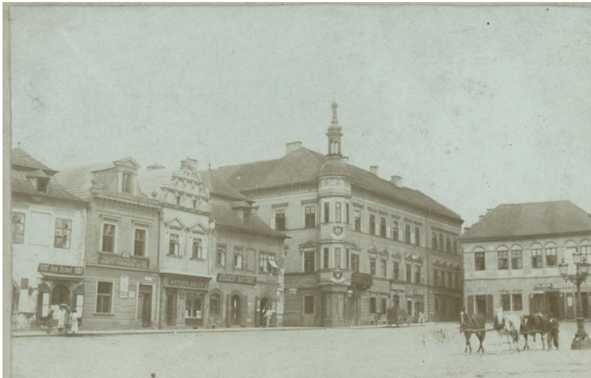
8: Dům čp. 11/I. - J. Freund - lihoviny (nárožní dům s věžičkou) a čp. 54/I. - V. Lengsfeld - kůže (dům zcela vpravo).

(Čp 11-12-13/I) Tento dům byl součástí severovýchodní fronty Resslerova (Riegrova) náměstí 9 .