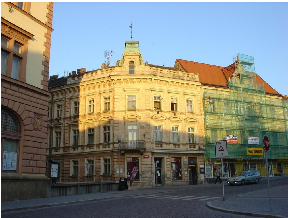
56: Dům Adlerových v Široké ulici čp. 87/IV.