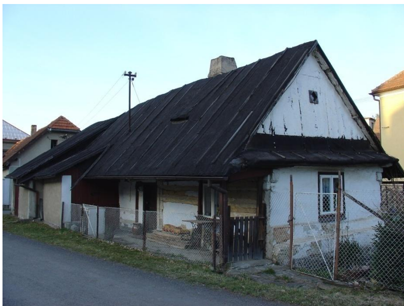
62: Poslední roubená chalupa v centru obce Hroubovice stála v těsné blízkosti synagogy. I ji měl v akci Zet potkat stejný osud, ale zázrakem zůstalo jen u záměru. Na štítu je při bližším ohledání patrná stopa po chybějícím kabřinci.

Barokní synagoga z konce 18. století s mansardovou střechou s věžičkou a hodinami, která stála jen o pár metrů dál, byla jedinou sakrální stavbou v Hroubovicích. Vymkla se díky toleranci zdejší vrchnosti jak církevním nařízením, kvůli nimž se až do emancipace nestavěly synagogy s věžemi, tak unikla i nacistickému běsnění a vypalování. Definitivní zkáza ji však postihla pouhých deset let před koncem komunistické éry, v roce 1979, pět let potom, co „ustoupila“ v akci Zet sousední budova německé židovské školy. Důvodem byl oficiálně mimojiné i špatný stav obou objektů. Další přišel v rámci žízňě po modernizaci na řadu demoliční výměr na chaloupku na tomto obrázku. Chaloupka měla však delší trvání než lidovědemokratický režim internacionálníhoho socialismu a dodones slouží rekreačním účelům.