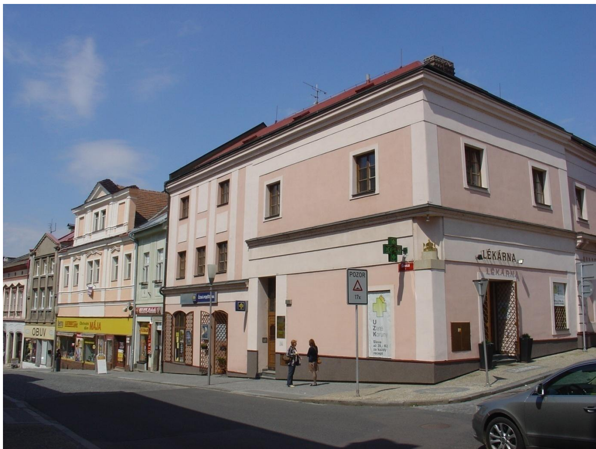
34: Domy čp. 129/I. a 130/I. na rohu Široké ulice Resslerova náměstí