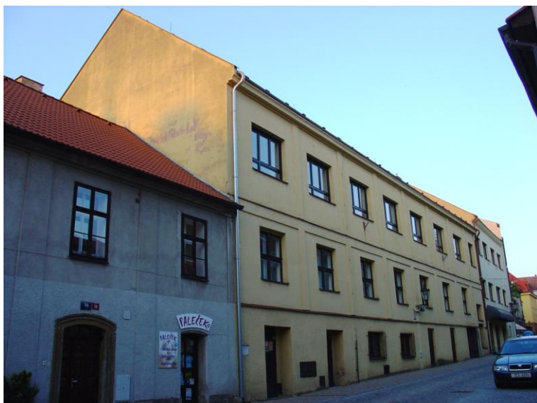
12: Současná podoba domu čp. 35/I. ve Filištiné ulici