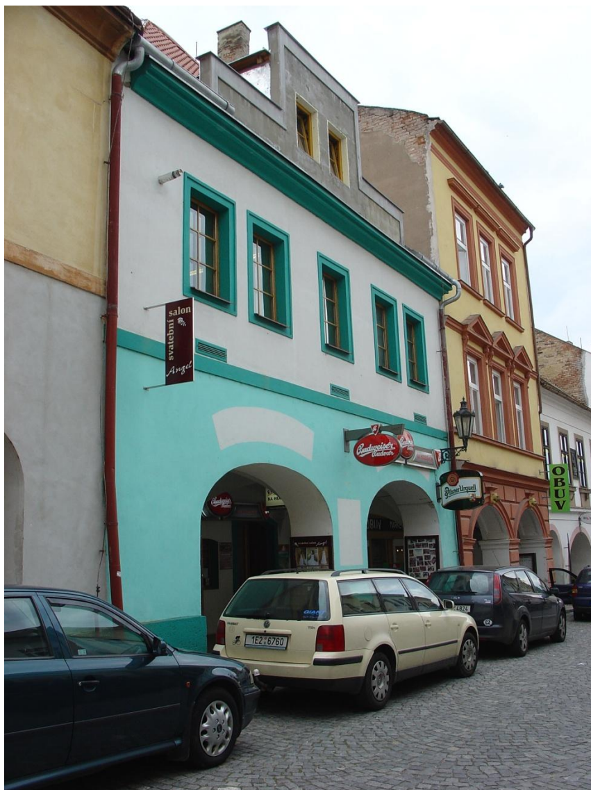
18:Štěpánkova ul. čp. 87/I. a čp. (vlevo) 88/I. (vpravo)