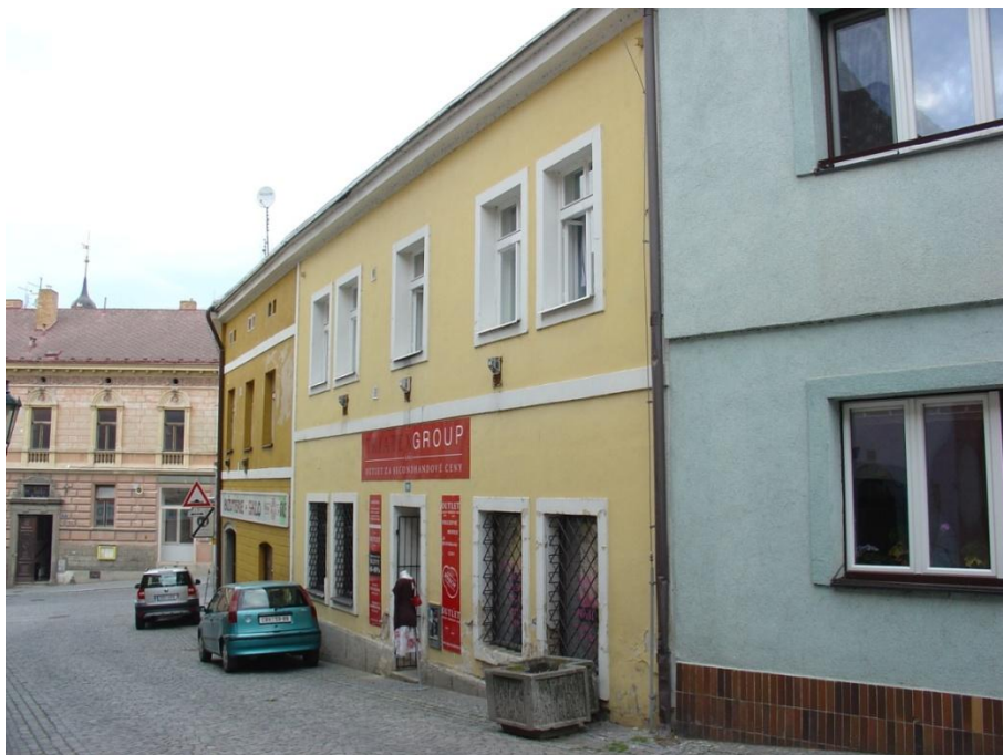
22: Štěpánkova ul. čp. 101/I.

Mořic Pick zemřel 6. prosince. 1922. Ačkoli byla jeho manželka i děti katolíci, on sám byl pochován na chrudimském židovském hřbitově.