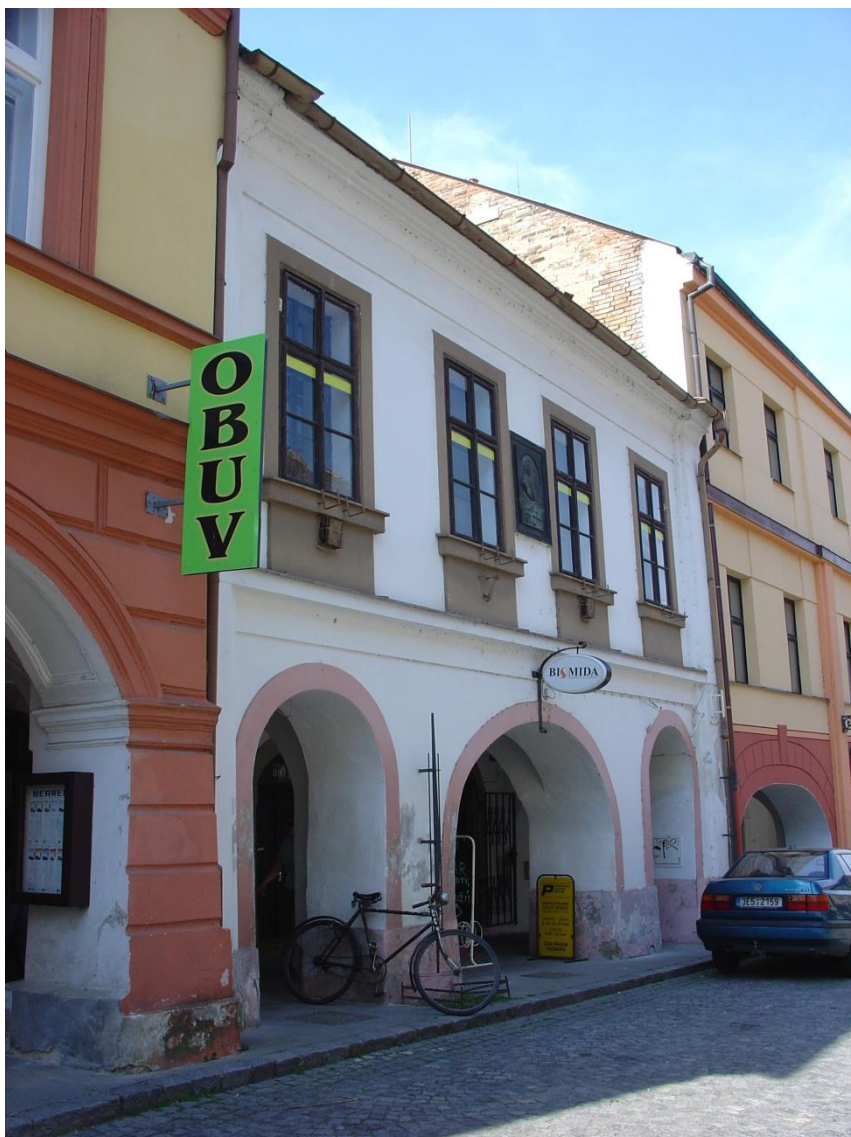
19: Štěpánkova ul. čp. 89/I.