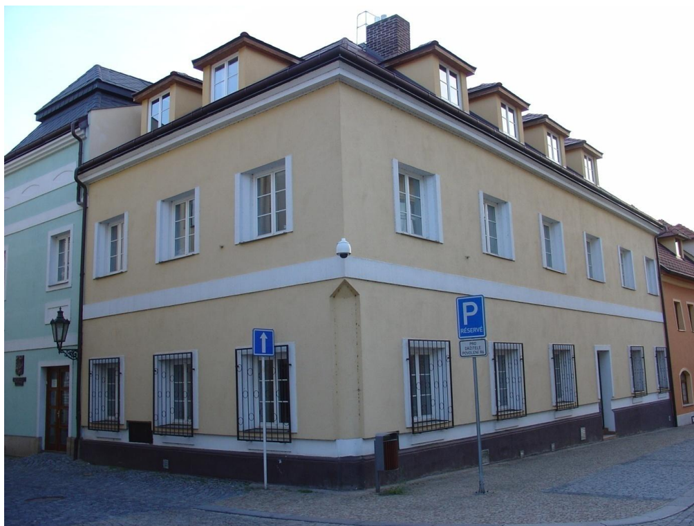
6: Dnešní podoba domu čp. 8/I. ve Filištýnské ulici.

8/I. – V tomto domě na rohu Filištýnské ulice měl v roce 1910 obuvnickou továrnu Emil Grodecký . (Od r. 1907 měl továrnu na obuv ve Skutči.) Bydlel (dle údajů z roku 1921) v Heydukově ulici čp. 3/II.(viz níže čp. 3/II.).