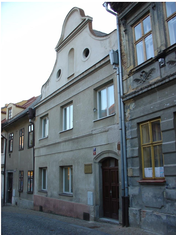
10: Filištiná ul. čp. 27/I.