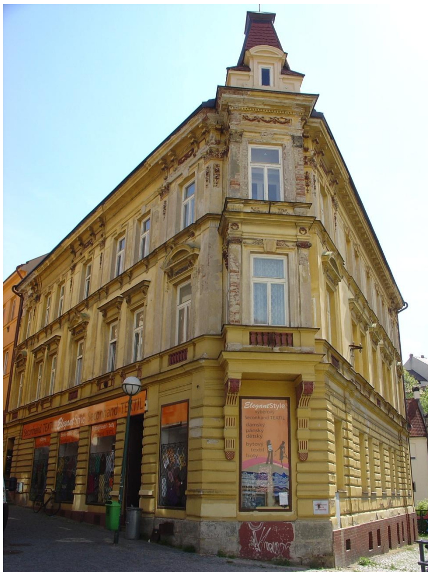
42: Dům čp. 110/II. na dolním konci Širokých schodů