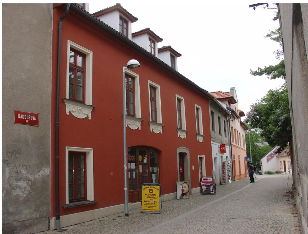
48: Dům čp. 14/IV. v Radoušově ulici