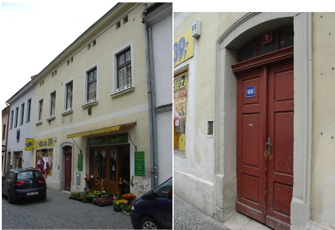
23. Štěpánkova ul. čp. 106/I.