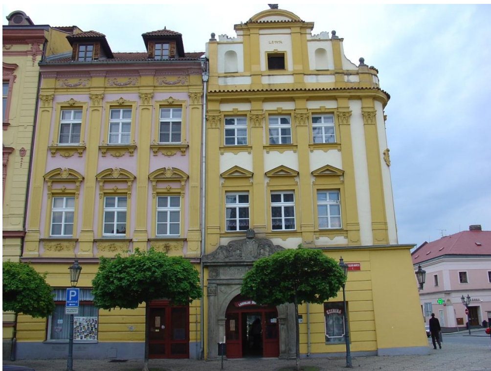
26. Resselovo náměstí čp. 111-112/I.

111 – 112/I. (dva domy na rohu Martiniho – Široké a Riegerova, dnes Resselova náměstí).