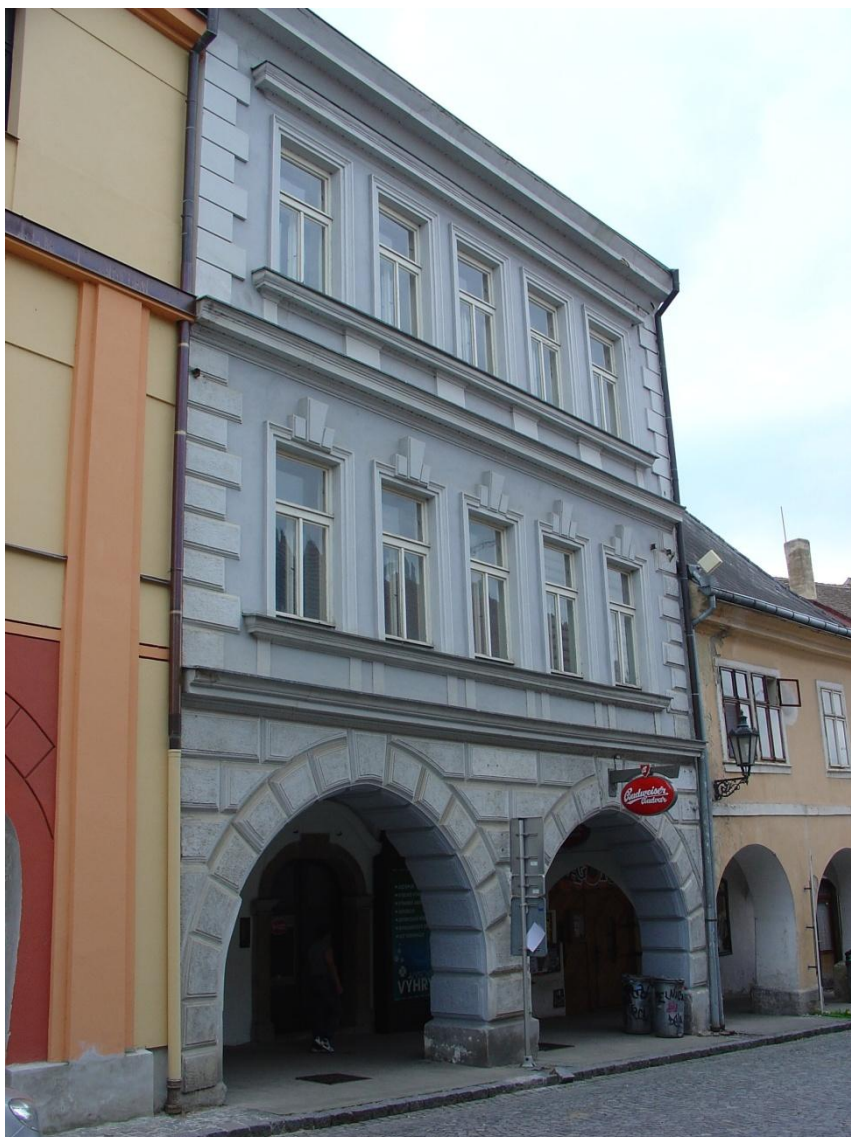
20: Štěpánkova ul. čp. 91/I.

Karolína Lavecká zemřela 10. dubna 1919 a je pochována na chrudimském židovském hřbitově spolu se svým synem Hugem, „vrchním oficiálem okresního úřadu ve výslužbě“, zesnulým v r. 1938 21 . Opodál najdeme i hrob Arnošta Laveckého, zesnulého 17. Dubna 1935.