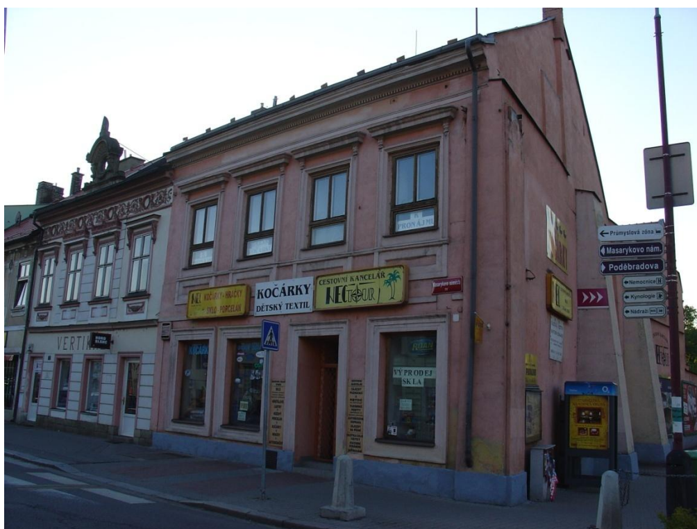
52: Dům čp. 64/IV. na Masarykově náměstí, kde bývala nějakou dobu v prvním patře modlitebna

Čp. 64/IV. – V tomto domě byla od roku 1887 modlitbna, než byla přestěhována do pronajatých prostor v prvním patře tehdy nového domu 211/IV.