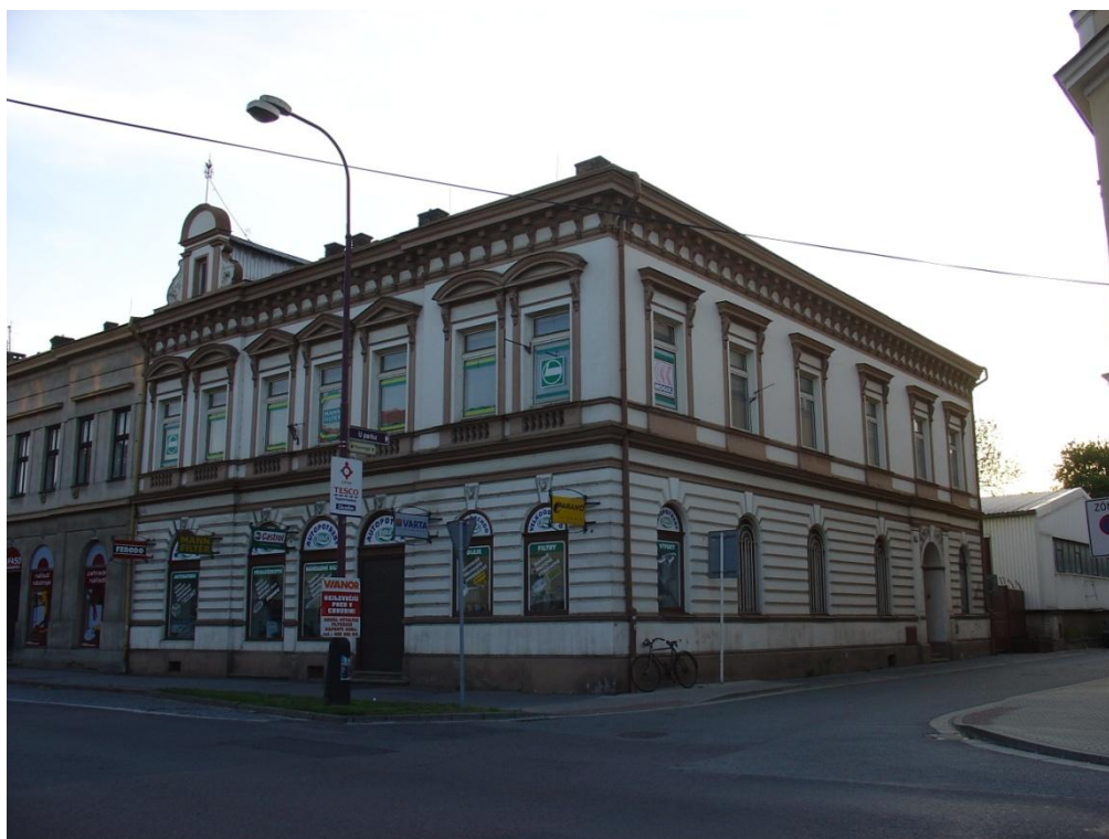
60: Dům Salusových v Poděbradově ulici č. 330/IV.