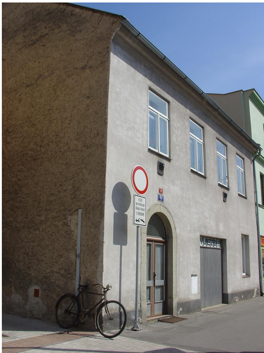
50: Dům čp. 60/IV. na Masarykově náměstí.