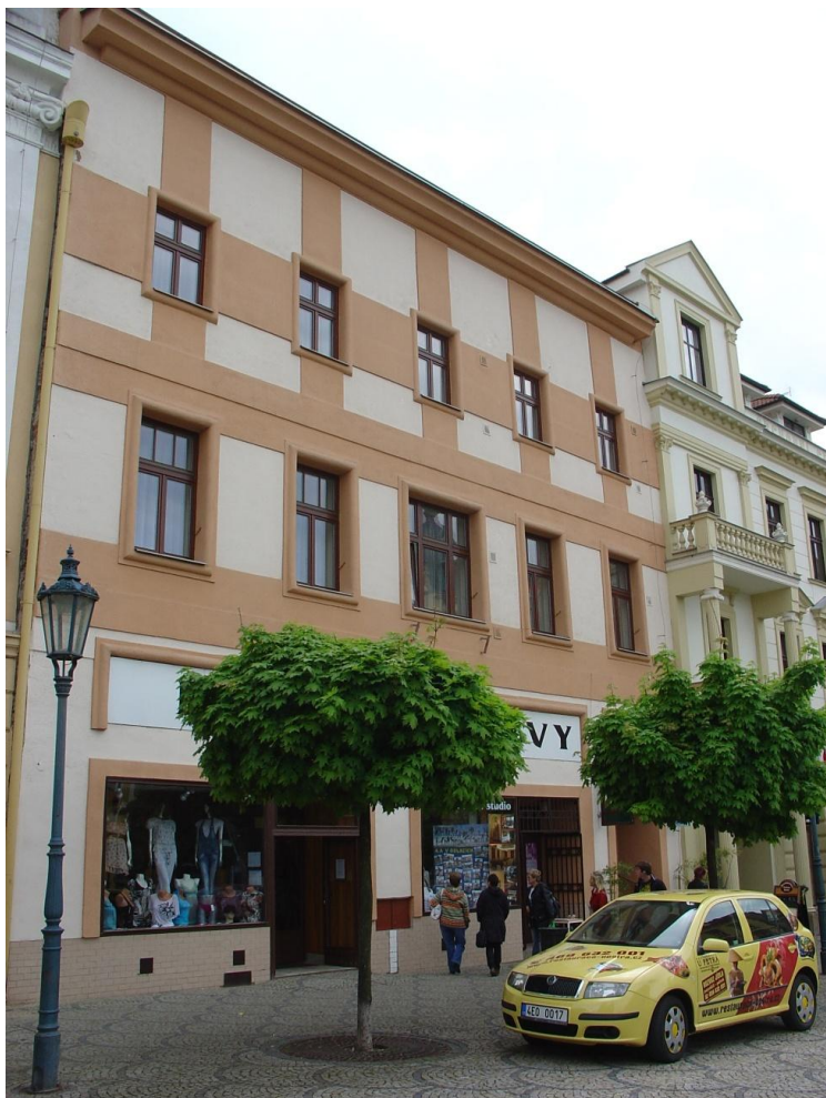
16: Současná podoba domu na Resslerově náměstí čp. 79/I.