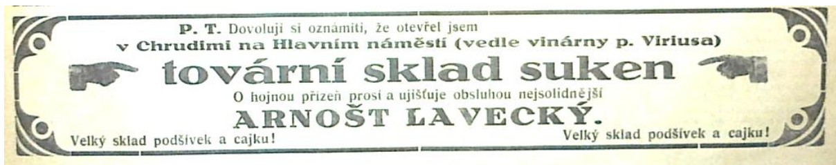
4: Dobová inzerce Arnošta Laveckého v regionálním Tisku. Chrudimský Kraj 1925, č. 17. Archiv RM Chrudim