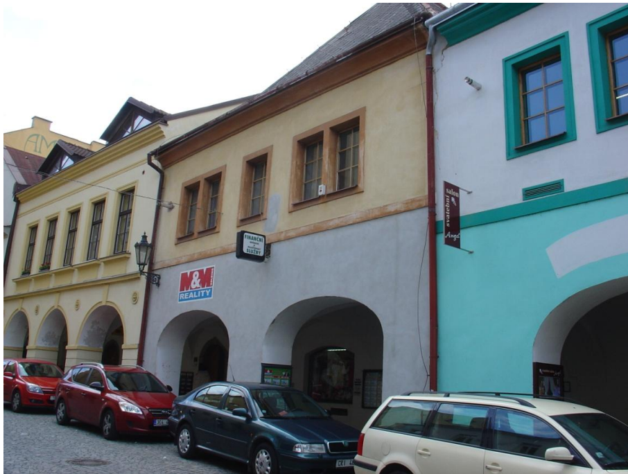
17: Štěpánkova ul. čp. 86/1.