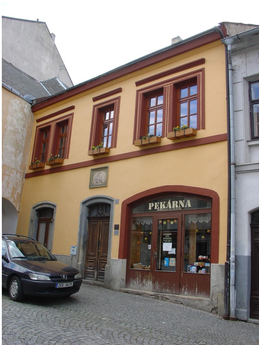
21: Štěpánkova ul. čp. 93/I.