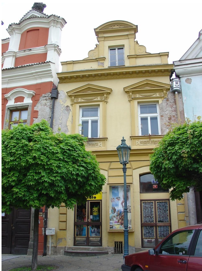
2:Dům čp. 2/I. na Resselově náměstí.