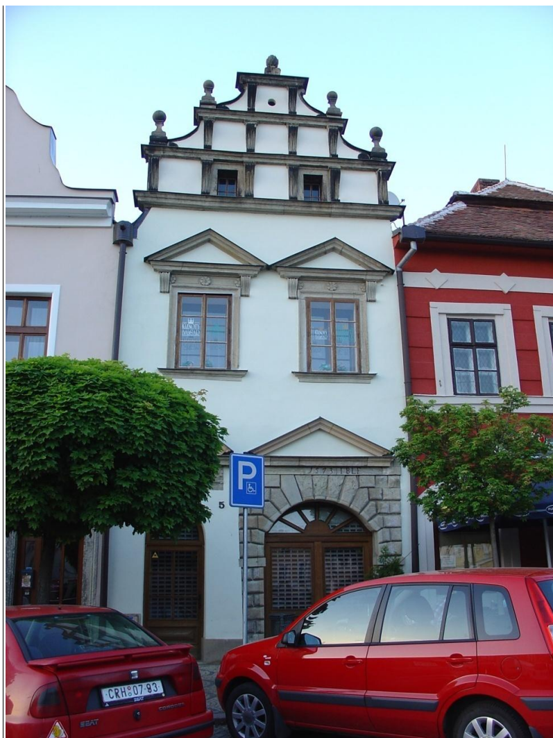
5: Dům čp. 5/I.