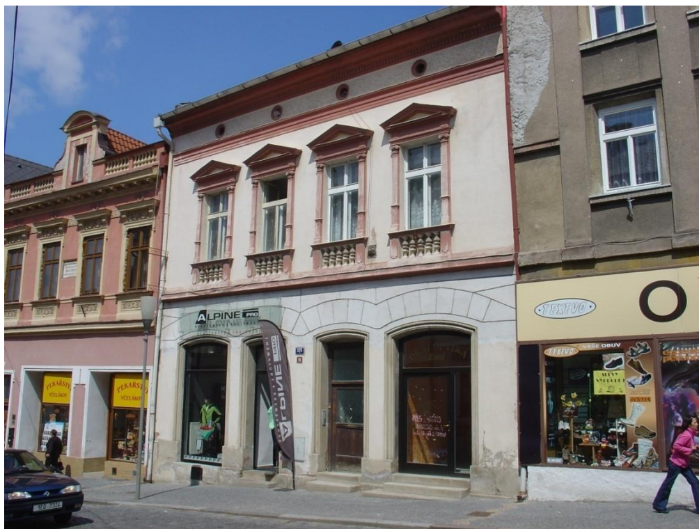
32: Široká ulice, dům čp. 125/I.