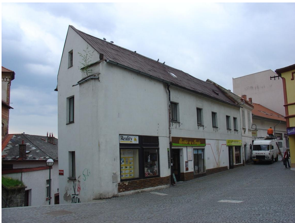
15: Břetislavova čp. 69/I., foto autor