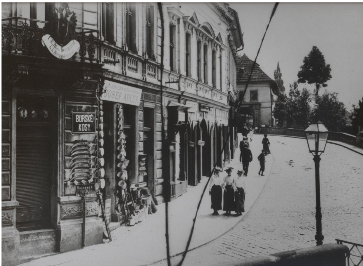
59:Pěkný detail Adlerova železářského obchodu je vidět na snímku dolní části Martiniho ulice, dnešní Široké z r. 1900.