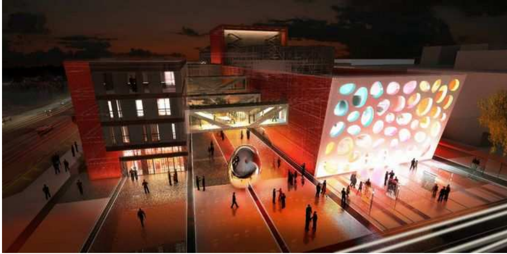
Obrázek 4: Vizualizace novostavby divadla.