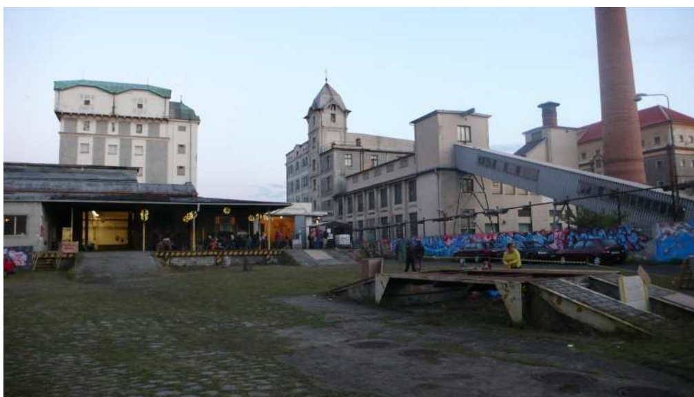
Obrázek 3: Areál Světovar (budoucí 4x4 Cultural Factory).