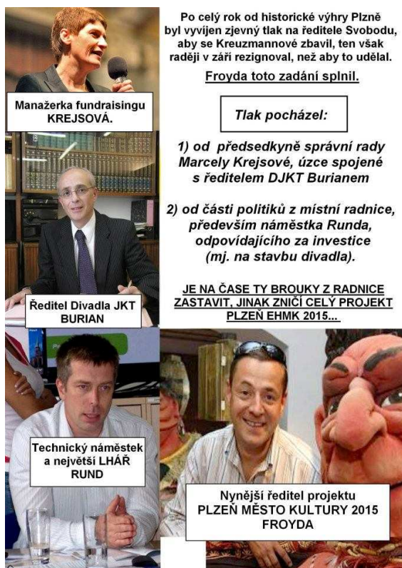
Obrázek 5: Spekulace ohledně projektu Plzeň EHMK 2015, 1.