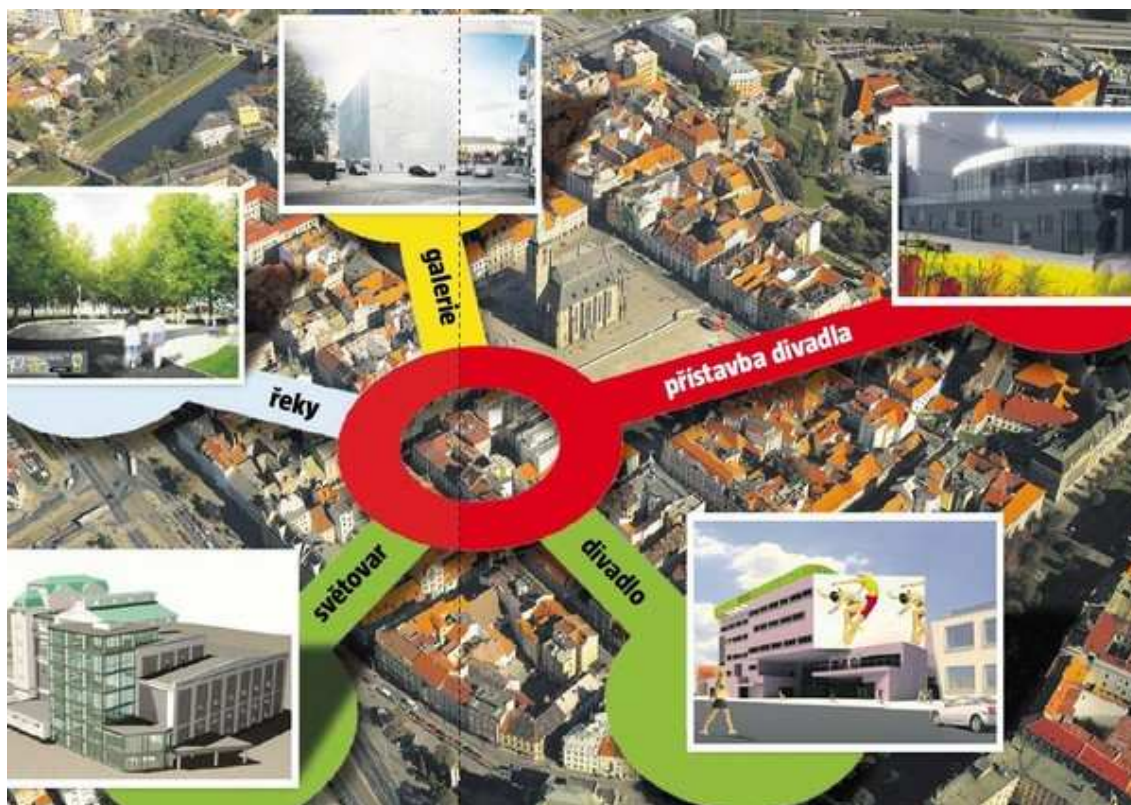
Obrázek 2: Plánované klíčové infrastrukturní projekty v období kandidatury.

Dá se říci, že těmito plány projekt EHMK reaguje na současné urbanistické problémy ve městě (viz Útvar koncepce a rozvoje 2010) tím, že nachází řešení pro doplnění urbanistické struktury centra (případně její změny v některých lokalitách) a dostavbu volných proluk; využití potenciálu veřejných ploch pro pořádání kulturních, sportovních, společenských a volnočasových akcí či pro revitalizaci nábřeží a náplavek řek.