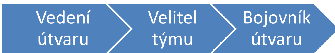
Obrázek č. 2 – Kontinuum ÚRN

Celkově tedy dynamiku uvnitř útvaru hodnotím jako kolektiv nadšenců a zapálených jedinců, kteří usilují o tom, být ve své práci nejlepší. Zároveň mezi sebou udržují velmi přátelské vztahy. Ty z vlastní zkušenosti hodnotím jako velmi pevné, plné vtipkování a humorných situací, kdy však v rozhodující chvíli dojde k jakémusi přepnutí, které se vyznačuje plným soustředěním a orientací na dosažení cíle. Zajímavé bylo sledovat cvičící skupinu, která se vzájemně podrobuje kritice a snaží se vychytat slabé stránky v provedené akci. Bojovníci si například sami vyčítali, že byli v provedení příliš pomalí a vzájemně se motivovali k vyššímu výkonu, o který se ihned v následujícím cvičném zásahu pokusili. Následovalo opětovné vyhodnocení, kdy i přes spokojenost s vylepšením opět chtěli dosáhnout zlepšení. Výše popsané motivace k výkonnosti jsem na tomto základě mohl pozorovat, jsem si však vědom toho, že je zde limitace omezené časové jednotky takového pozorování.