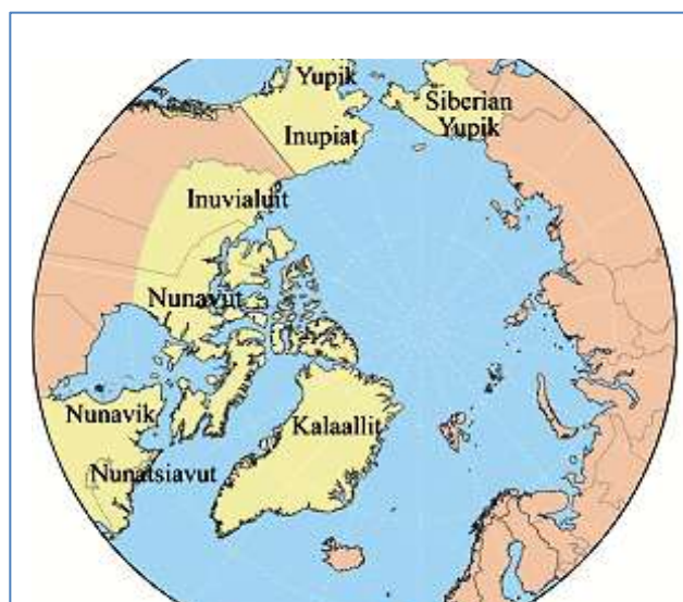
Zjednodušená mapa rozmístění Inuitů (Stanovský, 2007, [online]).

Inuité žijí v Arktických oblastech Kanady, USA (na Aljašce), v Grónsku a na Sibiři. Já se v rámci této práce budu zabývat jen těmi, co žijí na Aljašce a to ještě úžeji jen Yupiky a Inupiaty. I na Aljašce je obyvatelstvo různorodé, což dobře ilustruje to, že i v rámci vesnic, které jsou v rámci statistik klasifikovány jako území domorodých