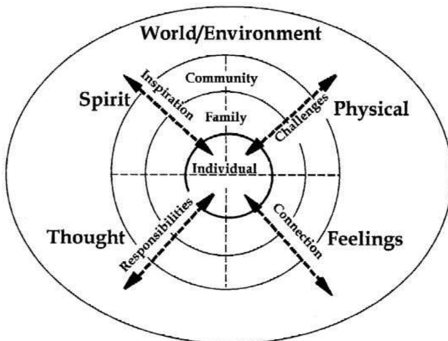
Figure 1. Alaska Native worldview.

Journal of Community Psychology, September 2001