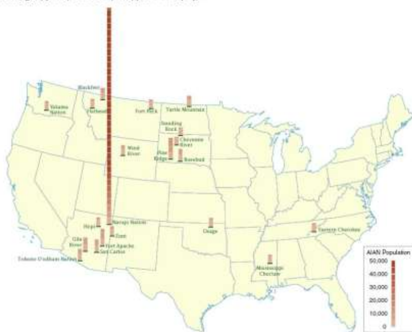
Figure 7. Top 20 Reservations and Alaska Native Village Statistical Areas With the Largest American Indian and Alaska Native (AIAN) Alone Population: 2010 (For information on confidentiality protection, nonsampling error, and definitions, see www.census.gov/prod/cen2010/doc/pl94-171.pdf )

Příloha č. 4: Rezervace s největším počtem původních obyvatel Ameriky (obrázek)