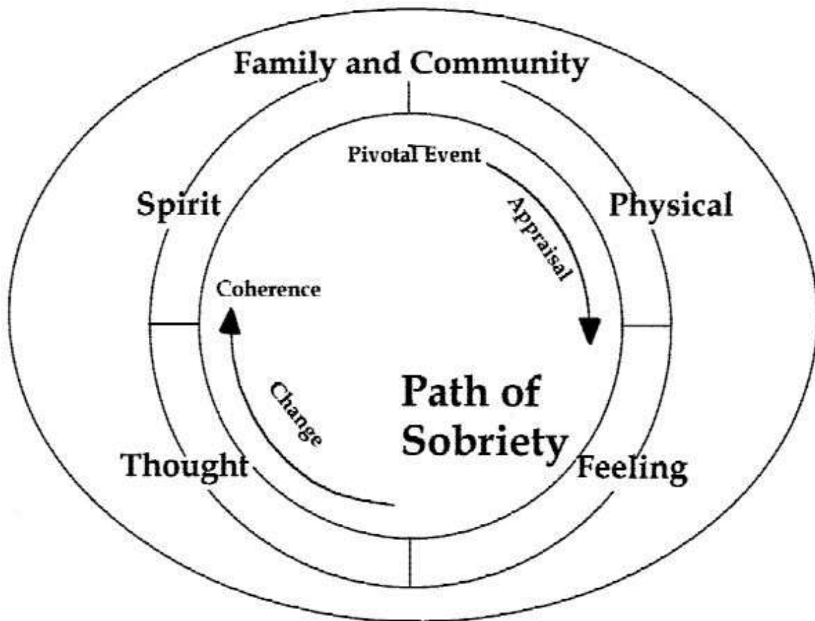
Figure 2. Theoretical model for the path of sobriety among Alaska Natives.

Příloha č. 7: Teoretický model cesty ke střízlivosti podle Aljašských Inuitů (obrázek)