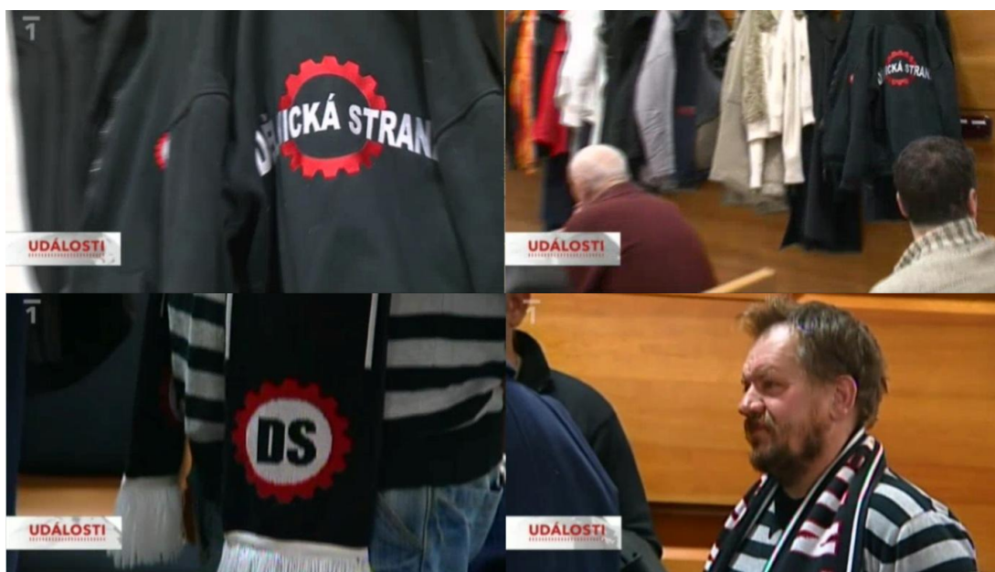
Obr. 8 – V první řadě oddálení mikiny s nápisem Dělnická strana. V druhé řadě jeden z příznivců strany zachycený přejezdem odzdola nahoru. (Události. TV, ČT 14. ledna 2010. 19:00.)