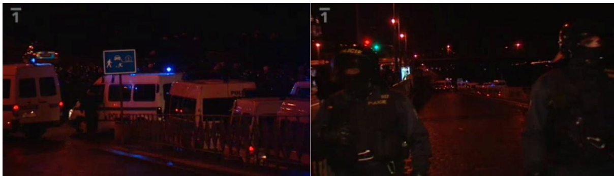
Obr. 5 – Oddálení od místa střetů s blikajícími policejními vozy k řadě těžkooděnců. Samotné zatýkání bylo zobrazeno v polocelcích a obvykle nebylo vidět zatýkaným do obličeje. (Události. TV, ČT 17. listopadu 2009. 19:00.)

Další větší akce Dělnické strany ČT nepokrývala. V ilustračních záběrech se přesto objevila i některá další shromáždění DS. Tyto záběry se vyznačují tím, že jde především o polocelky až celky. Detaily jsou výjimečné. Řečníci jsou zabíráni z velké dálky a akce tak působí konspiračně a nedůvěryhodně. Některé záběry jsou téměř až špionážní. Reportáž odvysílaná 9. ledna přinesla obrázek předsedy Vandase, který řečnil u vlajky DS. Vandas byl zachycen zezadu, zdálky a kameraman jej pak pouze přiblížil. V popředí navíc stál policista. To vše členy i akce strany jistým způsobem odcizuje a vyvolává také pocit, že akce DS jsou nezákonné a není zcela bezpečné na ně chodit, jak prezentuje obrázek č. 6 (policisté se objevují na více záběrech ze shromáždění strany).