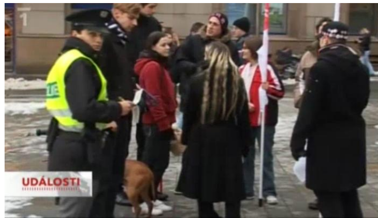
Příloha č. 6: Mítink DS, opět jako většinou v celku či zdálky. (Události. TV, ČT 16. září 2009. 19:00.)