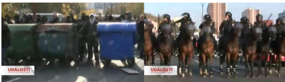
Obr. 1 – Protipohled radikálů a těžkooděnců na koních (byl proveden přejezdem). (Události. TV, ČT 13. ledna 2010. 19:00.)

na jedné straně sešikovaných těžkooděnců a na straně druhé extremistů se štíty či zakrytými obličejí. Tuto situaci vystihl i jiný druh záběrů, a to přibližný pohled na bojující extremisty, kde policisté byli v popředí záběru. Jak záběry vypadají, prezentují obrázky č. 1 a 2. Tyto záběry vyvolávaly dojem bitvy 37 . Demonstranti z těchto záběrů vzešli velmi negativně, protože se chovali agresivně. Kamery je zachytily, jak hází kameny, mají zbraně a napadají policisty. Doplňující záběry pak ukázaly výsledky střetů, zvláště zničený majetek. Například hořící auto městské policie.