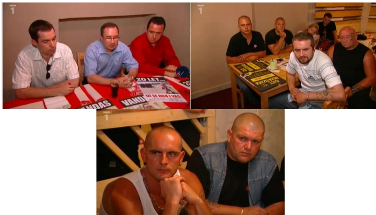
Obr. 11 – Triáda obrázků. Na první záběru vrcholní představitelé DS v čele s předsedou Vandasem, poté protipohled na „holohlavé“ posluchače z řad příznivců strany (v polodetailu a detailu). (Události. TV, ČT 22. prosince 2009. 19:00.)