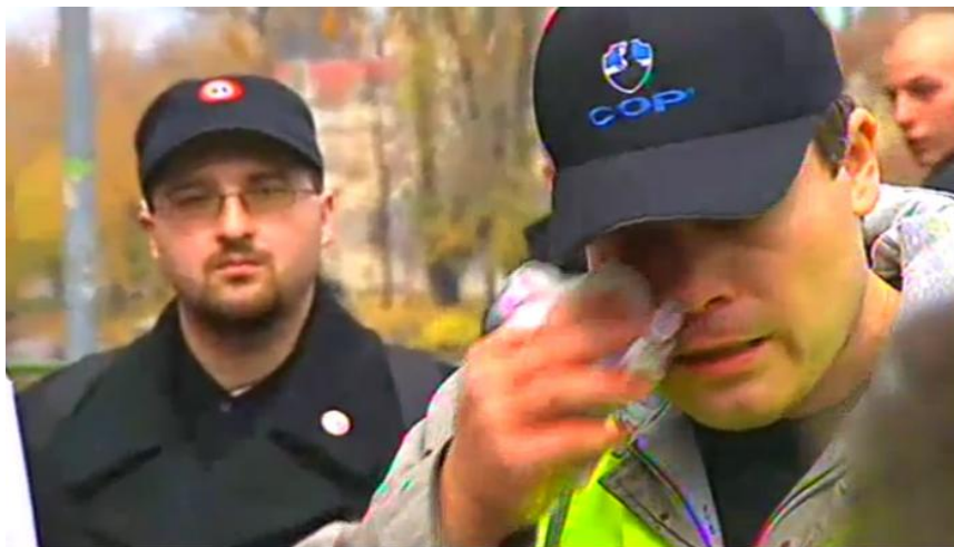
Obr. 4 – Zraněný novinář, za nímž stojí člen Dělnické strany. (Události. TV, ČT 17. listopadu 2009. 19:00.)

Třetí fáze reportáže se odehrávala už za tmy a popisuje šarvátky mezi neonacisty a policisty. Záběry zprvu cílí především na těžkooděnce, kteří šacují či zatýkají extremisty. Boje jsou snímány z dálky z ochozu a z nadhledu. Ústředním záběrem se stal ten, kde jeden z maskovaných útočníků útočí na policistu slzným plynem. Místo střetů a stojící těžkooděnce, kteří obklíčili místo, propojil oddalující záběr (viz obrázek č. 5). Detaily zabíraly především zničené vybavení policie, například rozbité okno antonu. Reportáž neonacisty vykreslila jak obrazově, tak slovně, velice negativně. Přesto organizátorům akce (kterou podle ČT pořádalo sdružení „Odporuj“) dala Česká televize prostor pro to se vyjádřit. Ti sice jakékoliv útoky popřeli, ale záběry hovořily jinak.