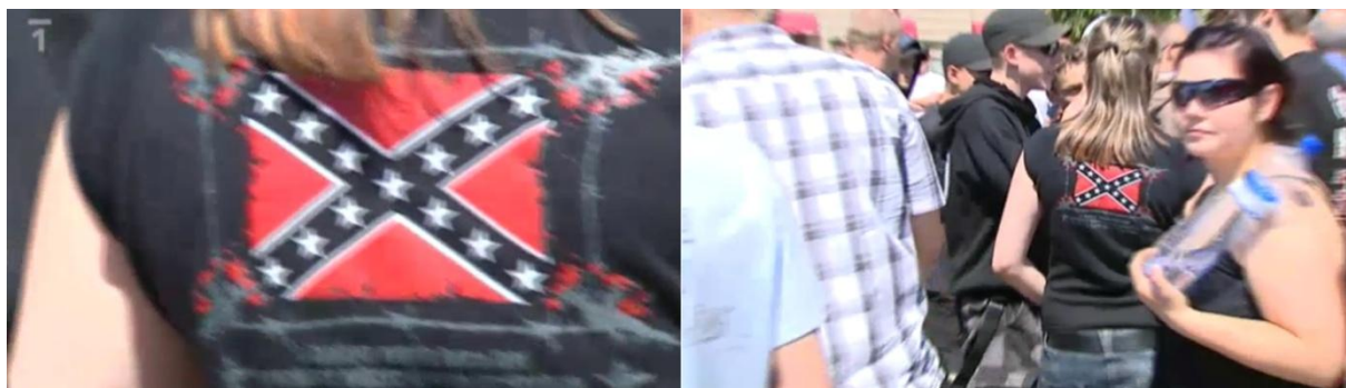
Obr. 12 – Oddálení na stoupenkyni DS a symbol, který má na zádech (jde o vlajku Americké konfederace, tedy amerického Jihu, velmi oblíbené mezi extremisty zvláště proto, že Jih podporoval otroctví s černochy). (Události. TV, ČT 10. října 2009. 19:00.)

Symbolika se stala vděčným tématem řady záběrů v reportážích ČT. V případě ilustračních záběrů z brněnského pochodu neonacistů z Národního odporu se na záběrech objevovaly velkoněmecké vlajky v nacionálně socialistických barvách, podobně se v reportáži ze 17. listopadu objevil několikrát záběr na vlajky DS, kterými mávali členové a stoupenci partaje. Zvláštní pozornost se v reportážích upínala k odznáčkům umístěným na kšiltovkách, oblíbené byly také šály, které měli členové strany u soudu. Právě logo DS se na různých materiálech objevovalo velmi často v závěrečných záběrech reportáží. Tyto záběry jednoduše identifikovaly účastníky a téma reportáže. Objevily se i další symboly, jako například vlajka americké konfederace (viz obrázek č. 12), které mohly divákům pomoci více charakterizovat jejich nositele (tento znak se mimo jiné pojí s rasismem). I když znak DS vycházel ze znaku nacistických odborů Deutsche Arbeitsfront a byl vyveden v nacionálně socialistických barvách, lze se jen těžko domnívat, že by tyto záběry laikům mohly dokazovat propojení členů DS s neonacistickou scénou. Přesto se v některých reportážích objevili neonacisté s vlajkami a později členové DS se svými vlajkami a jistá linka mezi těmito subjekty se mohla objevit. Zvláště díky tomu, že se akce DS podobaly některým akcím pořádaným neonacistickými skupinami.