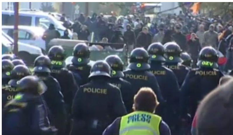
Obr. 2 – Těžkooděnci a na pozadí extremisté s barikádami z popelnic. (Události. TV, ČT 19. prosince 2009. 19:00.)

Druhým prvkem byl naopak protipohled řečnicích členů či příznivců strany na jedné straně, na druhé pak poslouchajícího či skandujícího davu. Řečníci a příznivci strany stáli s vlajkami DS, z nichž jeden byl oděn do dlouhého černého kabátu