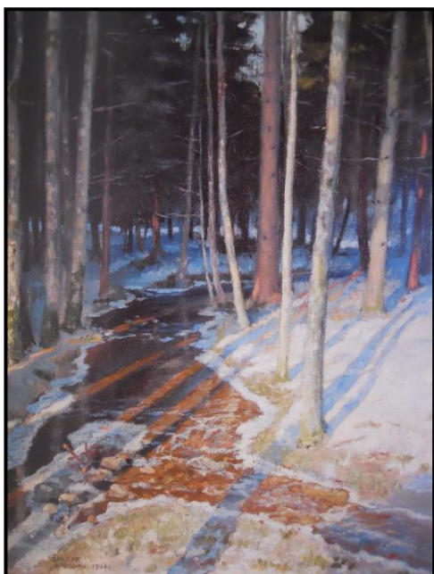
20. Jaroslav Špillar: Tání, 1902, olej, plátno, 95 x 77 cm, ZČG v Plzni.