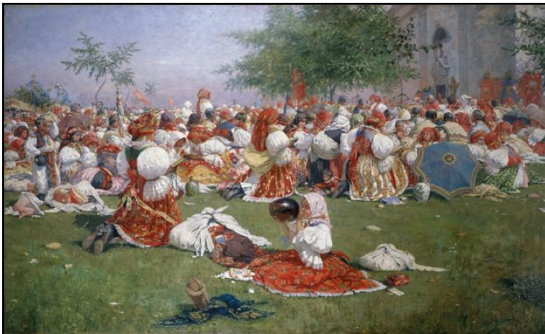
32. Joža Uprka: Pouť u sv. Antonínka, 1894, olej, plátno, 92 x 151, 5 cm, Moravská galerie v Brně.