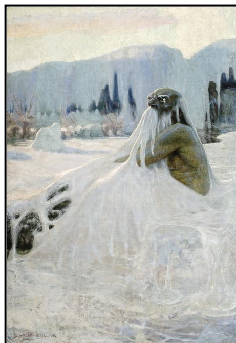
14. Jaroslav Špillar: Vodník, 1897 – 1898, olej, plátno, 111 x 77 cm, ZČG v Plzni.