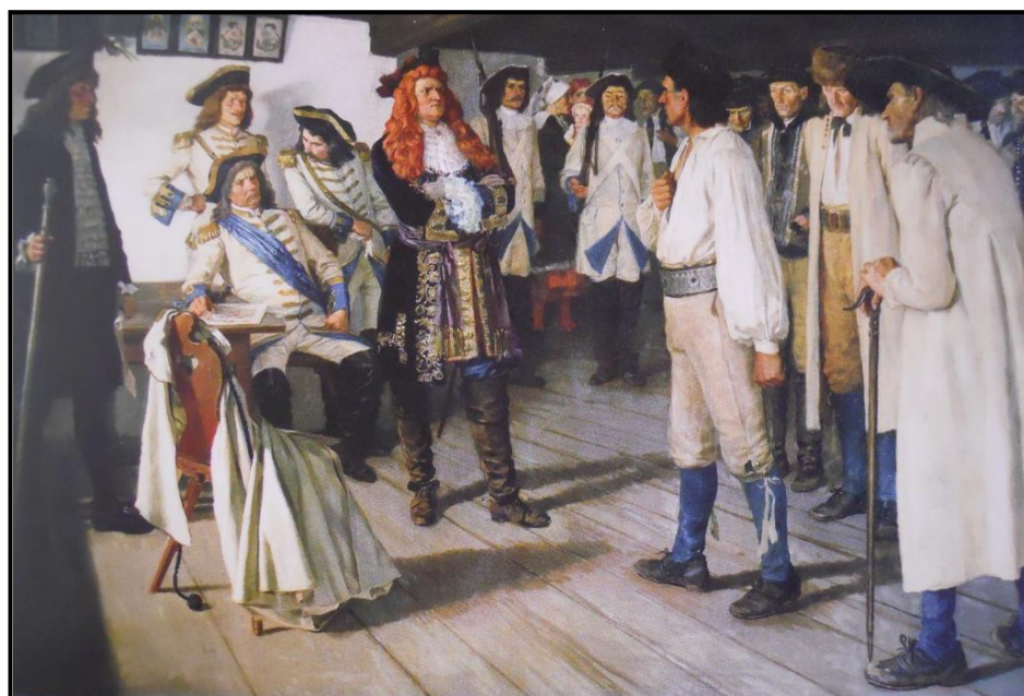
15. Jaroslav Špillar: Psohlavci I. / Kozina před Lomikarem, 1899, olej, plátno, 120 x 180 cm, ZČG v Plzni.