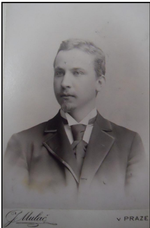
1. Jaroslav Špillar, portrét umělce, nedatováno, Archiv města Plzně, sign. 31. 601.