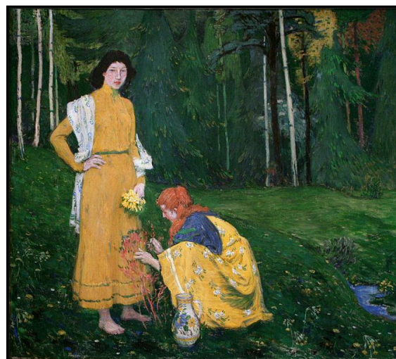
37. Jan Preisler: Jaro, 1906, olej, plátno, 118 x 132 cm, NG v Praze.