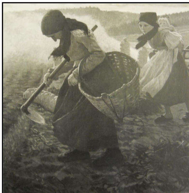
19. Jaroslav Špillar: Z dobývání brambor, 1902, olej, plátno, 116 x 121, 5 cm, ZČG v Plzni.