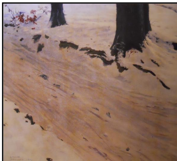
21. Jaroslav Špillar: Cesta v zimě, 1903, olej, plátno, 75 x 80 cm, ZČG v Plzni.