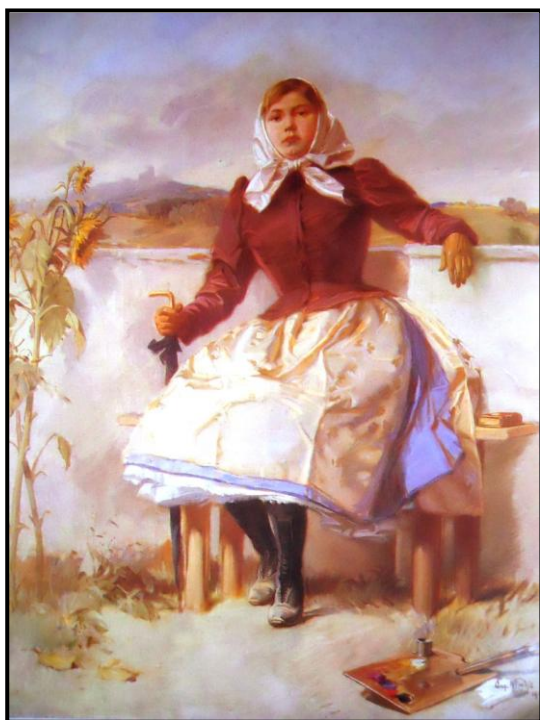
30. Augustin Němejc: Plzeňáčka, 1913, olej, plátno, 20 x 16 cm, ZČG v Plzni.