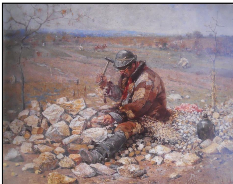
33. Joža Uprka: Štěrkač, 1895, olej, plátno, 83 x 104 cm, NG v Praze.