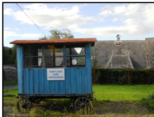
4. Pec pod Čerchovem, pojízdný ateliér Jaroslava Špillara.