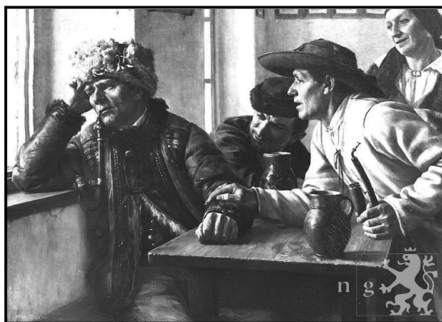
11. Jaroslav Špillar: Nedorozumění, 1896, olej, plátno, 77 x 103, 5 cm, Národní galerie