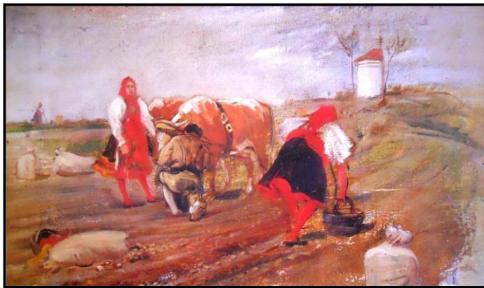
28. Augustin Němejc: Sbírání brambor, 1909, olej, plátno, 37 x 62 cm, ZČG v Plzni.