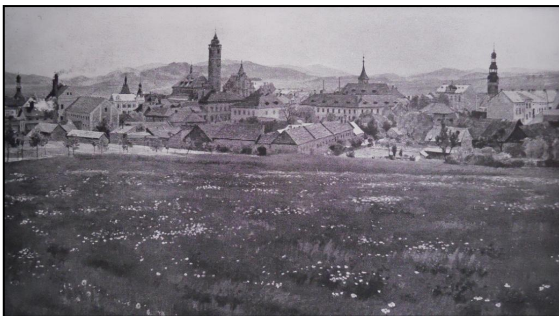
22. Jaroslav Špillar: Domažlice od severozápadu, 1903, olej, plátno, 115 x 181 cm.