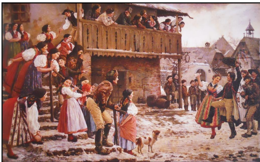
12. Jaroslav Špillar: Chodská svatba I., 1893, olej, plátno, 104 x 168 cm, ZČG v Plzni