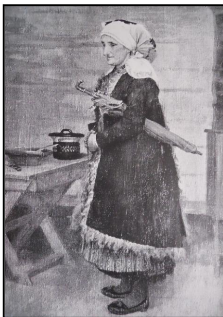
17. Jaroslav Špillar: Chodka v kožiše, 1901, olej, plátno, 68, 5 x 46 cm, ZČG v Plzni.