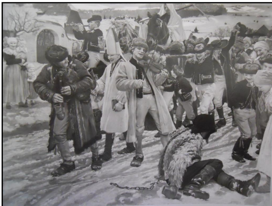
18. Jaroslav Špillar: Pochovávání masopustu, 1901, olej, plátno, 159, 5 x 200 cm, ZČG v Plzni.