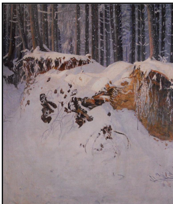
24. Jaroslav Špillar: Zima pod Čerchovem, 1904, olej, plátno, 116 x 101 cm, ZČG v Plzni.