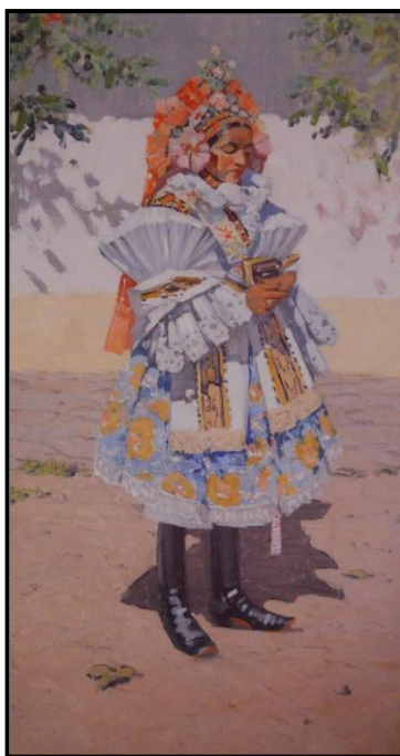
35. Joža Uprka: Nevēsta z Ostrožska, nedatovāno, olej, plātno, 104 x 56 cm, Sbirka Nadace Moravskē Slovācko.