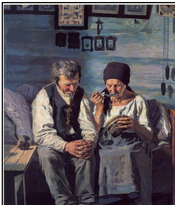
23. Jaroslav Špillar: Výměnkáři, 1904, olej, plátno, 110 x 116 cm, ZČG v Plzni.