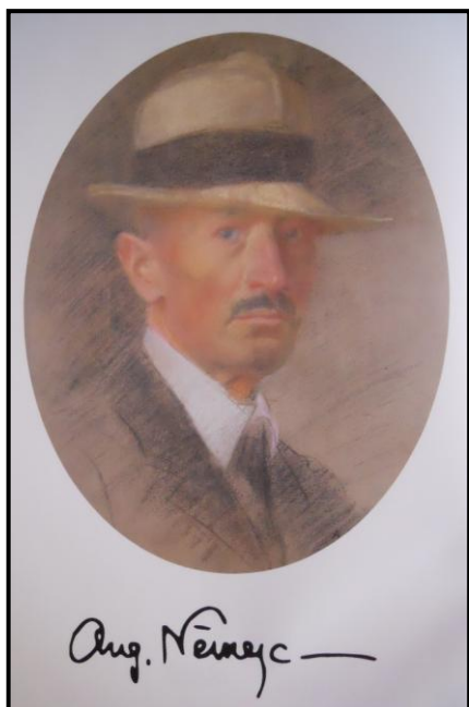
26. Augustin Němejc: Autoportrét, nedatováno, pastel, 61 x 49 cm.