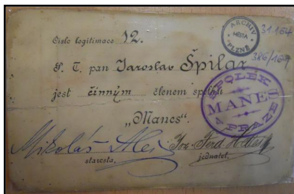
2. Členská legitimace spolku Mánes, nedatováno, Archiv města Plzně, sign. 31. 164