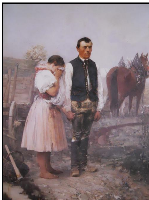
27. Augustin Němejc: Beznadějná láska, 1891, olej, plátno, 88 x 68 cm, ZČG v Plzni.