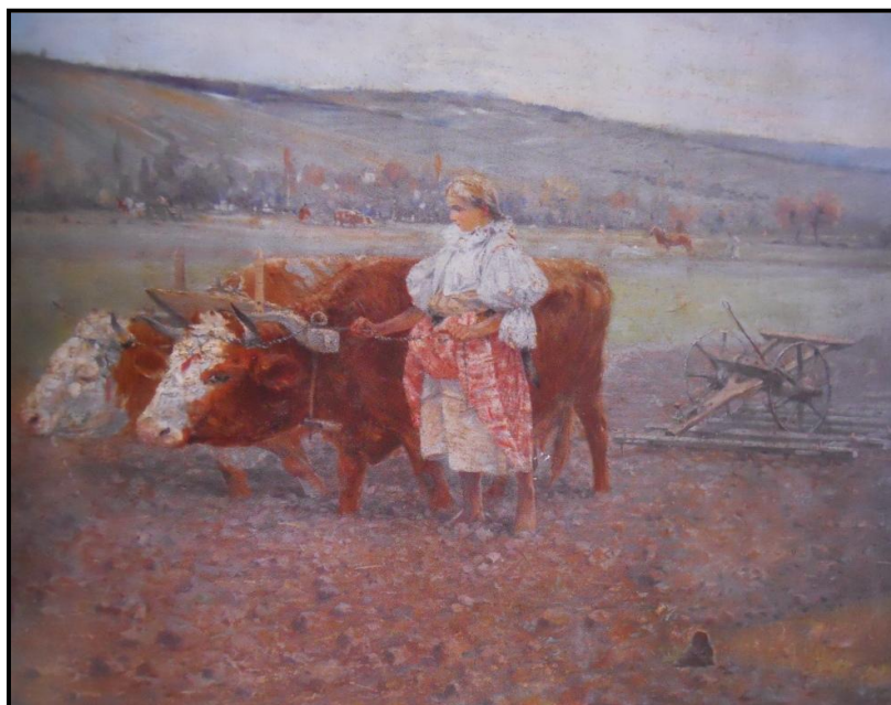
34. Joža Uprka: Z jara – Vlāčení – Orānī, 1895, olej, plātno, 81 x 102, 5, cm, NG v Praze.