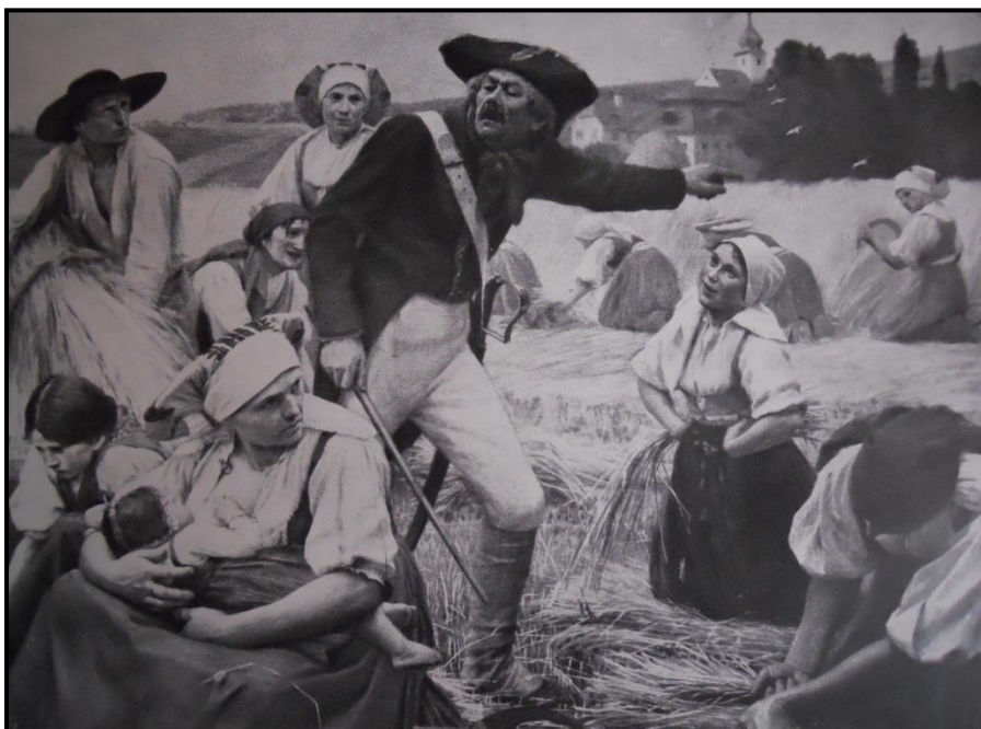
16. Jaroslav Špillar: Na robotě, 1899, olej, plátno, 120 x 178 cm, Galerie bratří Špillarů v Domažlicích.