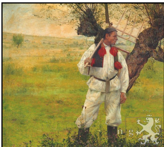
36. Karel Vítězslav Mašek: Sekáč, 1887, olej, plátno, 43 x 50 cm, NG v Praze.