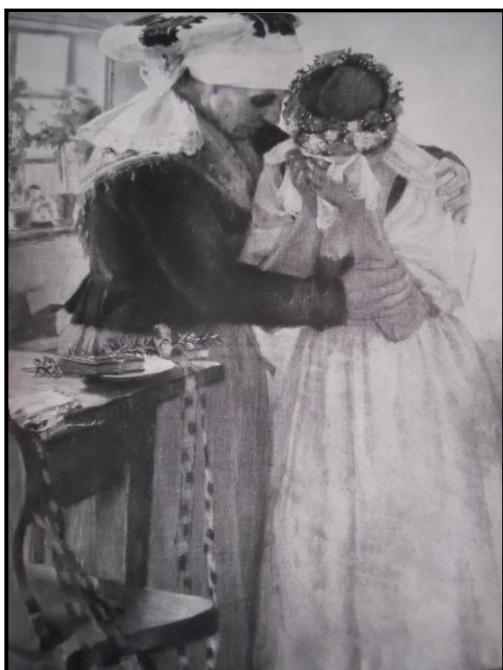
13. Jaroslav Špillar: Loučení s nevěstou, 1898, olej, plátno, 115 x 81 cm, ZČG v Plzni.