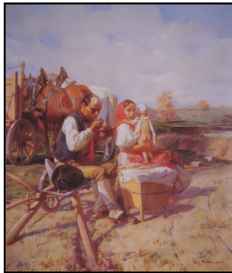
29. Augustin Němejc: Oběd na poli, 1911, olej, plátno, 85 x 75 cm, ZČG v Plzni.