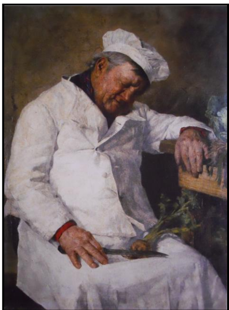
10. Jaroslav Špillar: Spící kuchtík, 1889, olej, plátno, 82 x 62 cm, Západočeská galerie v Plzni.