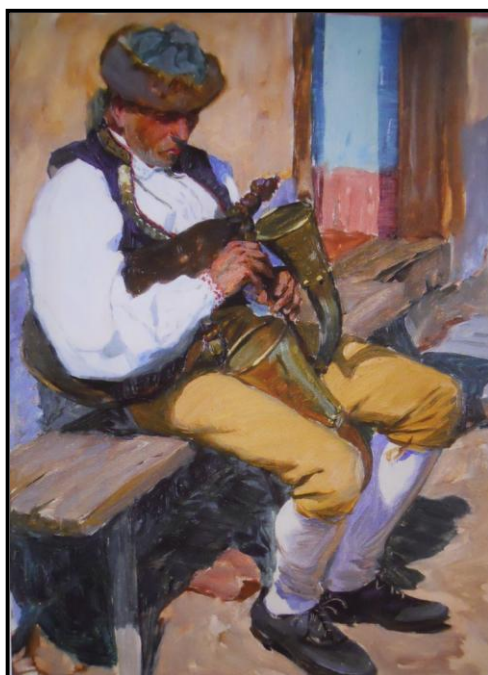
25. Václav Malý: Dudák na Domažlicku, 1908, olej, lepenka, 48, 5 x 36 cm, ZČG v Plzni.