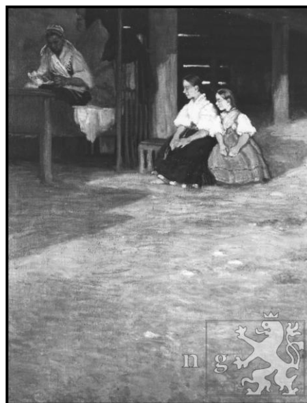
39. Miloš Jiránek: Detvanská jizba II., 1904, olej, plátno, 114 x 91 cm, NG v Praze.