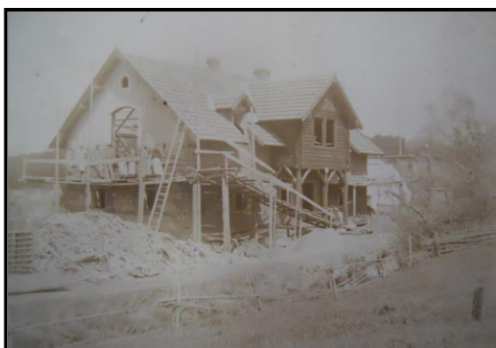
3. Pec pod Čerchovem, rozestavěný dům Jaroslava Špillara, nedatováno (asi 1902), Archiv města Plzně, sign. 31. 611.