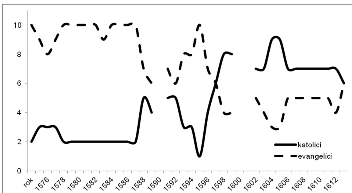
Graf č. 1: Zastoupení katolíků a evangelíků v městských radách v letech 1575-1614