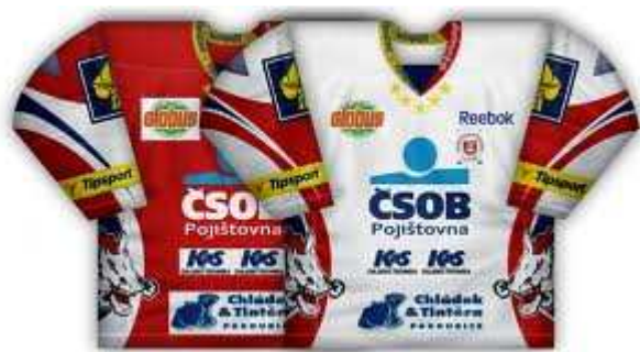
Obr. č. 2: Dresy klubu