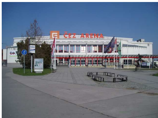
Obr. č. 4: Multifunkční aréna – venkovní pohled