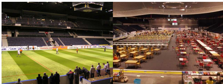
Obr. č. 6: Multifunkční aréna – jiné využití