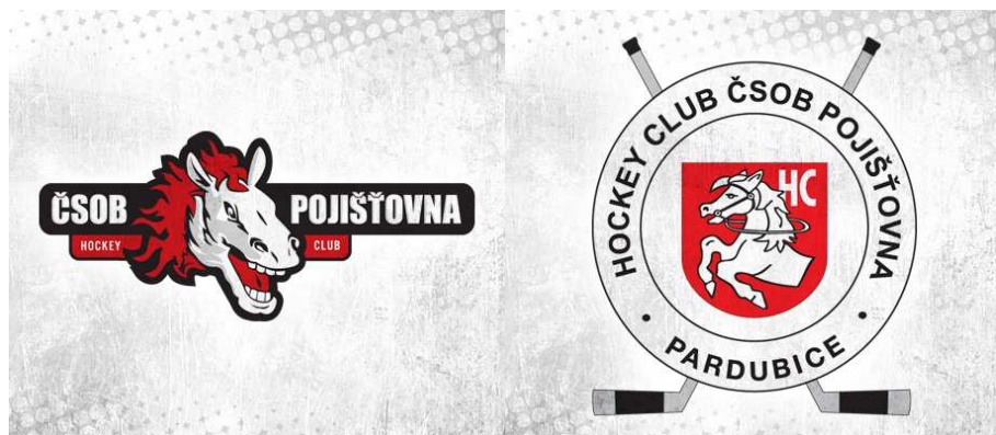
Obr. č. 1: Loga klubu