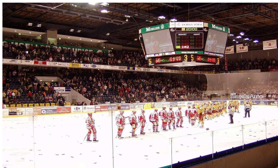
Obr. č. 3: Multifunkční aréna