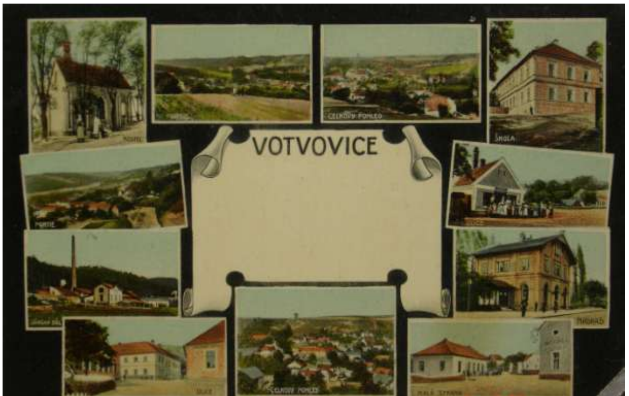
Obrázek 10 – Pohlednice obce před rokem 1915.