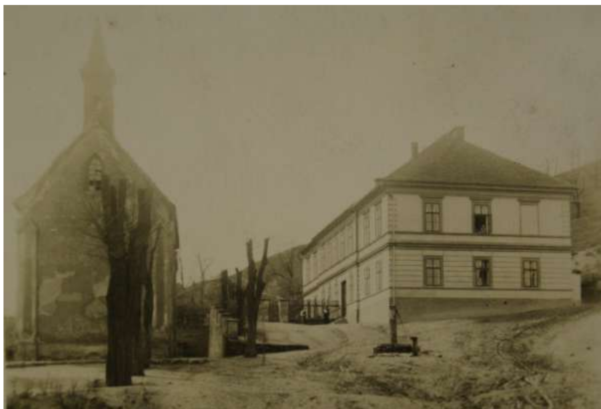
Obrázek 9 – Fotografie školy a kaple bez data vzniku.