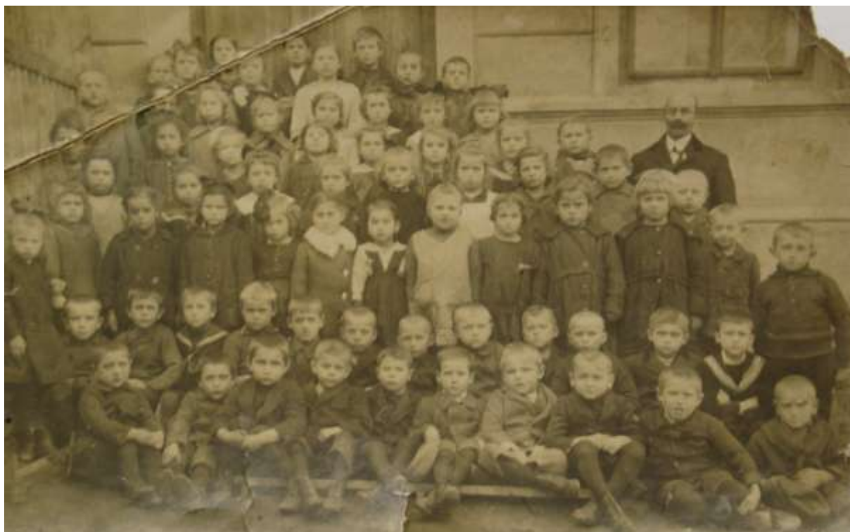
Obrázek 6 – Školní fotografie - kolem roku 1921