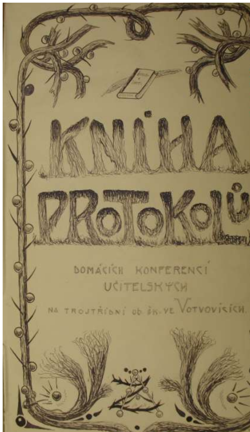
Obrázek 1 – Kniha protokolů učitelských porad (1906/1907 – 1916/1917)