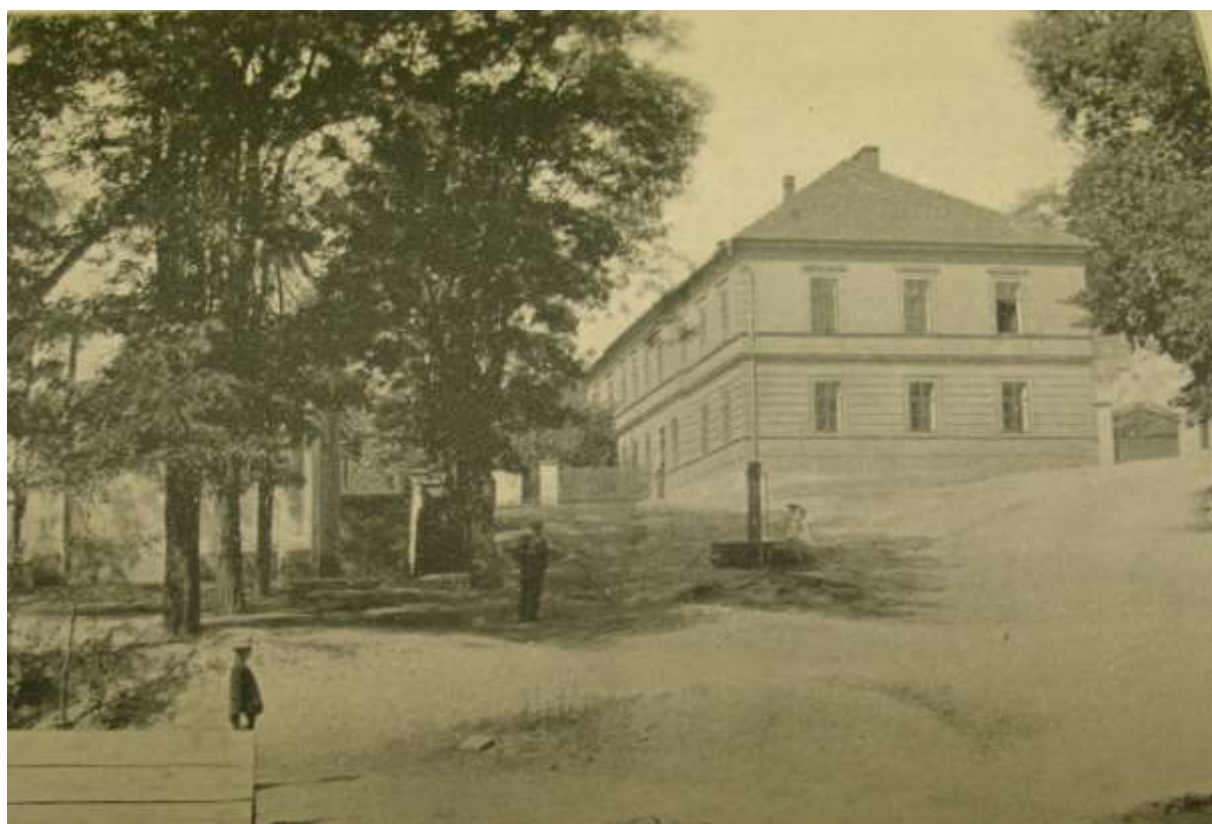
Obrázek 5 – Budova školy a kaple v Otovicích. Ilustrace ve sborníku Budeč a okolí vydaného v roce 1905.