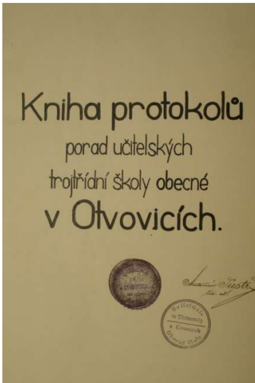
Obrázek 3 – Kniha protokolů učitelských porad (1929/1930-1940/1941)