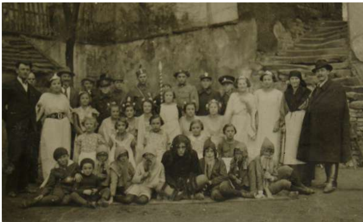
Obrázek 8 – Představení Revoluce v Hastrmanově pořádaný loutkářským odborem Tělocvičné jednoty Sokol s účastí školních dětí. V letech 1933-1934.