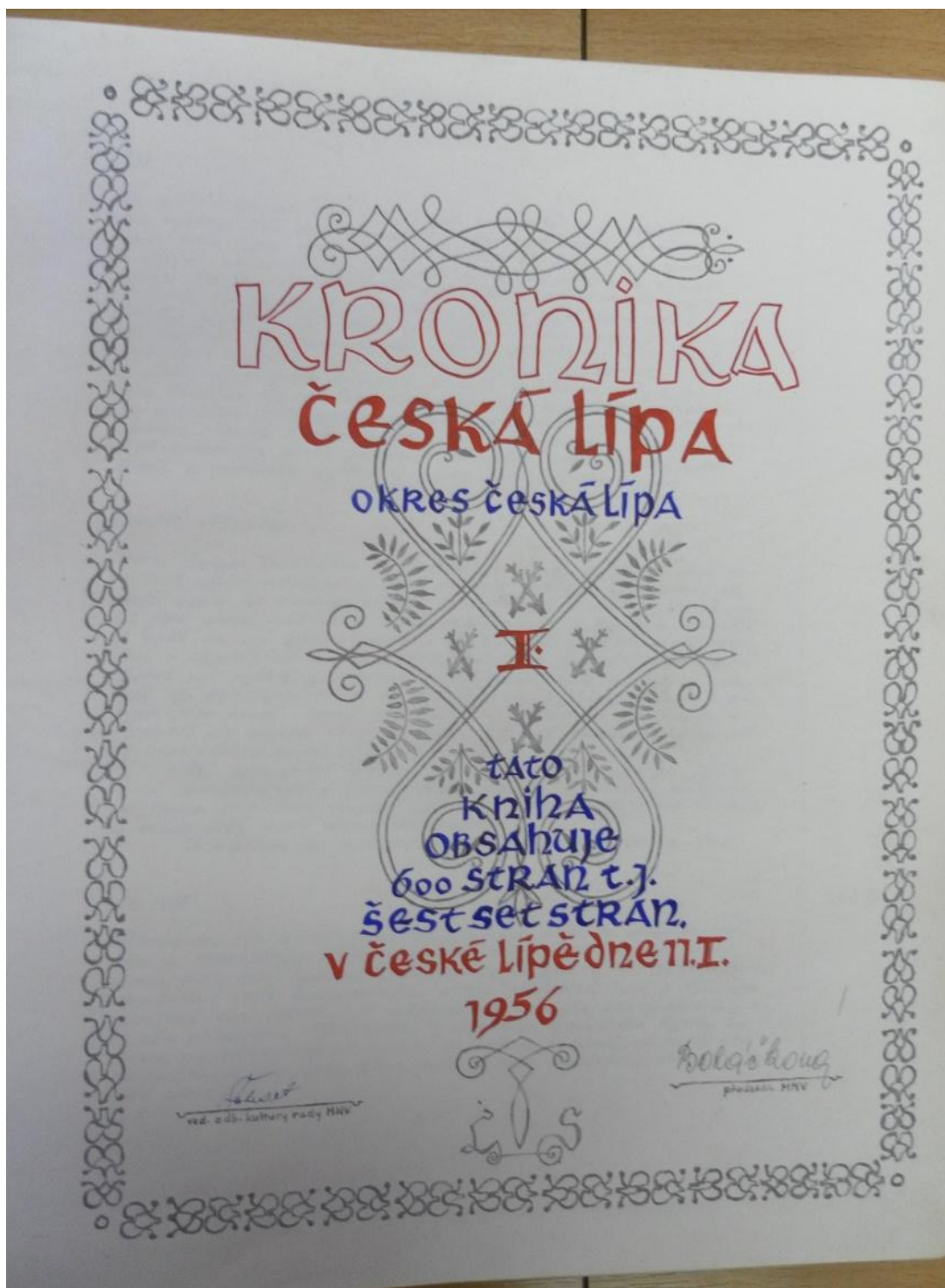
Zdroj 9: Kronika města Česká Lípa, úvodní list