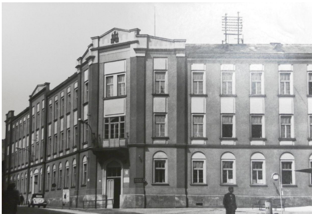
Obrázek 7: Školní budova na Komenského náměstí (1963)