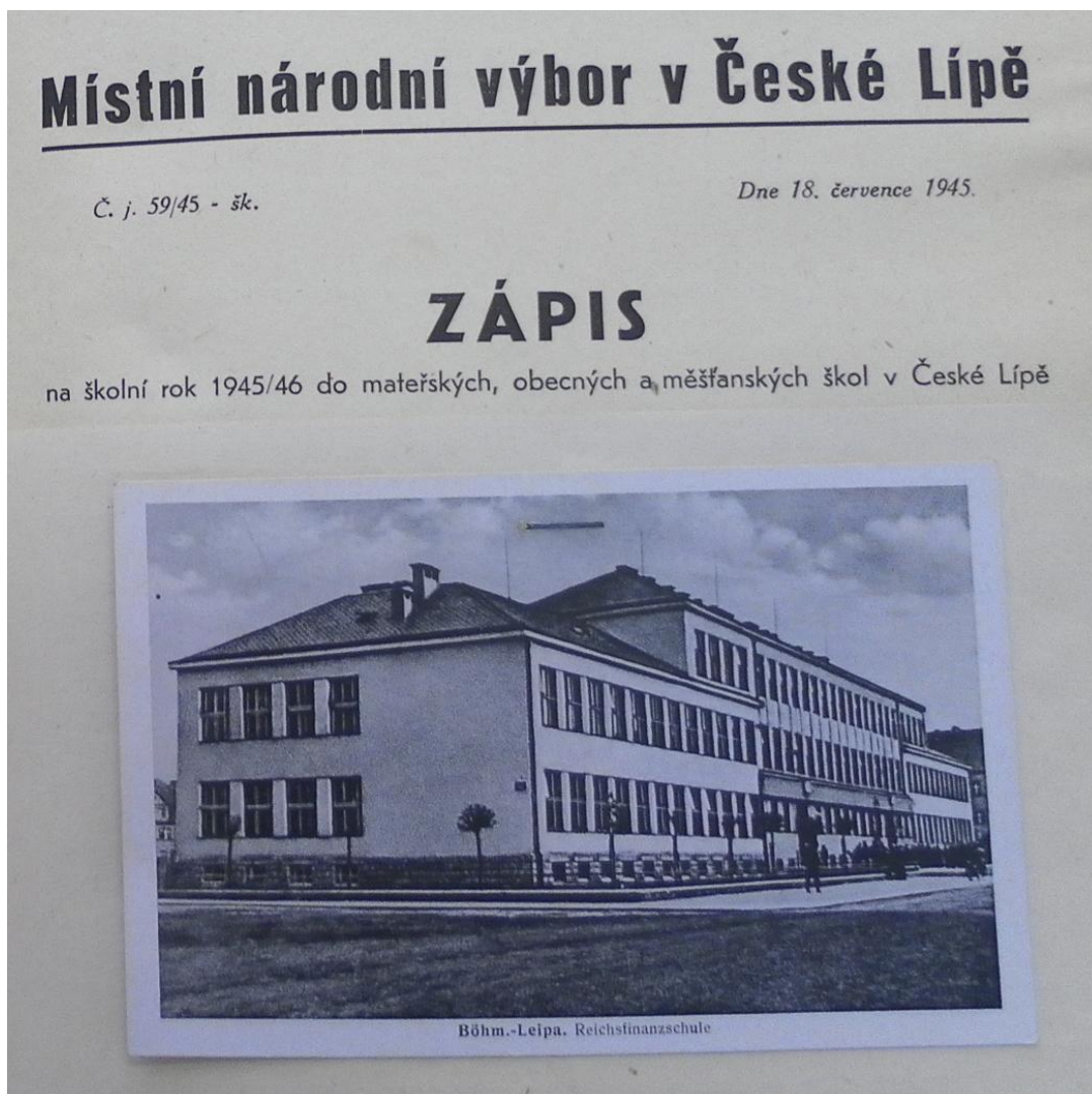
Zdroj 1: Školní kronika Tyršovy měšťanské školy dívčí, str. 15