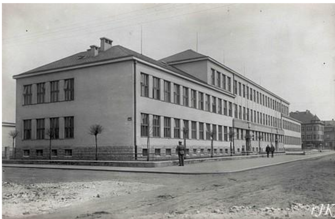
Obrázek 4: Budova Tyršových škol (v době dostavby)