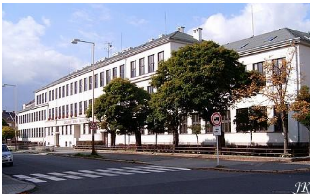
Obrázek 6: Budova Tyršových škol (dnešní podoba)