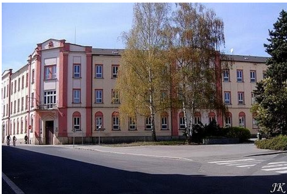
Obrázek 8: Školní budova na Komenského náměstí (dnešní podoba)