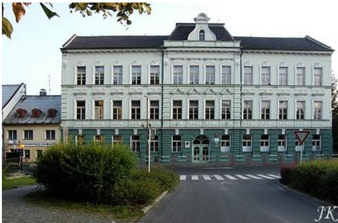
Obrázek 3: Školní budova v Křížové ulici (dnešní podoba)