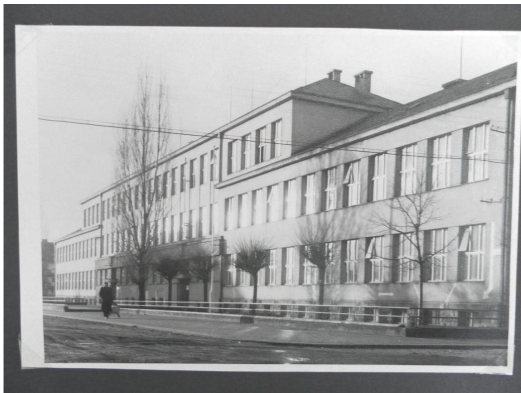
Obrázek 5: Budova Tyršových škol (40. léta)