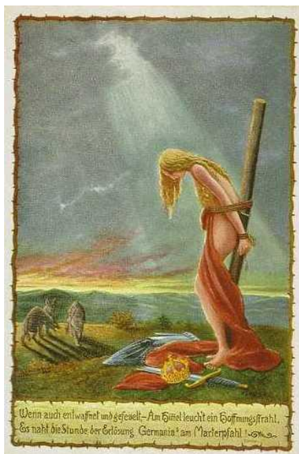
č. 4 Spoutaná Germania na mučednickém kůlu. Zdroj: Weimarer Republik: Germania am Marterpfahl. LeMO (Lebendiges virtuelles Museum online) [online]. [cit. 2012-06-20]. Dostupné z: http://www.dhm.de/lemo/objekte/pict/96003584_1/index.html .