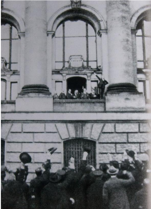
č. 1 Philipp Scheidemann provolal z balkonu Říšského sněmu dne 9. 11. 1918 republiku.