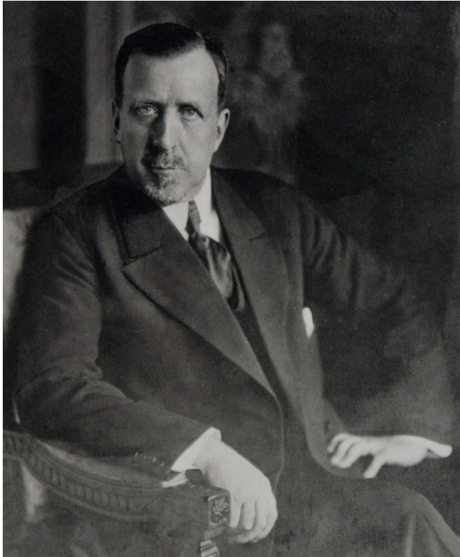
č. 31 Heinrich Mann. 1927. Zdroj: METZGER Rainer a BRANDSTÄTTER Christian. Berlin Die Zwanzigjähre: Kunst und Kultur 1918 - 1933 . Christian Brandstätter Verlag. Wien 2006. S. 307.