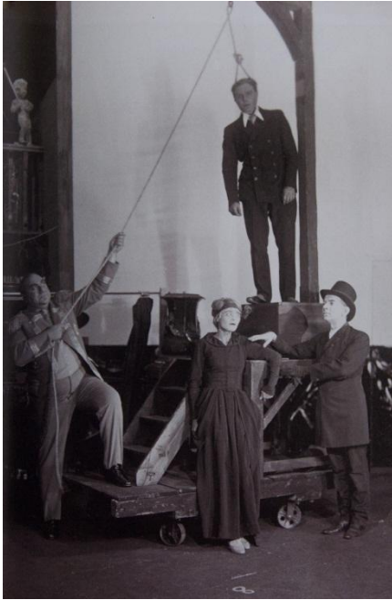
č. 29 výjev ze hry Žebrácká opera od Bertolta Brechta. Rok 1928.