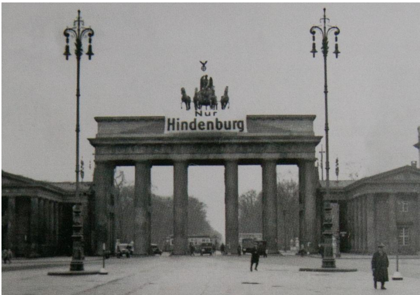
č. 2 Volební plakáty pro Paula von Hindenburga. Berlín 1932, 1930 a 1925.