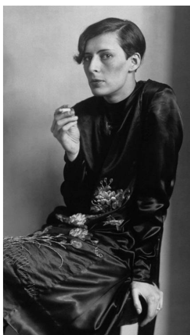
č. 20 Sekretářka Westdeutsche Rundfunk v Kolíně. Rok 1926.