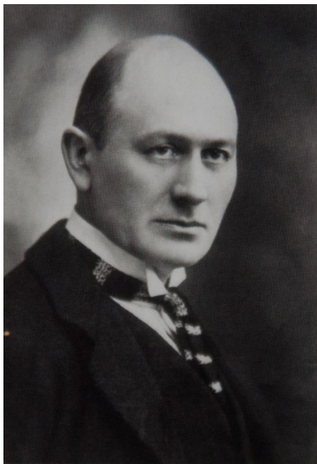
č. 32 Leopold Jessner. Kolem roku 1920.