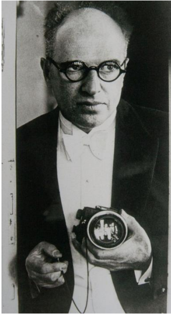
č. 21 Fotograf Erich Solomon. 1928.