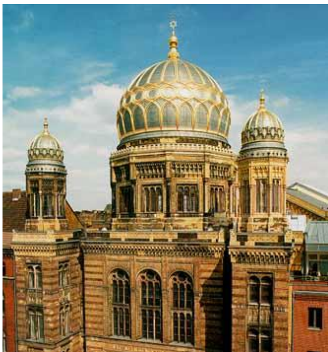
č. 6 Nová synagoga v dnešní podobě.