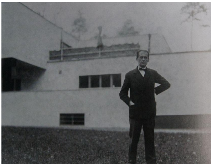
č. 27 zakladatel školy Bauhaus W. Gropius před jedním ze svých navržených domů. 1929. Zdroj: METZGER Rainer a BRANDSTÄTTER Christian. Berlin Die Zwanzigjähre: Kunst und Kultur 1918 - 1933 . Christian Brandstätter Verlag, Wien 2006. S. 136.