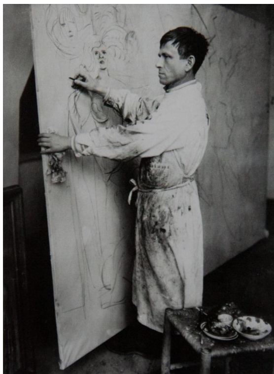
č. 34 Otto Dix ve svém ateliéru v Berlíně v roce 1927.