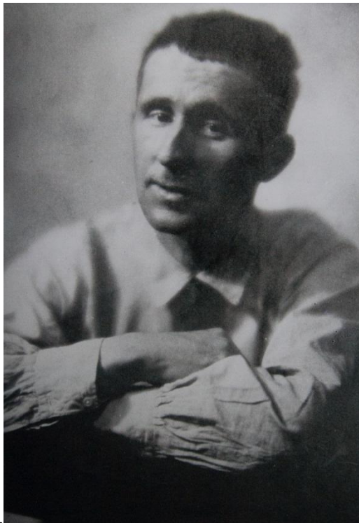
č. 24 Bertolt Brecht 1927.