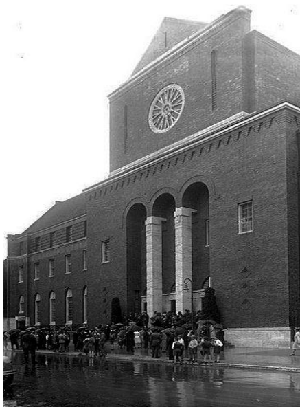
č. 5 Synagoga Prinzregentenstraße. Zdroj: ECKHARDT, Ulrich a Andreas NACHAMA. Jüdische Orte in Berlin. : Nicolaische VerlagsbuchhandlungGmbH, Berlin2005. S. 105.