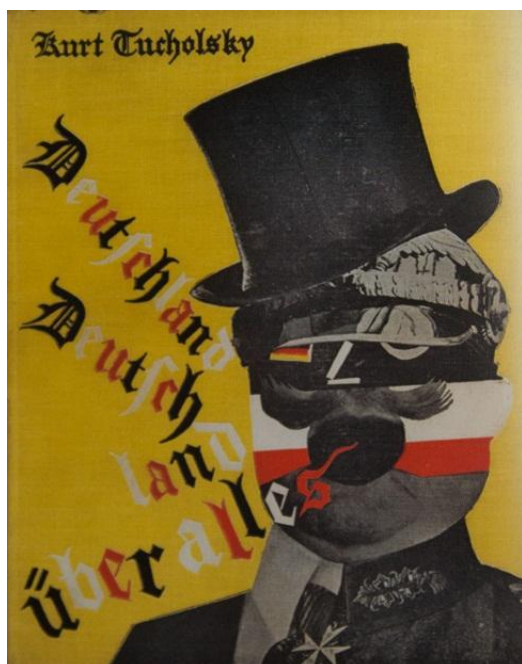
č. 33 Kurt Tucholsky Deutschland, Deutschland über alles. Koláže fotografií od Johna Heartfielda. 1929.