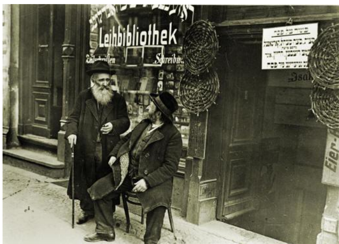
č. 7 Scheunenviertel.