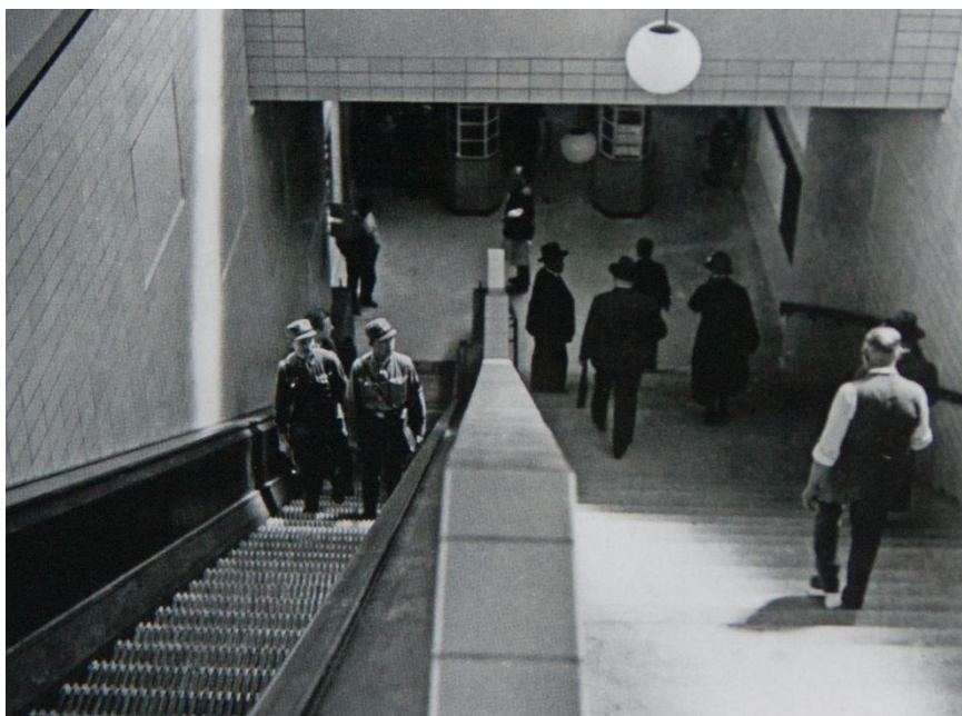
č. 9 Jezdící schody mezi stanicemi metra na Innsbrucker Platz. Berlín 1930.