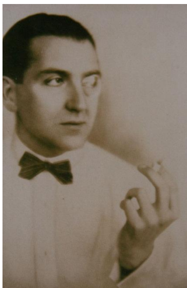
č. 17 Fritz Lang. Rok 1925.