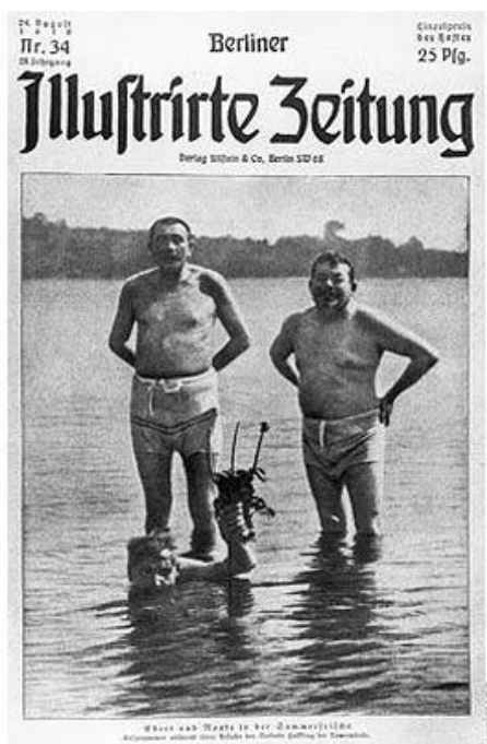
č. 19 Obálka novin Illustrierte Zeitung, na které je Noske a Ebert v plavkách. 24. 8.1919. Zdroj: 1919–1925 An der Spitze der Republik. Stiftung Reichspräsident-Friedrich-Ebert-Gedenkstätte [online]. [cit. 2012-06-20]. Dostupné z: http://www.ebert-gedenkstaette.de/ebert_leben1919.html .