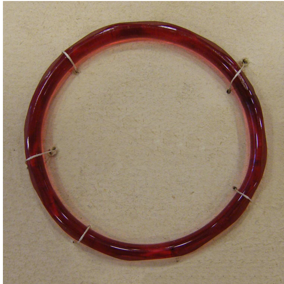
OBRAZOVÁ PŘÍLOHA 1: Ukázka skleněného kroužku, pro který se také používal název bangle nebo skleněný náramek.