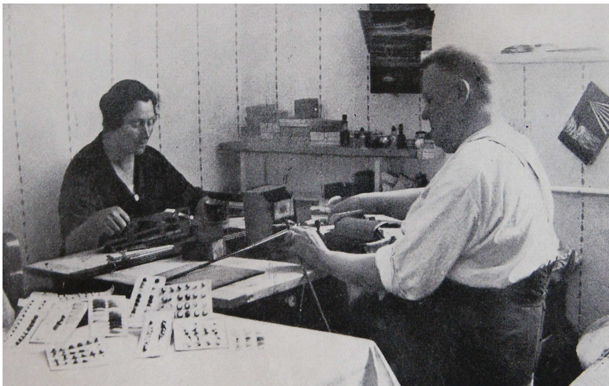
OBRAZOVÁ PŘÍLOHA 3: Domácké mačkání a navíjení skla u stolu nad plynovou lampou, Jablonecko.