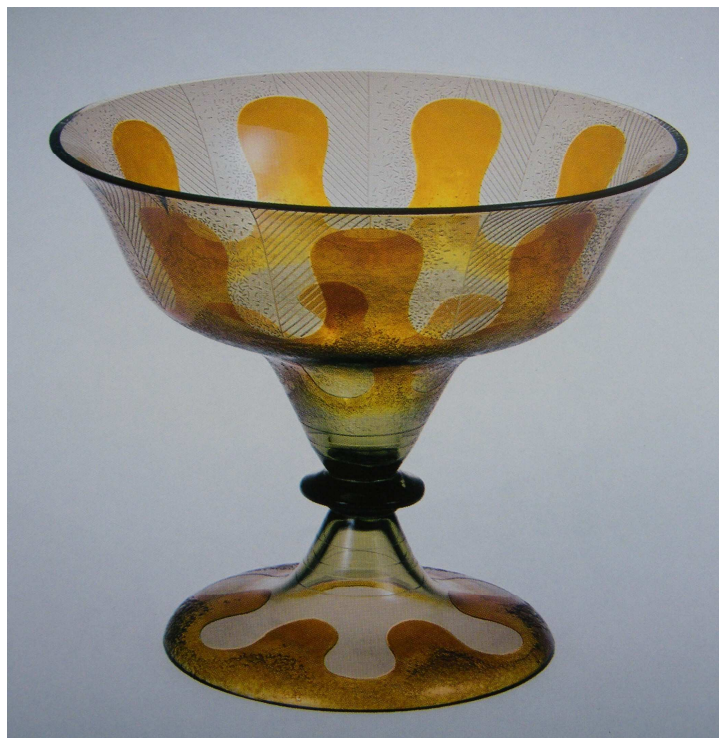
OBRAZOVÁ PŘÍLOHA 5: Mísa z čirého, žlutě lazurovaného a leptaného skla, provedl Zdeněk Juna (dekor) a Alois Matelák (tvar), 1930.