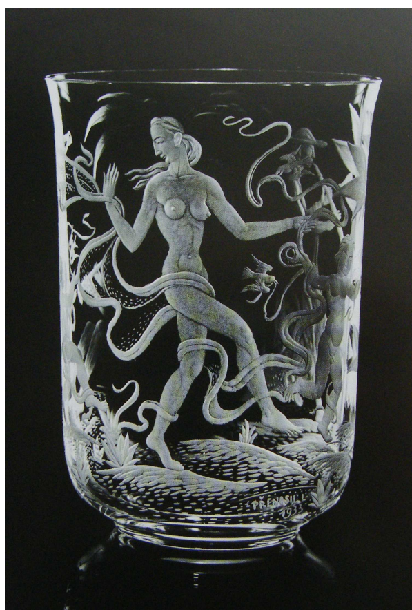
OBRAZOVÁ PŘÍLOHA 8: Rytina na skle s názvem Tanečnice, provedl Ladislav Přenosil, 1933.