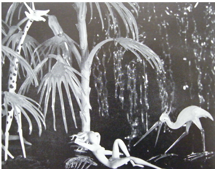
OBRAZOVÁ PŘÍLOHA 7: Kompozice modelovaných a foukaných skleněných figurek s názvem Skleněný Ráj (zde detail), provedl Jaroslav Brychta, 1936.