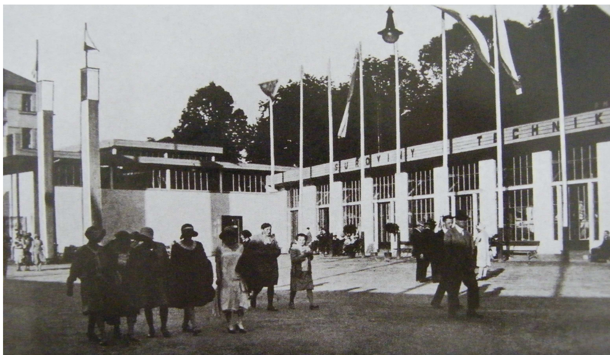
OBRAZOVÁ PŘÍLOHA 9: Pohled do vstupního prostoru výstaviště, kde návštěvníci procházeli před pavilony surovin a techniky, Jubilejní výstavy československého skla a bižuterie a Pojizerská krajinská výstava v Železném Brodě, 1930.