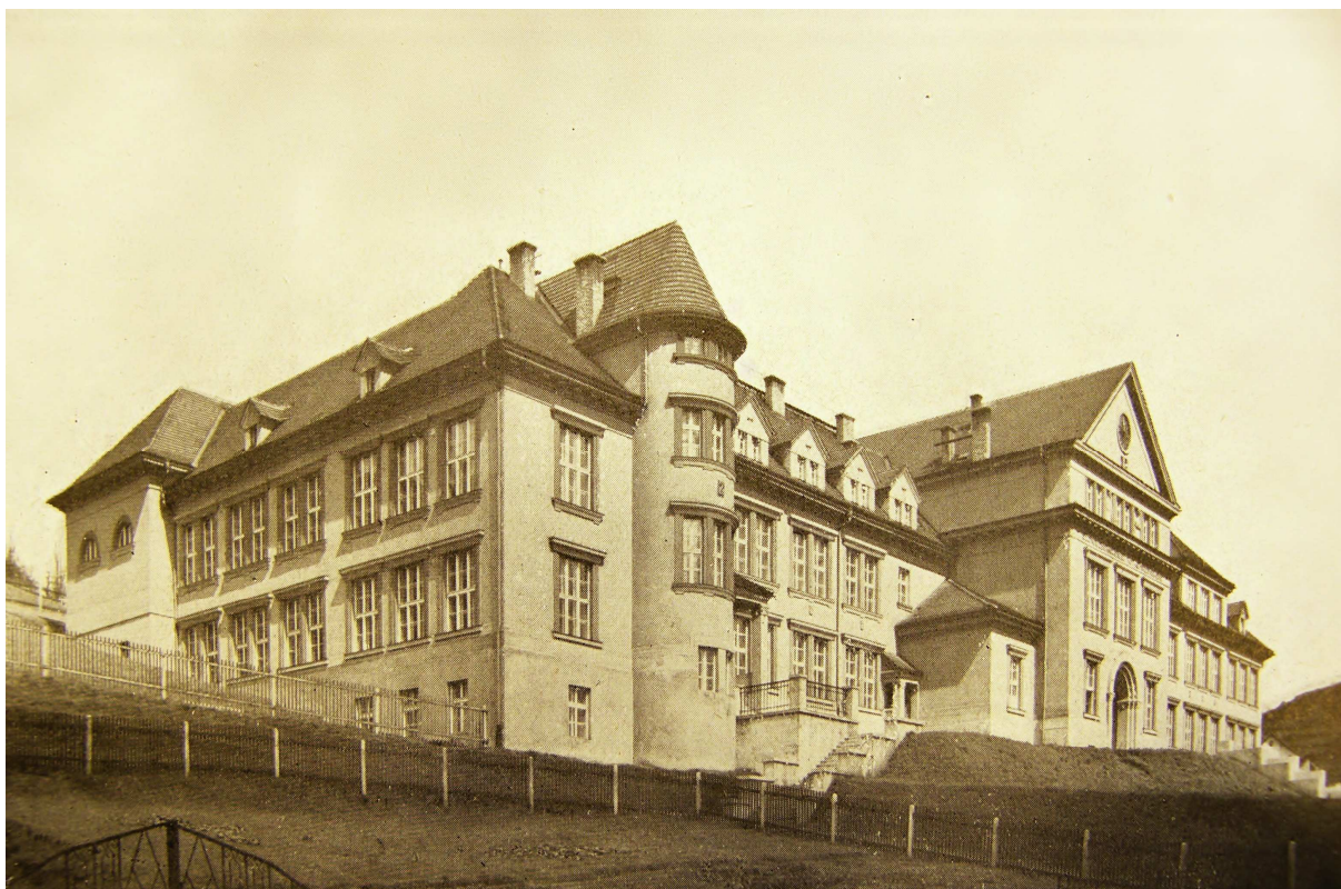
OBRAZOVÁ PŘÍLOHA 4: Budova Státní odborné sklářsko-obchodní školy v Železném Brodě.