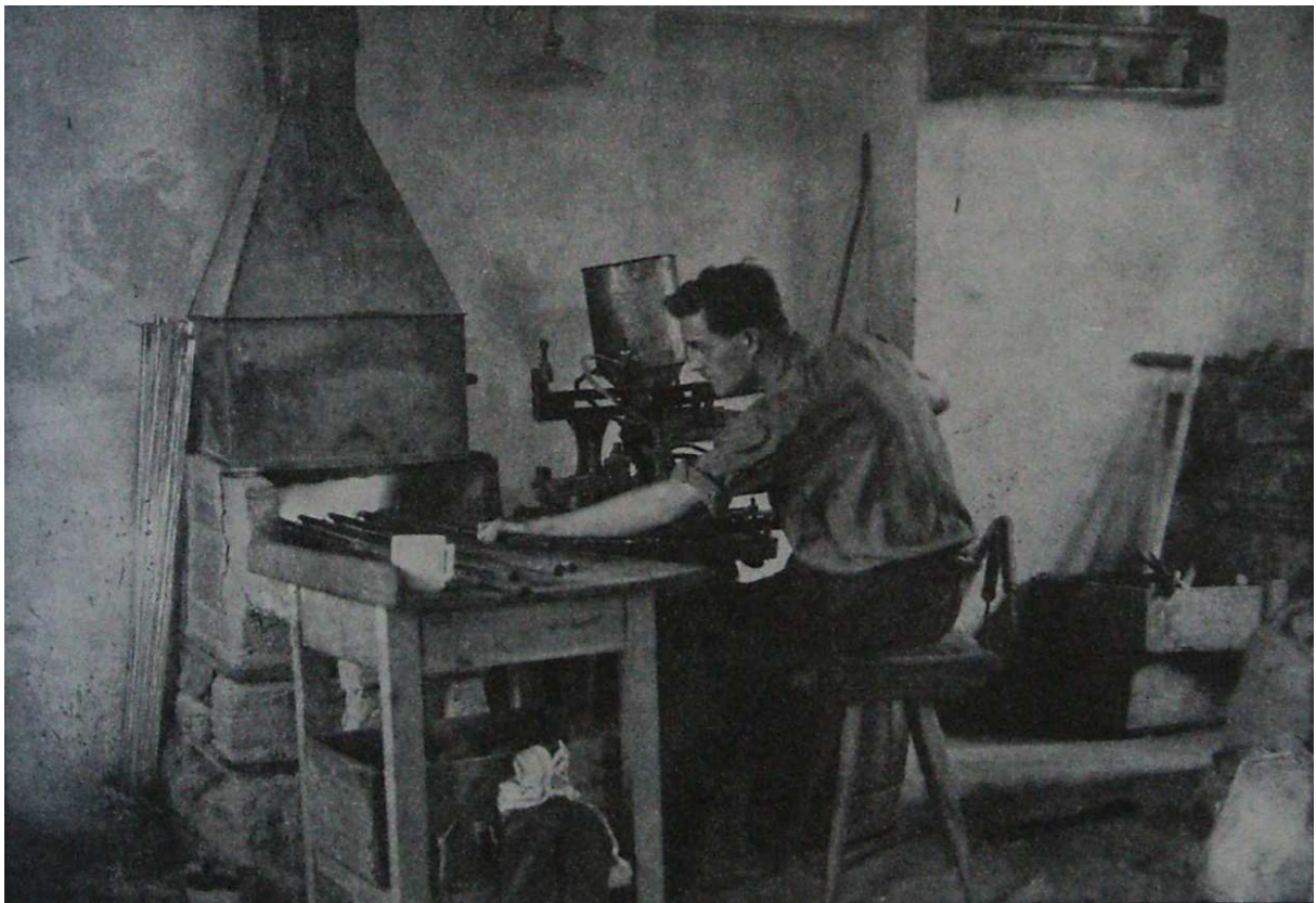
OBRAZOVÁ PŘÍLOHA 2: Domácké mačkání skla u pece, Jablonecko.