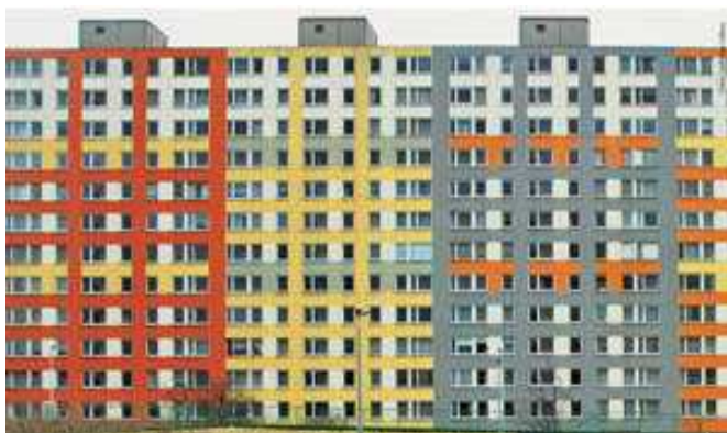
Zateplení panelového domu na pražském sídlišti Bohnice Ladislava Lábuse

„Rozhodl se neměnit tvar paneláku, nechat mu krabicovitou formu a pouze ho chytře natřít. Pokusil se jej změnit ornamentálním obrazcem, který respektuje geometrii panelového domu. To působí podstatně lépe.“ (Švácha in Panelová sídliště... 2006 )