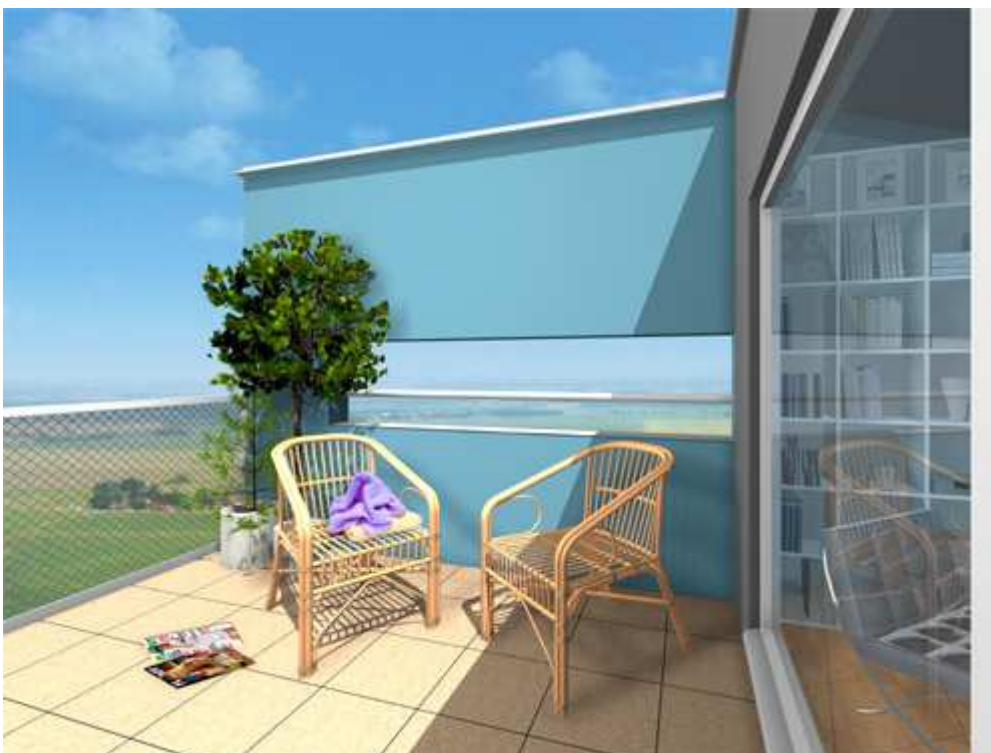
Nástavba na panelový dům terasa - Praha Hostivař - arch. Drexler - 2003