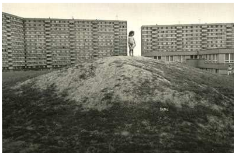
Viktor Kolář, 1980

V nultých letech 21. století nastává zajímavý jev - se sídlištní tematikou přichází nastupující autorská generace, umělci narození v 70. a 80. letech, pro které jsou sídliště již samozřejmou (což však neznamená bezpodmínečně přijímanou) součástí obrazu měst. Část z nich navíc spojuje fakt, že na sídlišti sami vyrůstali. Panelákové téma v tvorbě jedněch sice následuje tradiční linii odrazu anonymity, osamělosti, bezútěšnosti a deprese, nicméně tvůrčí zájem jiných bývá často veden snahou zrelativizovat zavedené mýty a ukázat sídliště a jejich sociální život bez předsudků či v neutřelých souvislostech. Je až překvapivé, jak pestré tvorbě sídliště, symbol uniformity, inspirují. Následující část této kapitoly představuje nejvýraznější díla a projekty, s nimiž se v průběhu uplynulého desetiletí české publikum mělo možnost seznámit - ač někteří jejich autoři nejsou české národnosti, zasáhli tak do našeho kulturního prostoru. Pro zařazení slovenských autorů hovoří i historická a kulturní spřízněnost našich zemí, mimo to většina z nich – stejně jako Němec Thomas Freyer - na českých vysokých školách svůj umělecký obor vy/studovala.