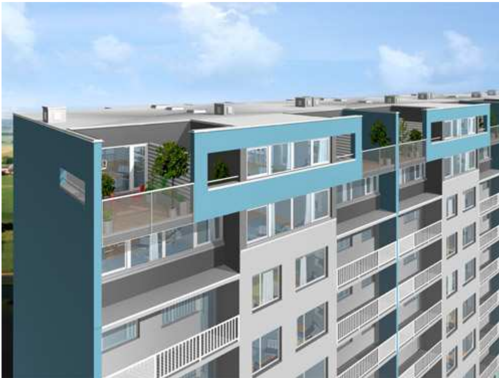
Nástavba na panelový dům - Praha Hostivař - arch. Drexler - 2003