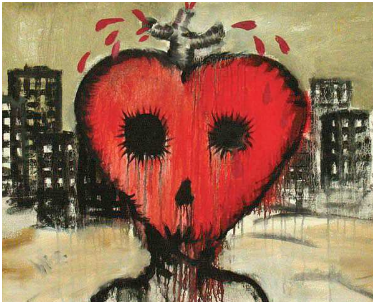
Josef Bolf – Srdce, 2006

Město, které se v roce 1976 vymykalo běžným městským měřítkům, nemělo žádnou strukturu, ulici, byly tam nahodile rozházené domy a mezi nimi obrovské proluky. "Tahle architektura mě svou zvráceností přitahuje," přiznává malíř. "Vždycky jde vlastně proti jejím obyvatelům, utlačuje je a ovlivňuje. Nepůsobí tak, že je stavěná pro lidi, ale spíše proti nim. Velkorysost venkovních prostor a proti nim stísněnost bytů jsou v totálním protikladu." (Volf, 2010)