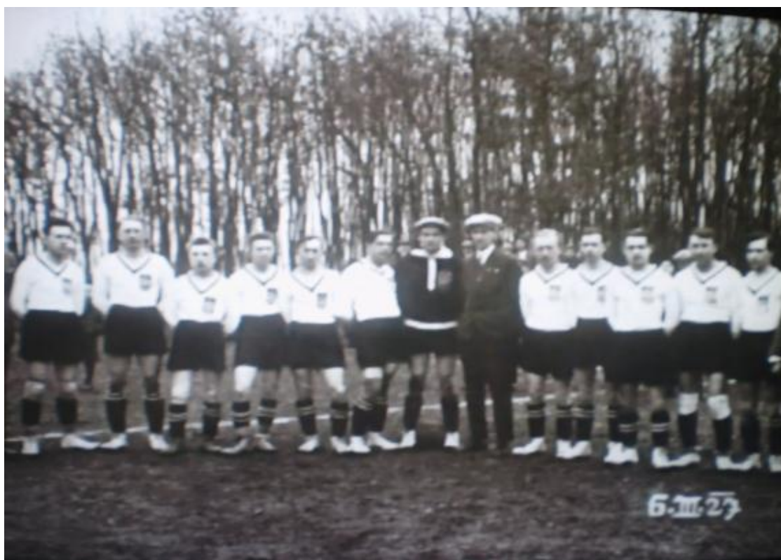
Mužstvo z roku 1927