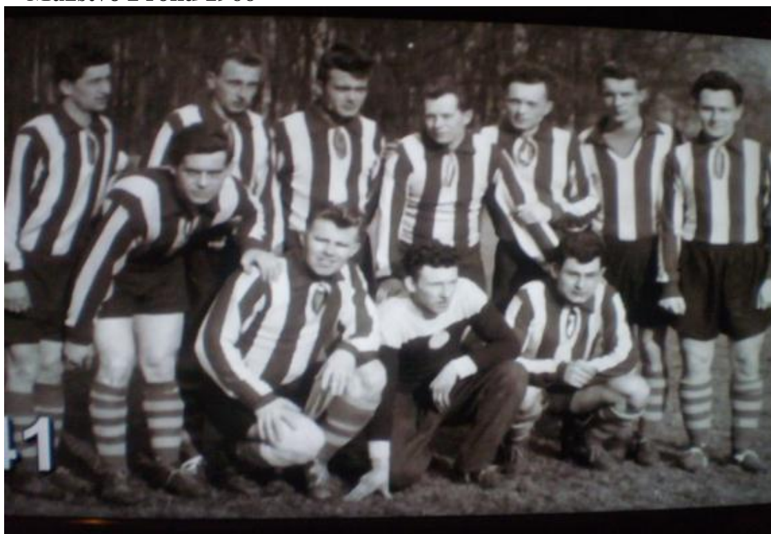
Mužstvo z roku 1967