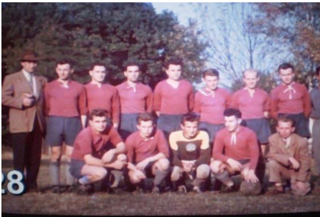
Mužstvo z roku 1953