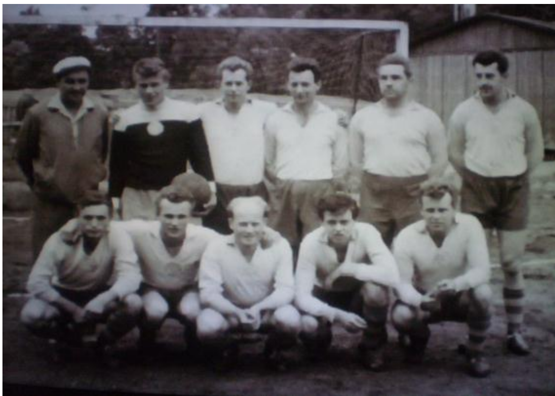
Mužstvo z roku 1948