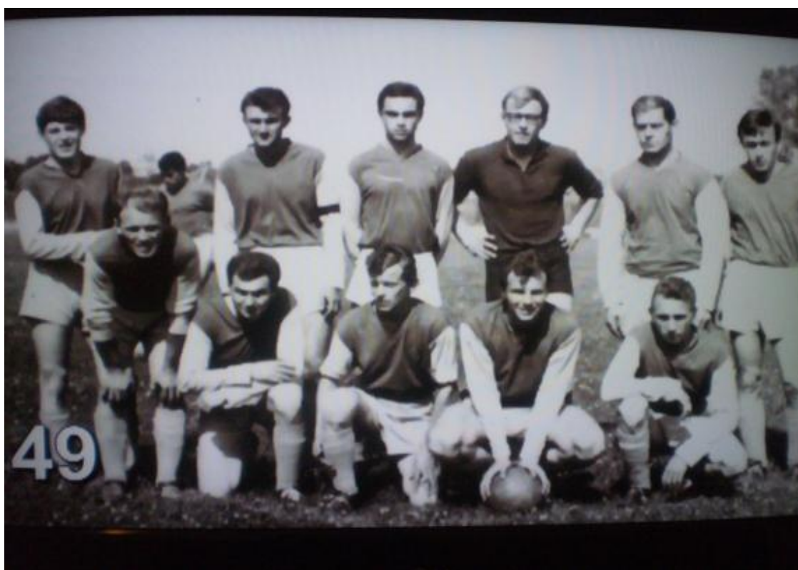
Mužstvo z roku 1966