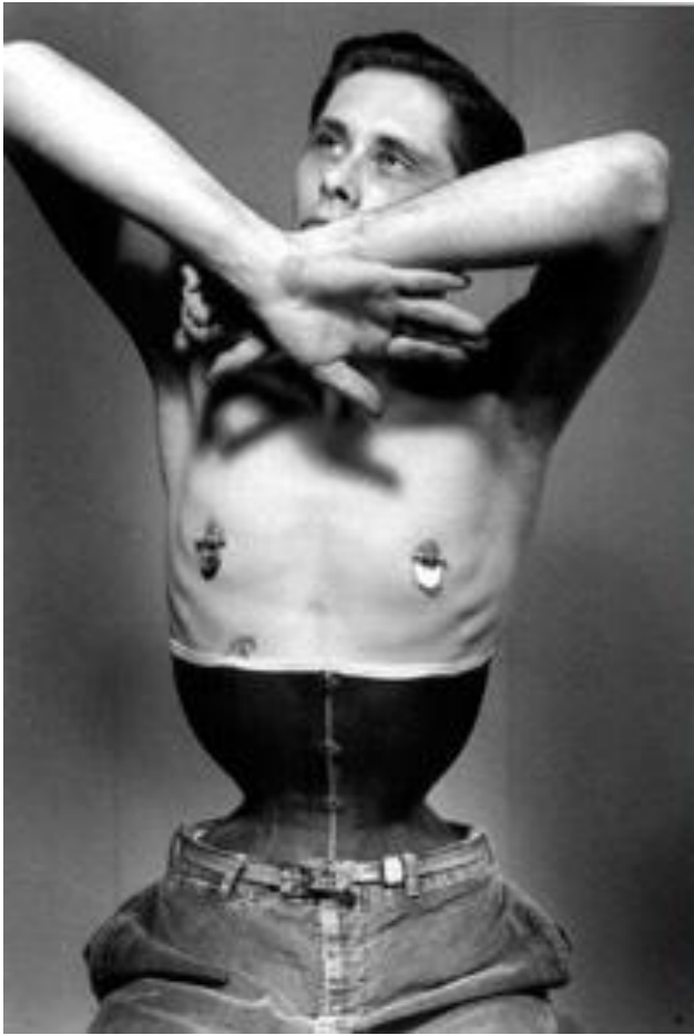
Fotografie I.: Fakir Musafar