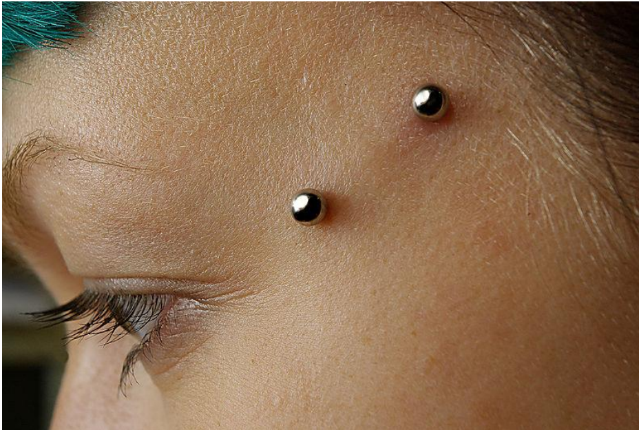
Fotografie D.: Mikrodermální piercing