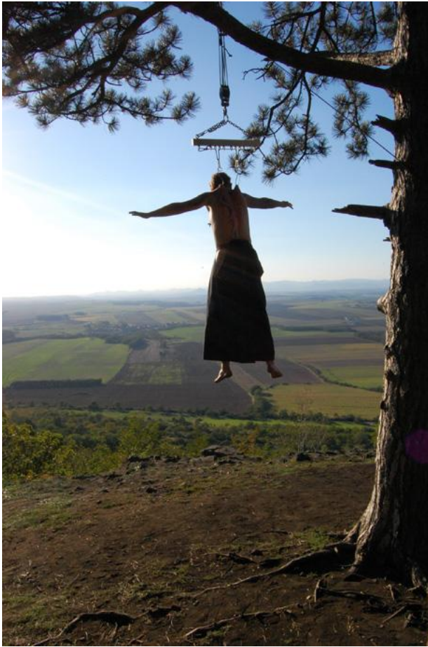
Fotografie F.: Suspension, nebo-li věšení na háky