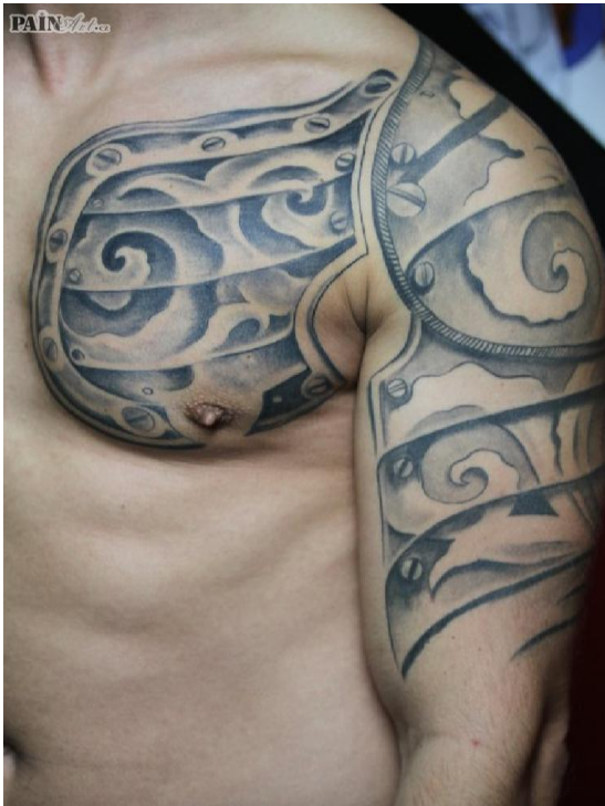
Fotografie A.: tetování

Příloha k bakalářské práci obsahuje názorné ukázky pojmů uvedených v práci. Jedná se o fotografie, především druhů tělesných modifikací a slouží pouze pro ilustraci.