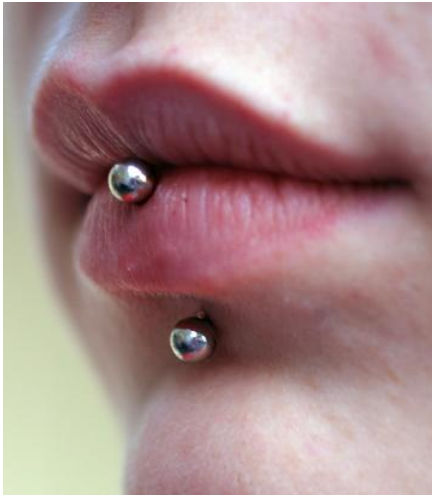
Fotografie B.: piercing