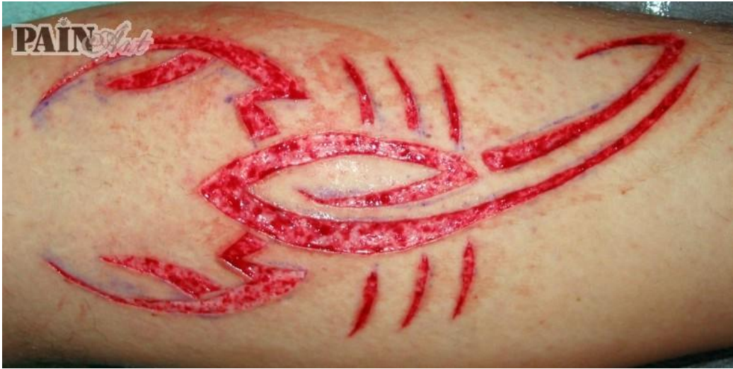
Fotografie C.: skarifikace, druh BM