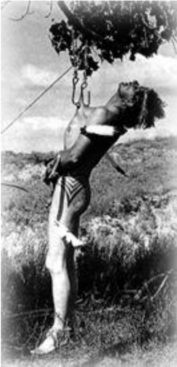
Ibitoa, Nová Quinea