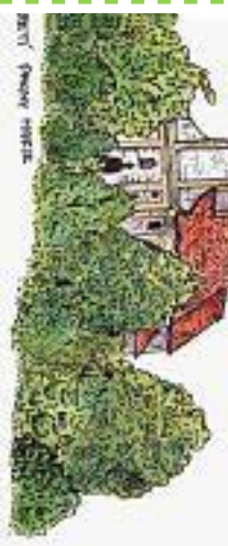
Stará věžová zvonice (1798)