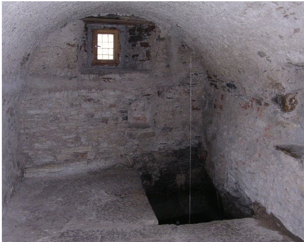
Mikve u dobrušské synagogy.