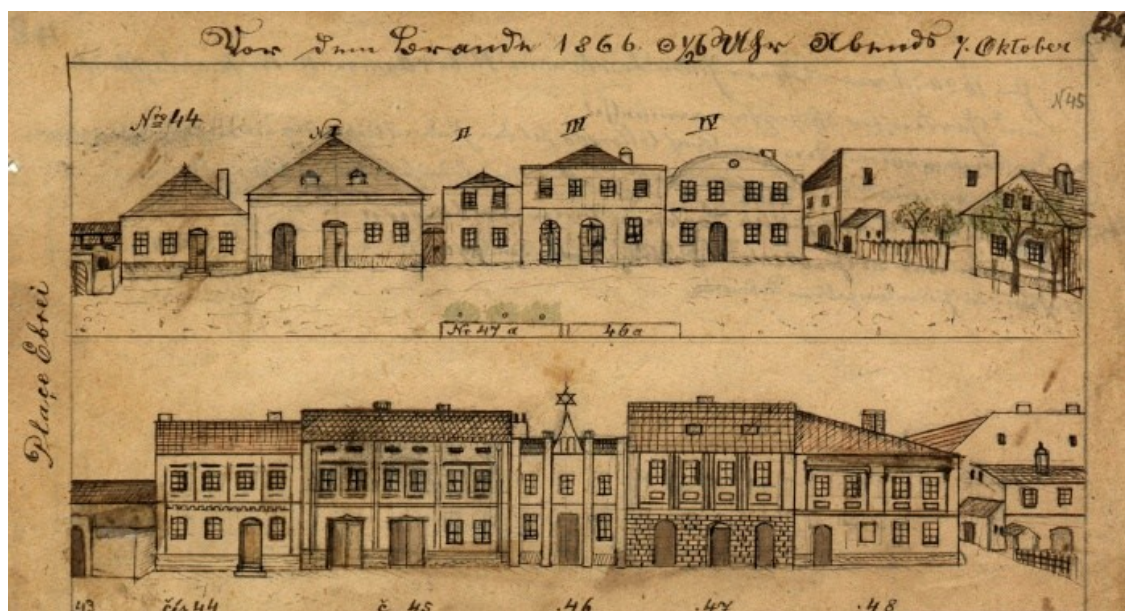
Židovská ulice v Dobrušce v roce 1866.