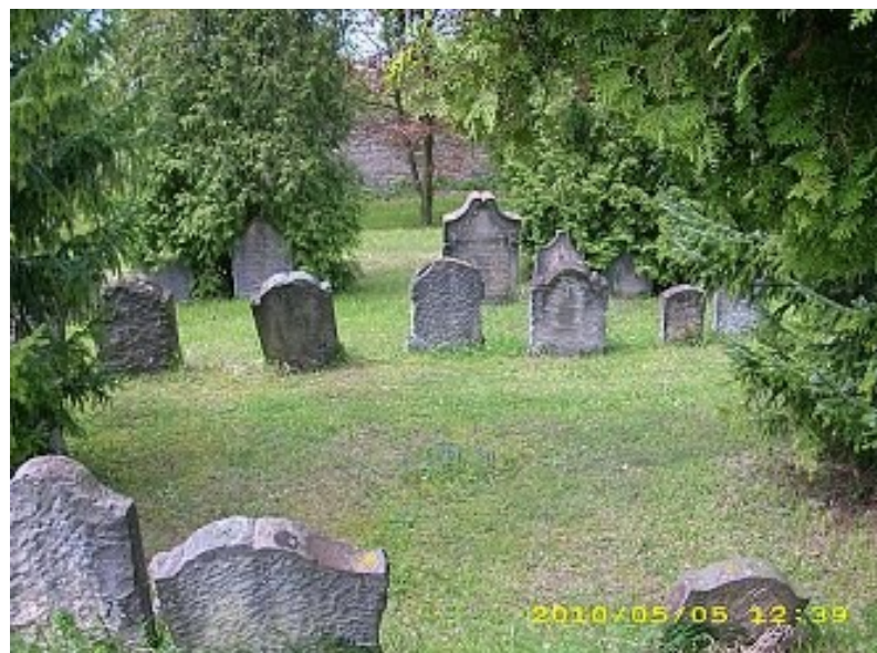
Židovský hřbitov v Dobrušce.