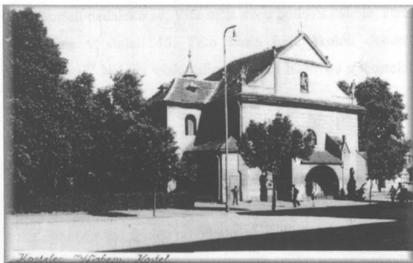
Obr.4 Kostel sv. Víta

Na náměstí stála i radnice, tato původně renesanční budova bohužel roku 1551 vyhořela. Na radnici zasedala městská rada. Tato rada měla v 15. století 6 členů, později s růstem města vzrostl i počet radních na 12. Jak bylo zvykem, radní se postupně střídali v úřadu purkmistra, po oslabení postavení rychtáře jako reprezentanta soudní moci se smývá i rozdíl mezi zasedáním městské rady a soudu. 47 Kostelecká městská rada měla i právo vynášet rozsudky spadající do kategorie hrdelního práva. Ve městě byla i šatlava při Písecké bráně a na náměstí stál pranýř. 48