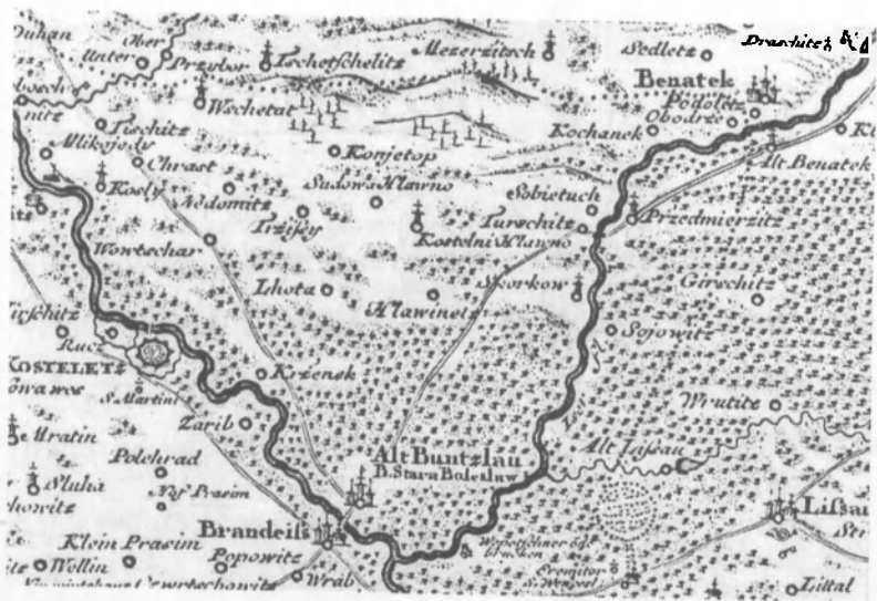
Obr.6 Kostelec nad Labem v Mullerově mapě z roku 1720