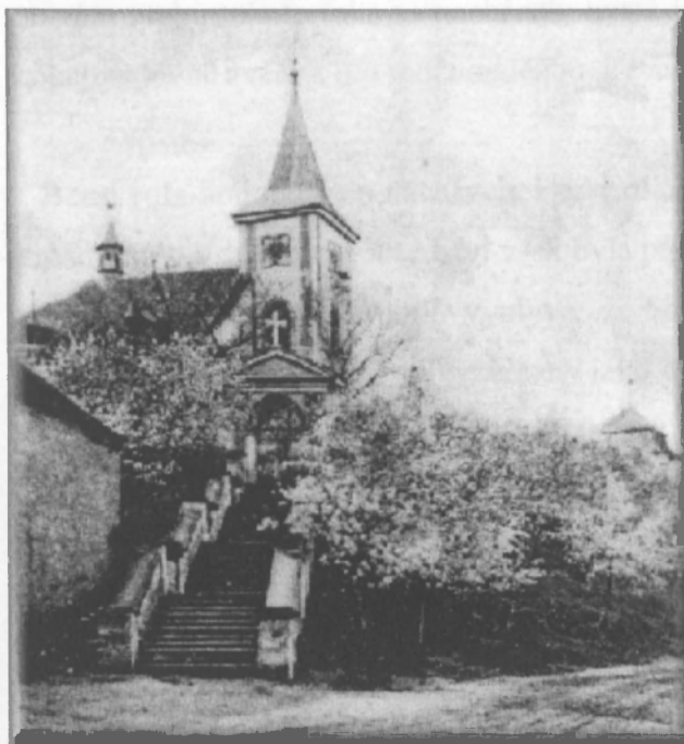
Obr.2 Kostel sv. Martina

Jak již bylo výše uvedeno, původní osada se začala formovat kolem kostela sv. Martina, který leží na vyvýšenině.