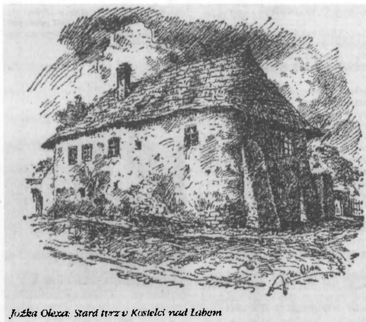
Jozka Olexa: Stará tvrz v Kustelci nedl Labem