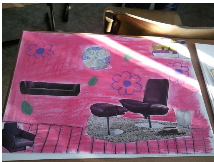
Obr. č. 18 – Růžová pracovna