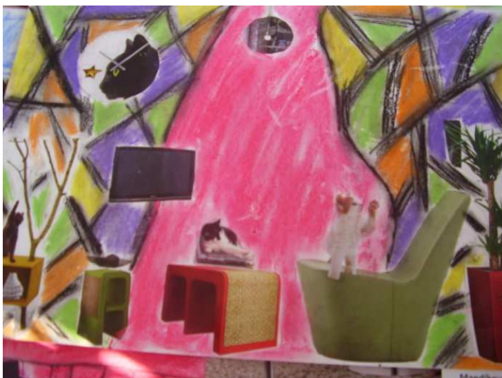
Obr. č. 19 – Moderní obývací pokoj