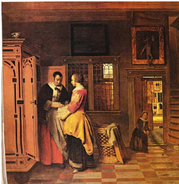
Obr. č. 31 – Prádelník

Název obrazu napovídá, jaký kus nábytku zde bude zobrazen. I když děj i postavy a samotný prádelník z obrazu přímo vyzařují, mé oko je autorem „taženo“ mnohem dál a to ven. Ráda bych si prohlédla ten svět tam venku. Ne, na prádelník se opravdu nedokážu soustředit.