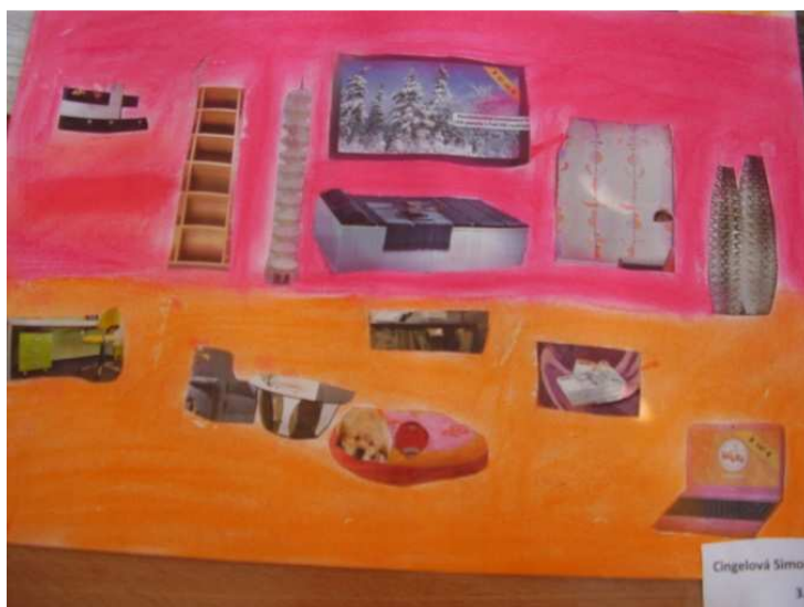
Obr. č. 20 – Jednopokojový byt