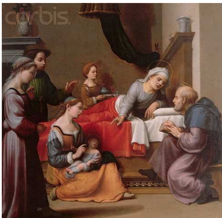
Obr. č. 7 - The Nativity of Saint John the Baptist by Giuliano Bugiardini

Obrazy, na kterých je vyobrazena postel s baldachýnem - velmi často se objevují osoby svaté, bohové a bohyně i majetní pánové a dámy. Je zřejmé, že postel po mnoho staletí sloužila pouze vybraným lidem.