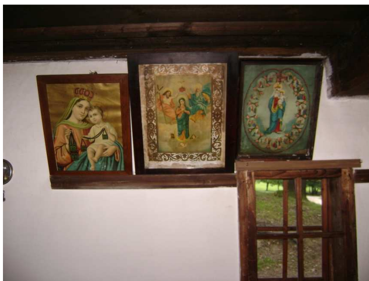
Obr. č. 10 – Obrazy na zdi

Na druhé fotografii je vyobrazena obytná místnost domu z roku 1816, který náležel rodině zvěrokleštiče – „miskáře“. Ve 30. letech 20. století zde bydlely dvě rodiny bez příbuzenského vztahu.