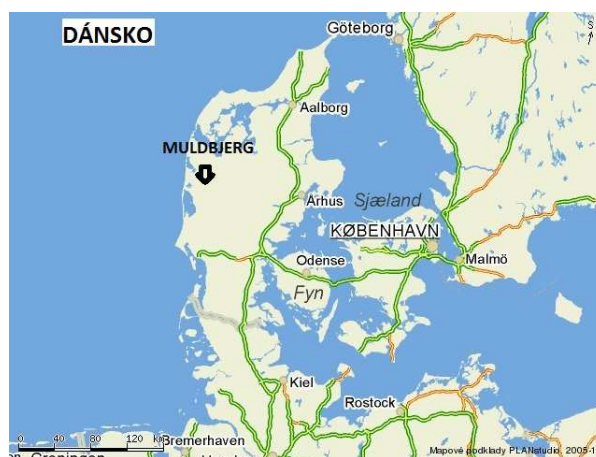
Obr. č. 1 – Muldbjerg

„Před rokem 1500 nebyly židle v Evropě ještě tolik rozšířeny, avšak jejich výroba existovala. Jedním z nejstarších dochovaných kusů nábytku je skládací židle z jasanového dřeva se sedákem z vydří kůže, jehož tvar velmi připomíná naše rybářské židličky. Byla nalezena poblíž Muldbjergu v Dánsku a odhaduje se, že pochází z doby více než 1000 let př. n. l. Tento exemplář je poněkud neobvyklý, protože v našem podnebí téměř všechny dřevěný nábytek určený k sezení a vyrobený před rokem 1500 podlehl skáze.“ (Encyklopedie NÁBYTEK, 2008, s.18)