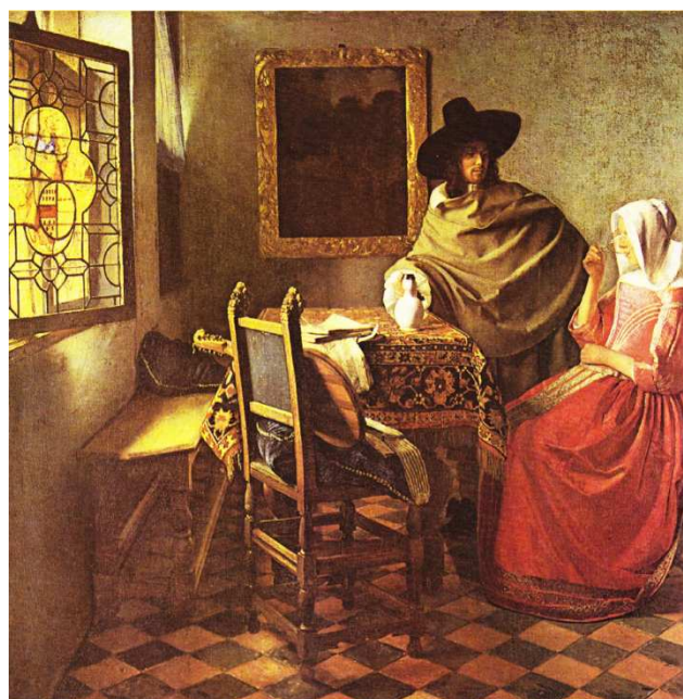
Obr. č. 29 - Kavalír a dáma pijící víno