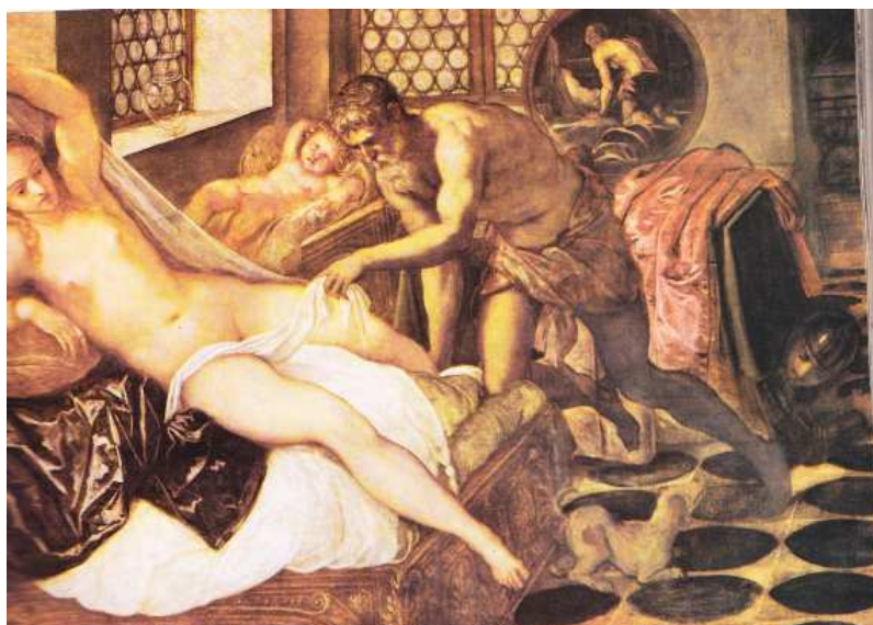
Obr. č. 24 - Mars a Venuše překvapeni Vulkánem

Lůžko na obraze mě zaujalo bohatou řezbou s rostlinnými motivy a ovály. Tuto techniku zdobení tipuji na intarzii, která se začíná objevovat právě v období renesance. Dítě v pozadí odpočívá na truhle, čímž se mi na mysl dostává otázka: „Na čem spaly děti?“ Pro dospělé se pozvolna od dob Antiky zhotovovaly sofa, divany v pozdější době i postele a lůžka, ale nikde se nepíše o vývoji nábytku dětského světa.