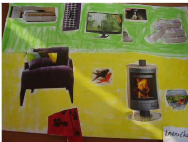
Obr. č. 21 – Teplo domova