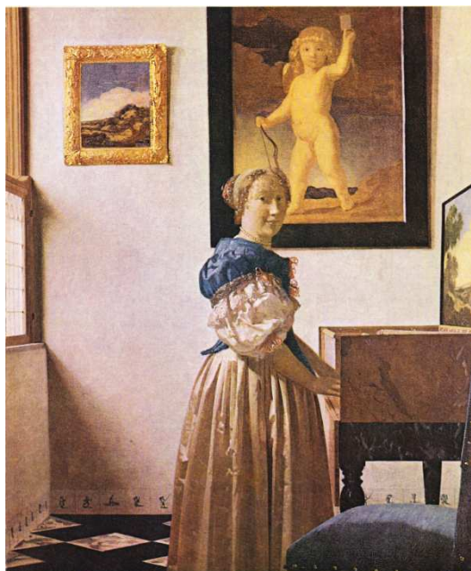
Obr. č. 26 - Mladá žena v modrém