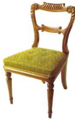
Obr. č. 2 – Jídelní židle Vilém VI.