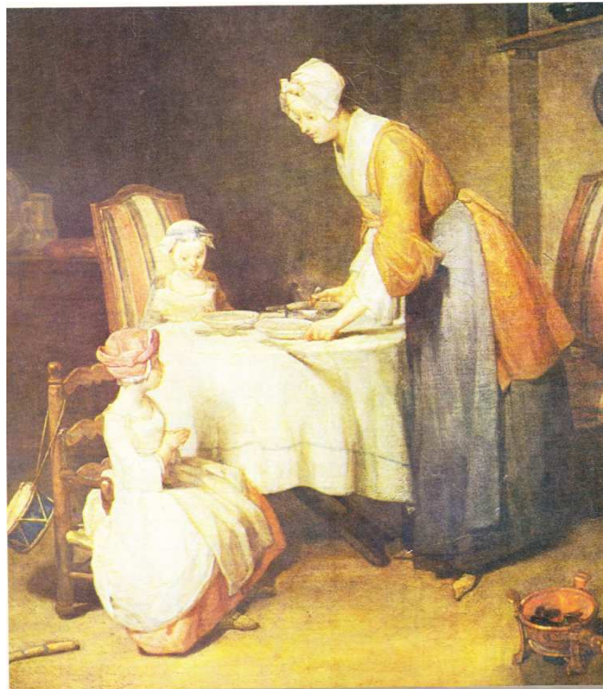
Obr. č. 34 - Modlitba před jídlem

Důraz kladen na děj. Místnost na mě působí jako pokoj obyčejné domácnosti, použité barvy jsou nevýrazné, což může být uzpůsobeno stářím obrazu. Konečně si mohu prohlédnout také něco z dětského nábytku – v konkrétním případě nízká stolička, na které sedí dítě. Obraz vypadá jako by byl nasvícen reflektory, připomíná mi večer.