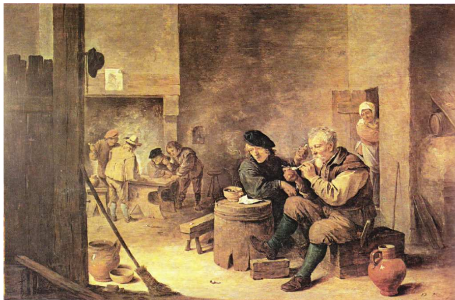
Obr. č. 32 – Kuřáci