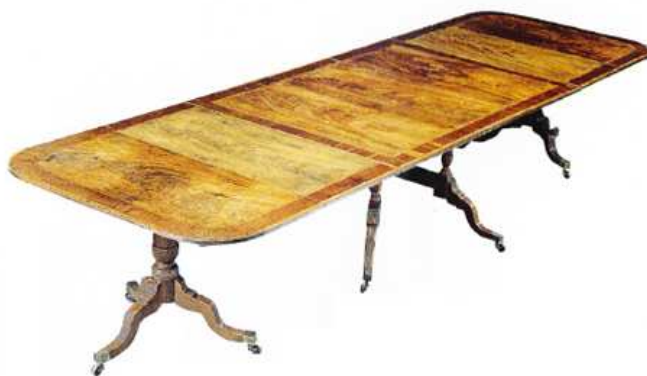
Obr. č. 4 – Mahagonový jídelní stůl s centrálními podnožemi - Jiří III.

„ V 19. stol. stávaly uprostřed salónu kulaté stoly na centrální podnoži o průměru často přes 120 cm, kde se jedlo, ale i hrála karetní hra lanterloo (odsud anglický výraz pro tento stůl – lootable).“ (Forrest, 1997, s.50)