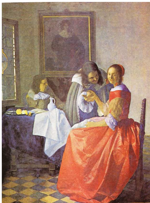
Obr. č. 30 - Dívka se sklenicí vína