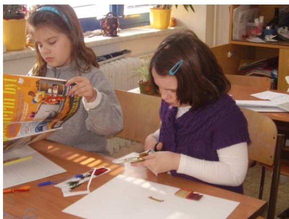
Obr. č. 14 - Tvorba

Začínáme listovat v katalogích. Děti se opravdu pro nápad nadchly a pečlivě vybíraly jednotlivé kousky pro svůj byt. Listování v časopisech nám tak zabralo značnou část jedné vyučovací hodiny. Naštěstí jsme měli na zpracování „díla“ vyhraněny dvě vyučovací hodiny.