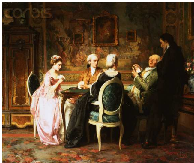
Obr. č. 5 - The Card Game by Karl Heinrich Hoff 19th century

Obraz z 19. Století. Osoby z vyšší společenské vrstvy, hrající jakousi karetní hru.