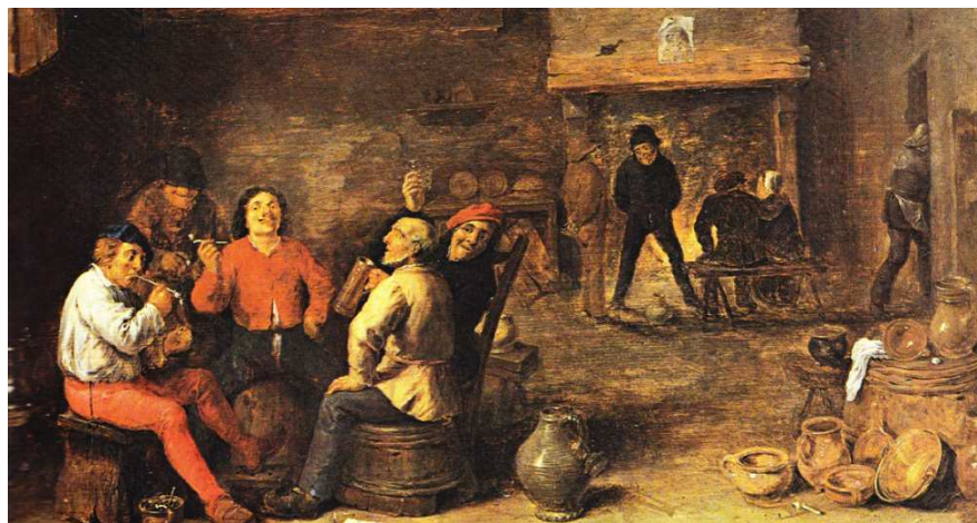
Obr. č. 33 - Kuřáci a pijáci (Pijoan, 1981)

Oba obrazy se zaměřují na zobrazení venkovské hospody oné doby. David Teniers mladší se k tomuto žánru nechal inspirovat Brouwerem.