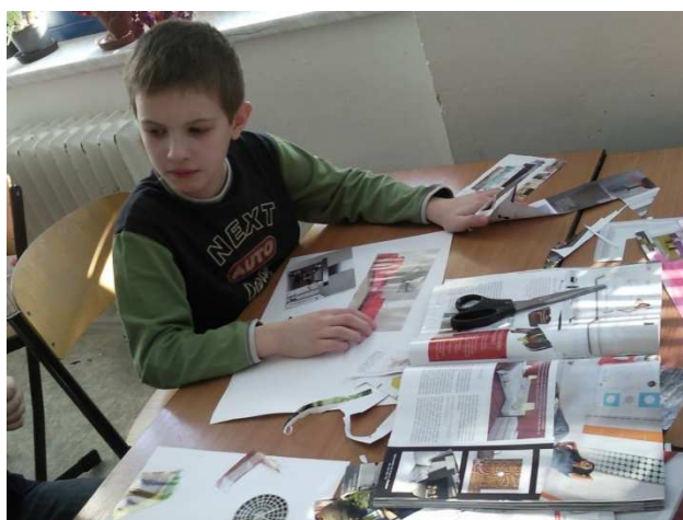
Obr. č. 16 – Chaos na lavici

Ve většině případů tvořily děti k mému překvapení obývací pokoj. Spíše jsem čekala, že se vrhnou na své vlastní pokojíčky. Možná to bylo způsobeno množstvím obrázků v katalogích, kde převážně figurovaly pestrobarevné pohovky v moderním designu. Některé děti dokonce zhotovovaly celý byt a jiné si chtěly svůj pokoj pouze namalovat.