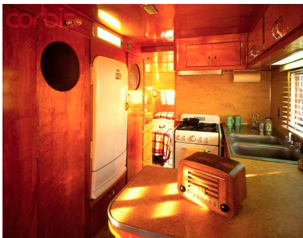
Obr. č. 13 - Kitchen Interior of a 1951 Spartanette Trailer (kuchyňský interiér z roku 1951)