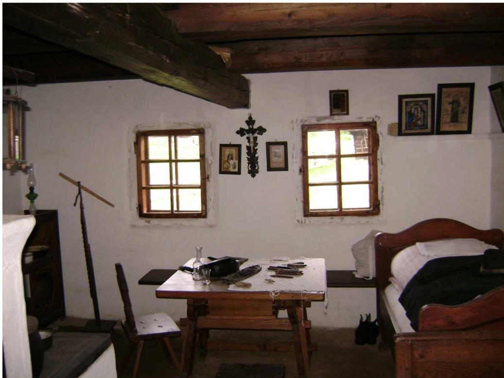
Obr. č. 9 – Obytná místnost domu z roku 1816