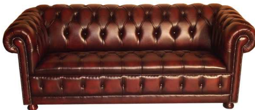
Obr. č. 3 – Dnešní CHESTERFIELD

U Chesterfieldů bývaly běžné krátké soustružené nohy, které obvykle mívaly kolečka. Mohu říct, že i dnes je pohovka stylu Chesterfield velmi krásným a skvostným kusem nábytku.