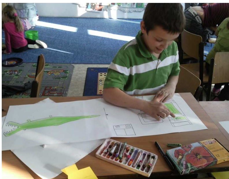
Obr. č. 17 – Pokoj v krokodýlovi

Velmi mě zaujala chlapcova představa (na fotografii výše): „Já bych chtěl mít vlastní pokoj ve velkém nafukovacím krokodýlovi, kde by se vcházelo tlamou.“ V levé části obrázku se nachází nafukovací krokodýl, vpravo je detail „pokoje v krokodýlovi“.