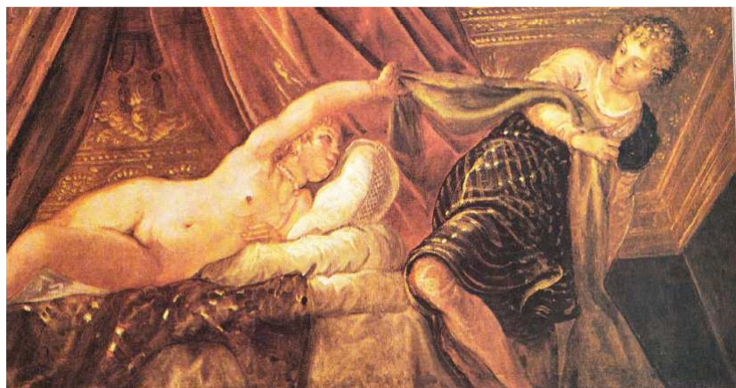
Obr. č. 23 - Josef a Putifarka

Na obraze Josef a Putifarka figuruje postel s baldachýnem visícím jaksí mimo strop, jež zaujímá mou pozornost, mám-li na obraze hledat nábytek. Baldachýn navíc dotváří atmosféru obrazu. Nicméně v době vzniku obrazu byly postele s baldachýny běžně používaným kusem v interiéru, tedy alespoň v obydlí majetných lidí.