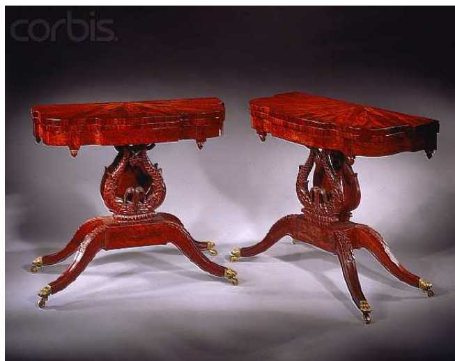
Obr. č. 6 - Two Classical Card Tables - Peter Harholdtca. 1820 (dva klasické karetní stolky od Petera Harholdtca z roku 1820)