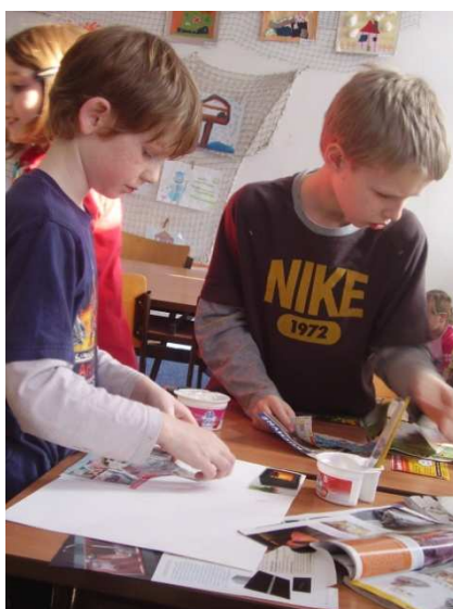
Obr. č. 15 – Práce chlapců

Ve většině případů tvořily děti k mému překvapení obývací pokoj. Spíše jsem čekala, že se vrhnou na své vlastní pokojíčky. Možná to bylo způsobeno množstvím obrázků v katalogích, kde převážně figurovaly pestrobarevné pohovky v moderním designu. Některé děti dokonce zhotovovaly celý byt a jiné si chtěly svůj pokoj pouze namalovat.