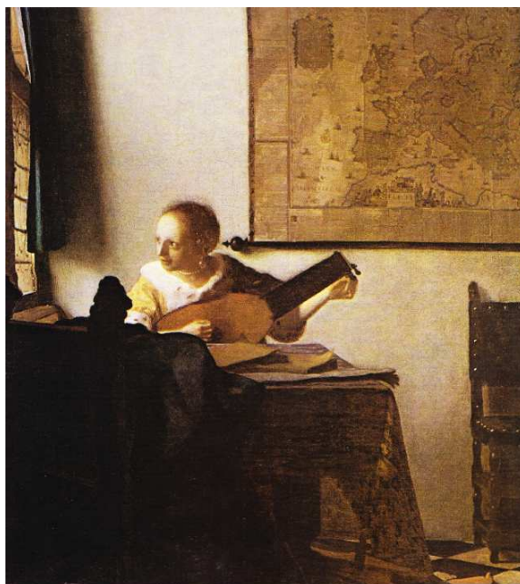
Obr. č. 27 – Loutnistka