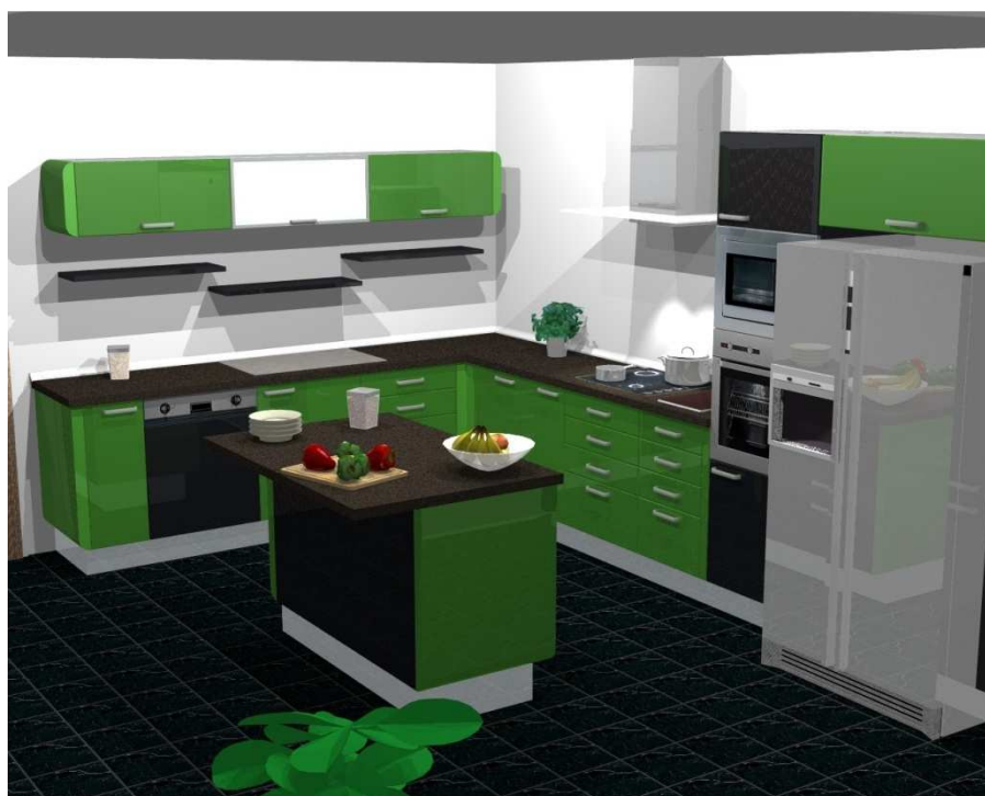
Obr. č. 11 – Návrh moderní kuchyně

Má však dnešní moderna šanci přežít další budoucnost? Jak dlouho se udrží ve škatulce s názvem „moderní“, než ji převálcuje zase nějaký nový nápad, který s sebou strhne většinu lidí?