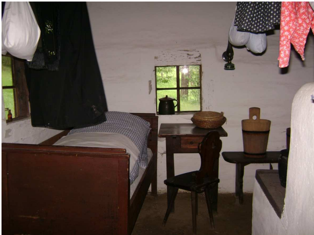
Obr. č. 8 – Světnice lidového domu za 1. světové války