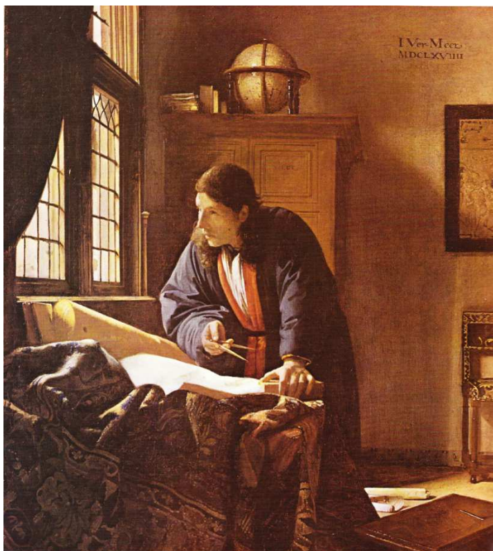
Obr. č. 25 – Geograf

V pozadí si lze všimnout skříně, která nejspíš slouží jako úložný prostor pro knihy, spisy, svitky. Soudím tak vzhledem k funkci celé místnosti zobrazující pracovnu geografa na obraze. Popisek u obrazu v knize DĚJIN UMĚNÍ od Pijoana však zpochybňuje název obrazu a přiklání se k tomu, že muž je astrolog či snad samotný Vermeer.