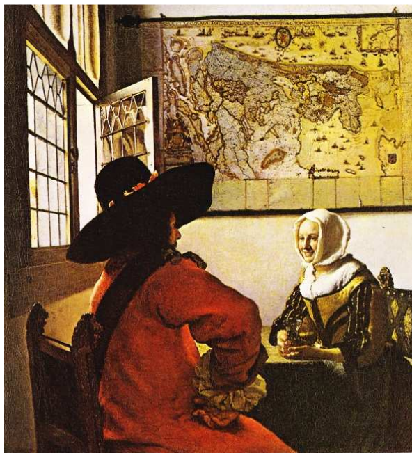
Obr. č. 28 - Plátno voják a smějící se dívka