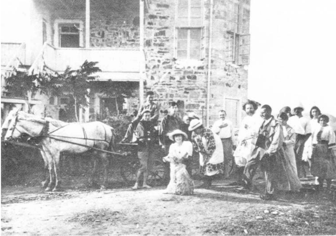
1913 г. Отъезд Цветаевой из Коктебеля