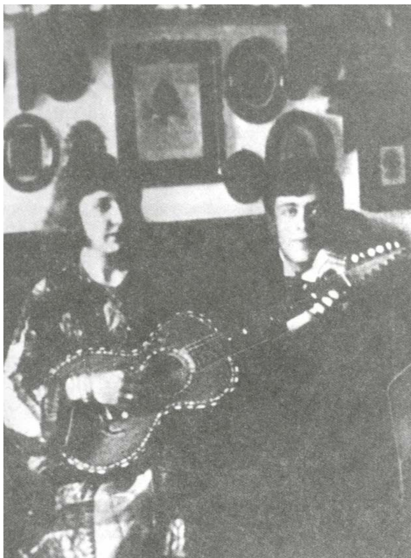
1914 г., Феодосия. Марина Цветаева и Сергей Эфрон