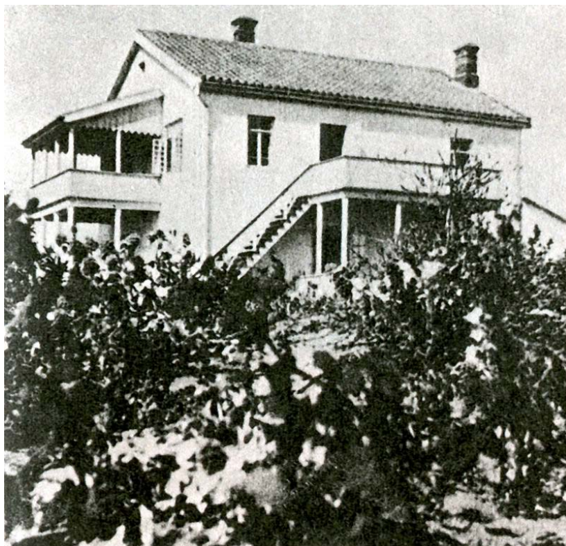
Дом М. Волошина в Коктебеле, 1910-е гг