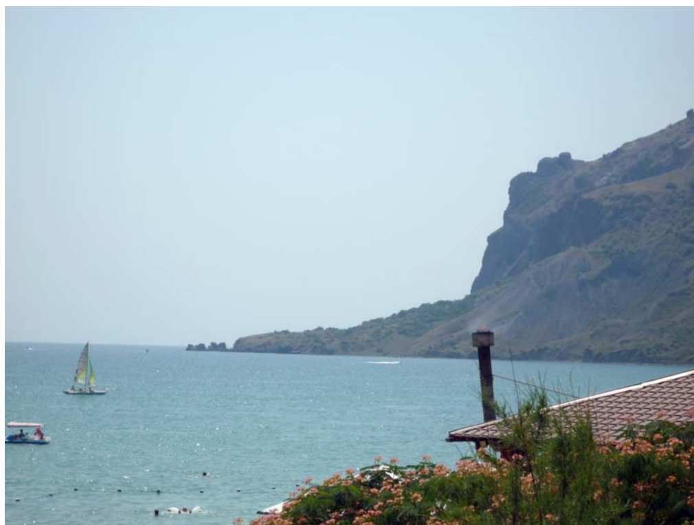
Коктебель. Гора с профилем Волошина