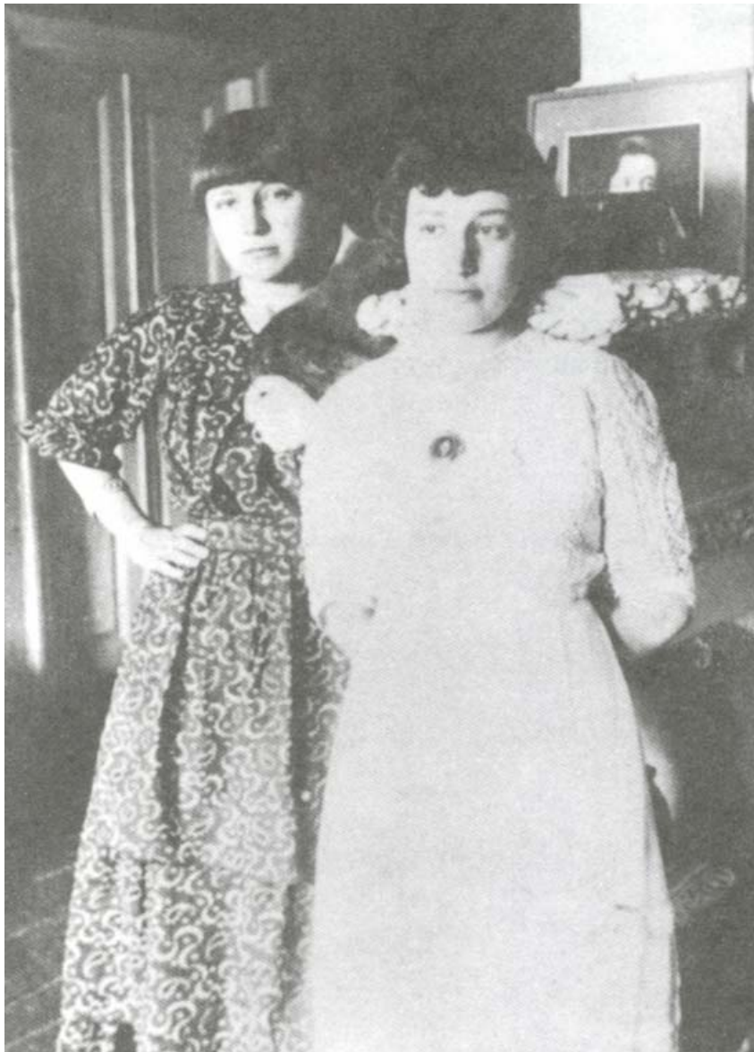
1914 г., Феодосия. Марина и Анастасия Цветаевы