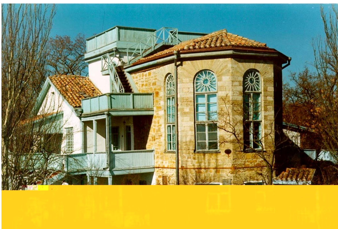
Дом М. Волошина в Коктебеле, современный вид