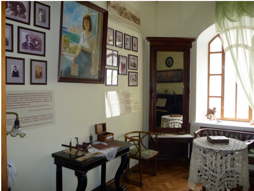
Дом-музей сестер Цветаевых. Феодосия