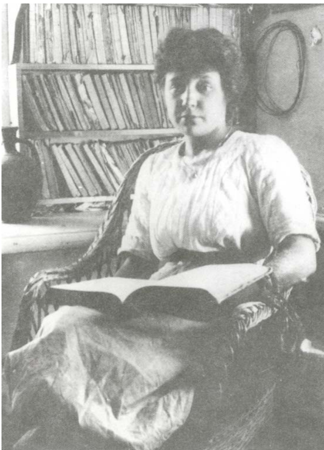
1911 г., Коктебель