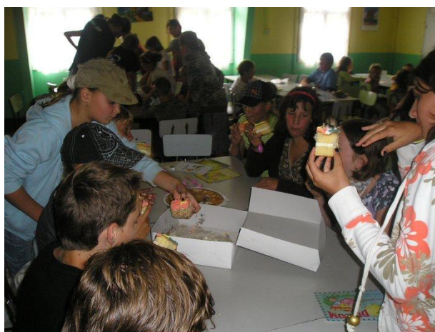
Sladká odm na nakonec