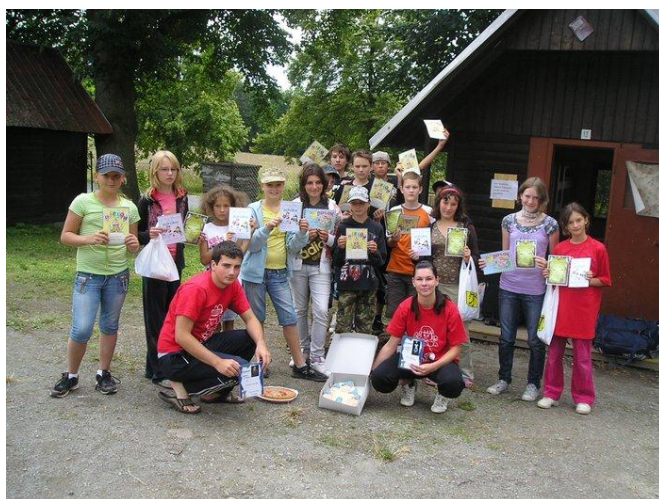
Vít zný oddíl