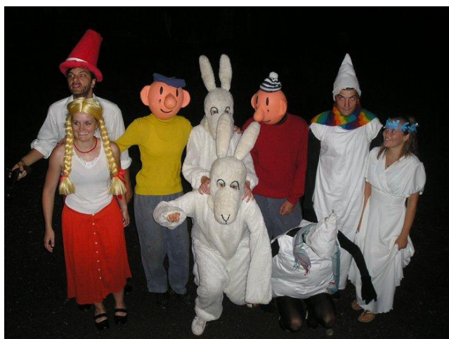
Vedoucí jako pohádkové bytosti