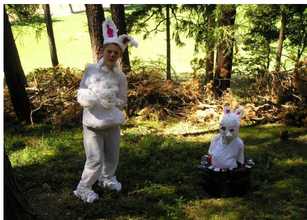
Bob a Bobek