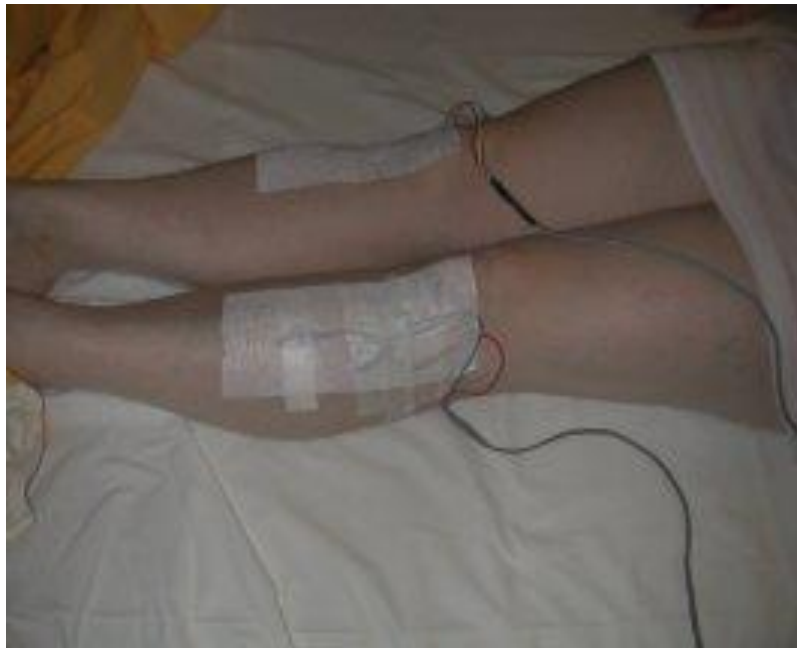
Obrázok číslo 6: Zobrazuje pacienta pripraveného na polysomnografické vyšetrenie (elektrody na monitorovanie pohybov dolných končatín)