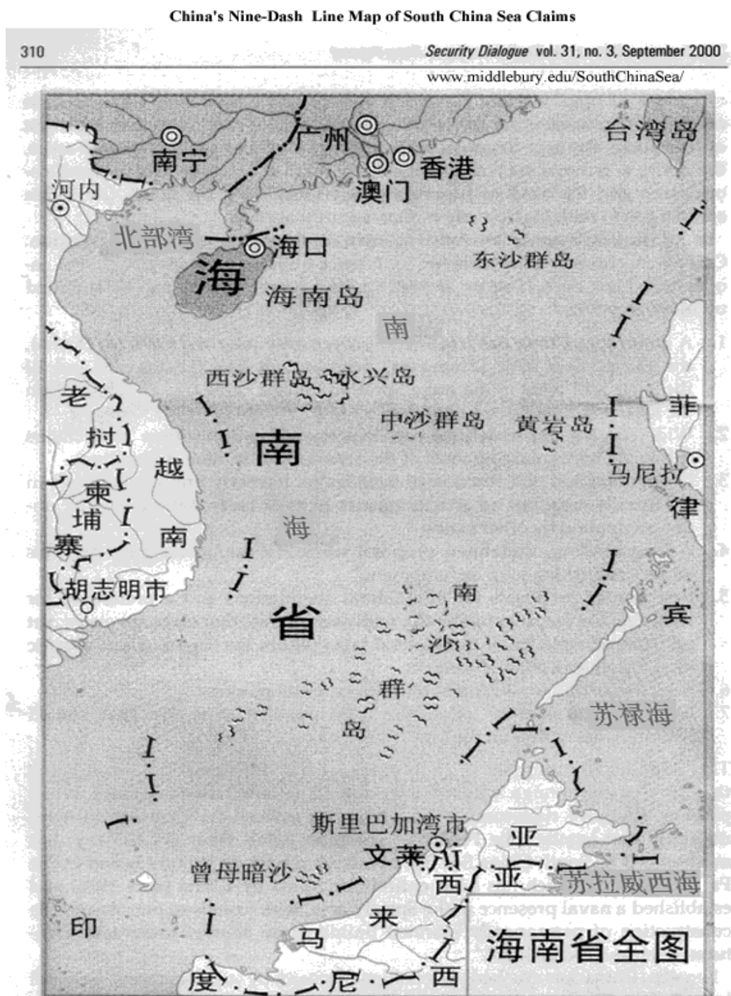
Map 2: Official Chinese map of the South China Sea with the nine-dotted line

Mapa samosprávy provincie Hainan, pod ktorú patria podľa nárokov zo strany ČLR Paracelské (Xisha qundao 西沙群岛) a Spratlyove (Nansha qundao 南沙群岛) ostrovy.