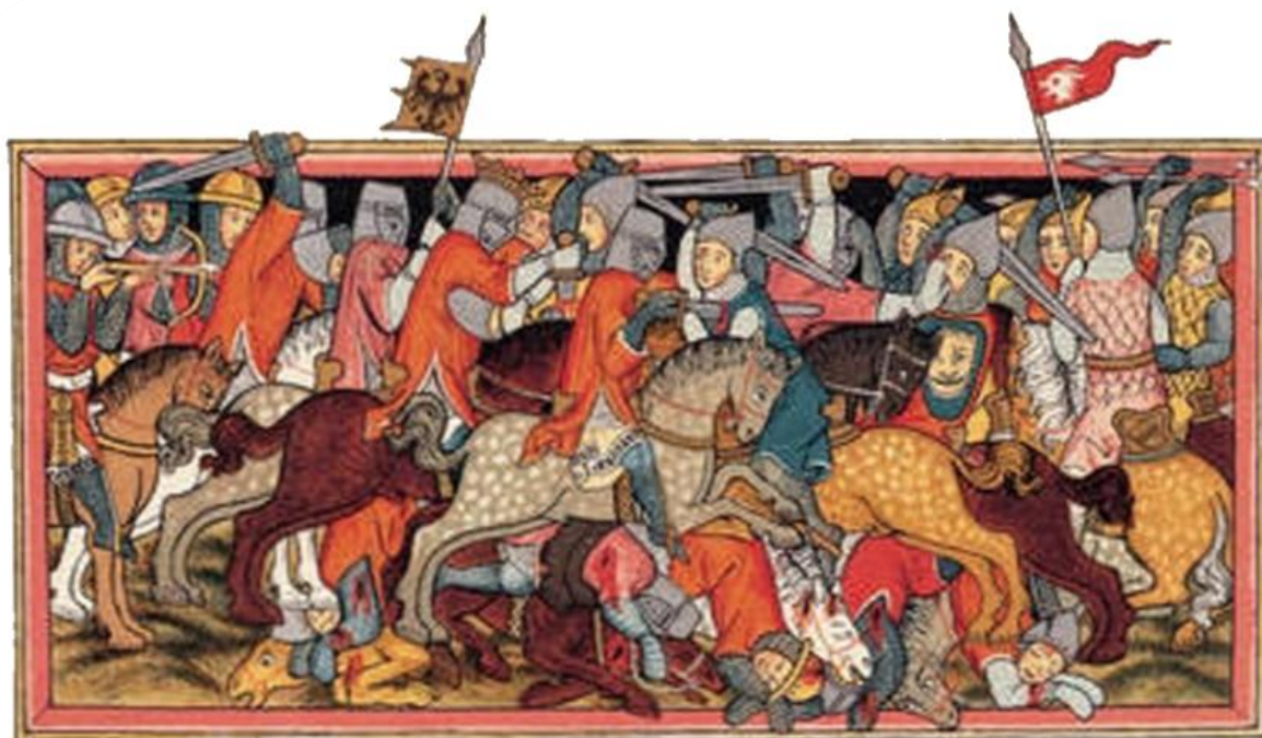
Bitva u Mühlendorfu na iluminaci z rukopisu rytířského románu Willehalm (1334)