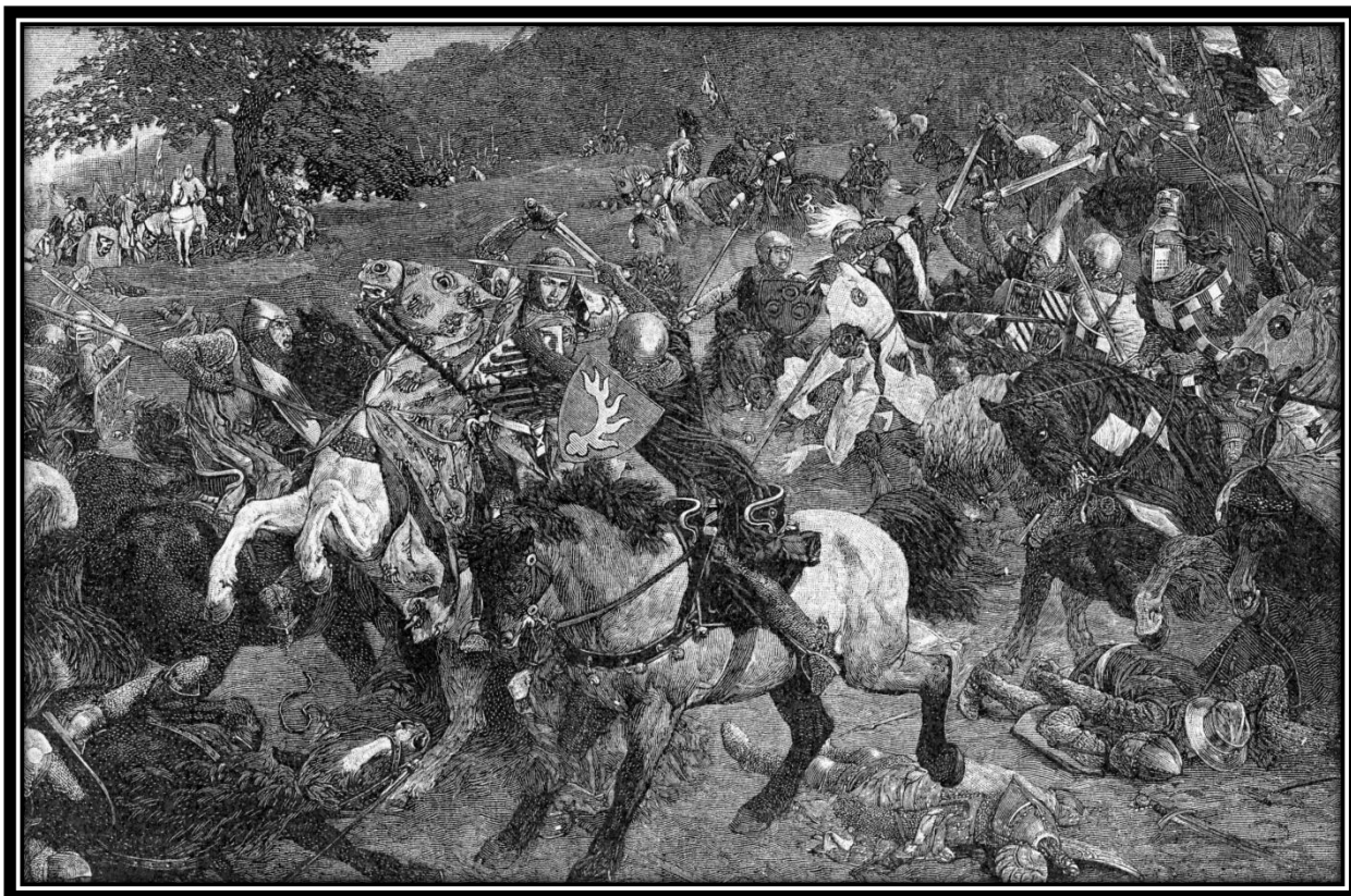
Zajímání Fridricha Habsburského na obrazu Hermanna Knackfuße (1900)