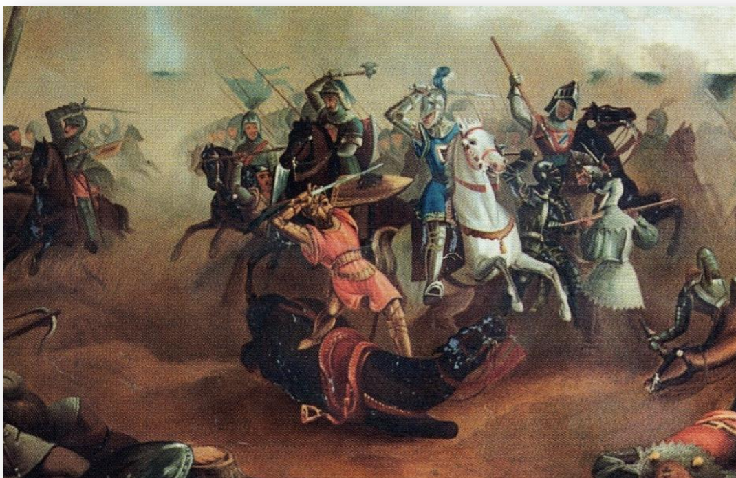
Olejomalba z mühlдорfského muzea znázorňující zajímání Fridricha I. Sličného (1838)