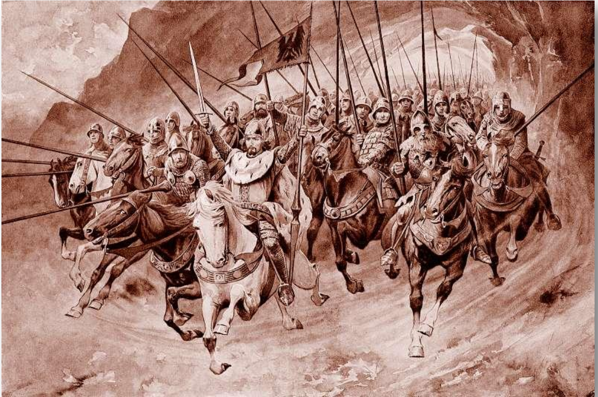
Svatý Václav v čele blanických rytířů na ilustraci Věnceslava Černého ze Starých pověstí českých (1898)