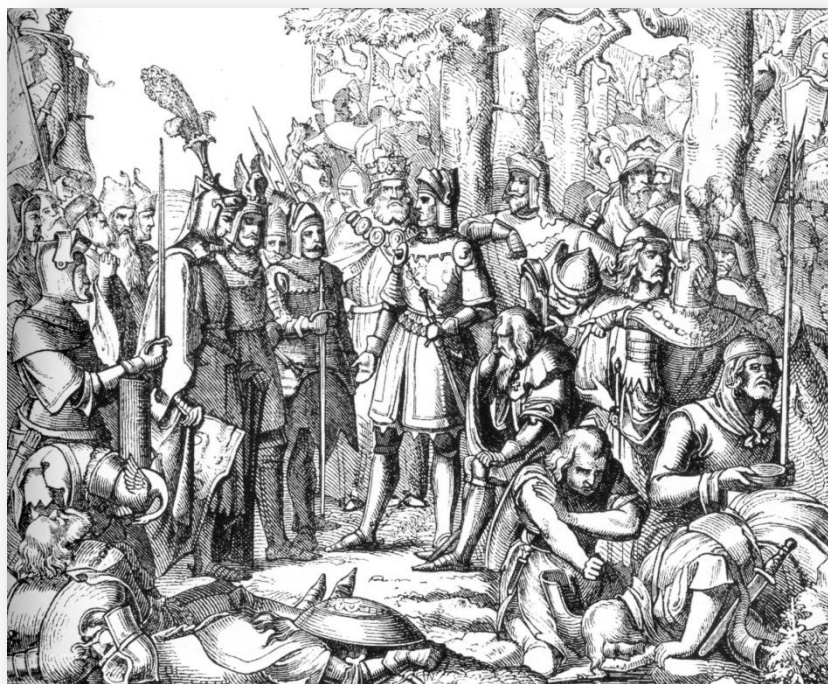
Dřevoryt zobrazující předvedení poraženého Fridricha Sličného před Ludvíka Bavora (1860)