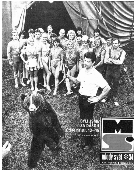
BYLI JSME ZA DAŠOU. Čtěte na str. 13-15.