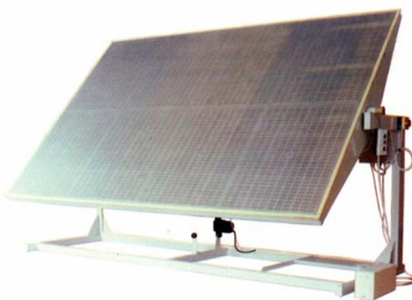
Obr. č. 4 Vakuový stůl pro fotografování plakátů [získáno přes WWW 2011-04-15]

V roce 1997 bylo založeno digitalizační pracoviště ve spolupráci s bývalými pracovníky VÚZORT. Od tohoto roku se oddělení věnuje systematické digitalizaci obrazových materiálů, v první řadě tedy fotografií a plakátů k českým hraným filmům, zahraničním hraným i nehraným filmům a portrétům osobností české i světové kinematografie. V roce 2010 bylo digitalizováno celkem 9164 fotografií a 97 filmových plakátů a k 31. prosinci 2010 bylo celkem digitalizováno 79 996 obrazových materiálů – 77 500 fotografií a 2 496 filmových plakátů. 29 Oddělení digitalizuje plakáty do formátu A3 vlastními prostředky a digitalizace větších formátů (někdy délka až 250 cm) probíhá ve spolupráci s firmou Albertina icome Praha .