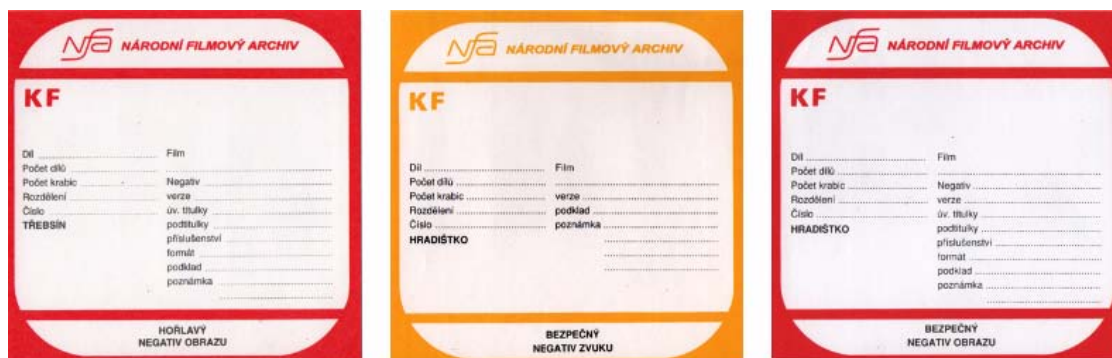
Obr. č. 3: Identifikační štítky k označení krabic

kopie a duplikační kopie nehraných filmů, negativy hraných filmů, negativy nehraných filmů, nefilmový audiovizuální záznam získaný na základě zákonné nabídkové povinnosti, audiovizuální nosiče BETA, DVD, VHS s TC a VHS.