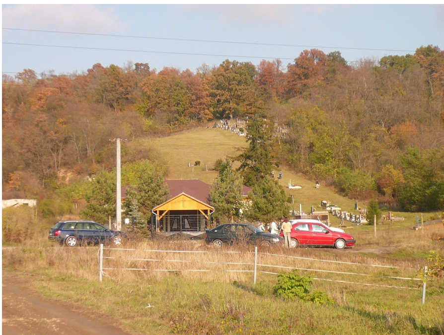
2. Pohled na hřbitov z Cintorínské ulice, říjen 2009 (V dolní části hřbitova se nachází dům smutku, nahoře na kopci jsou nejstarší hroby.)