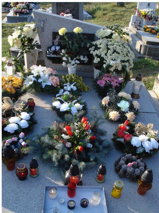
8. Ukázka výzdoby hrobu během svátku Všechny svatých, říjen 2009.