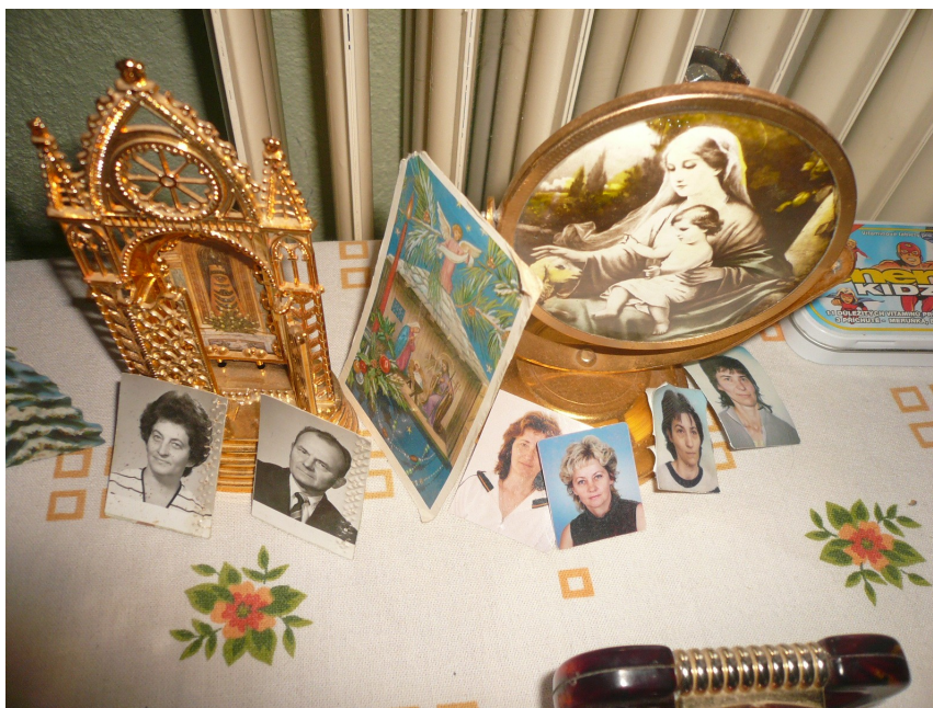
9. Ukázka vystavených fotografií zesnulých a žijících členů rodiny spolu s předměty sakrálního významu, říjen 2009. (Fotografie zesnulých rodičů se nacházejí na levé straně).