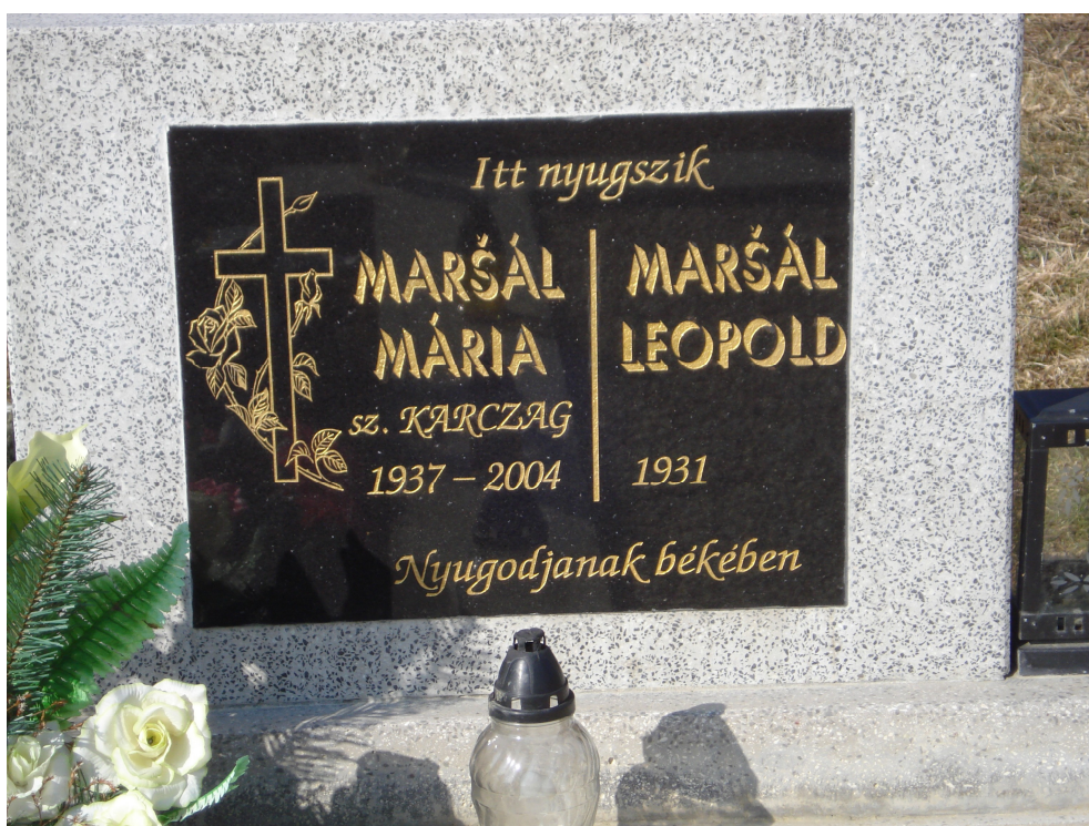
4. Ukázka obvyklého pomníku, únor 2011. (Pomník obsahuje údaje o zesnulém a jednoduchý sakrální motiv).