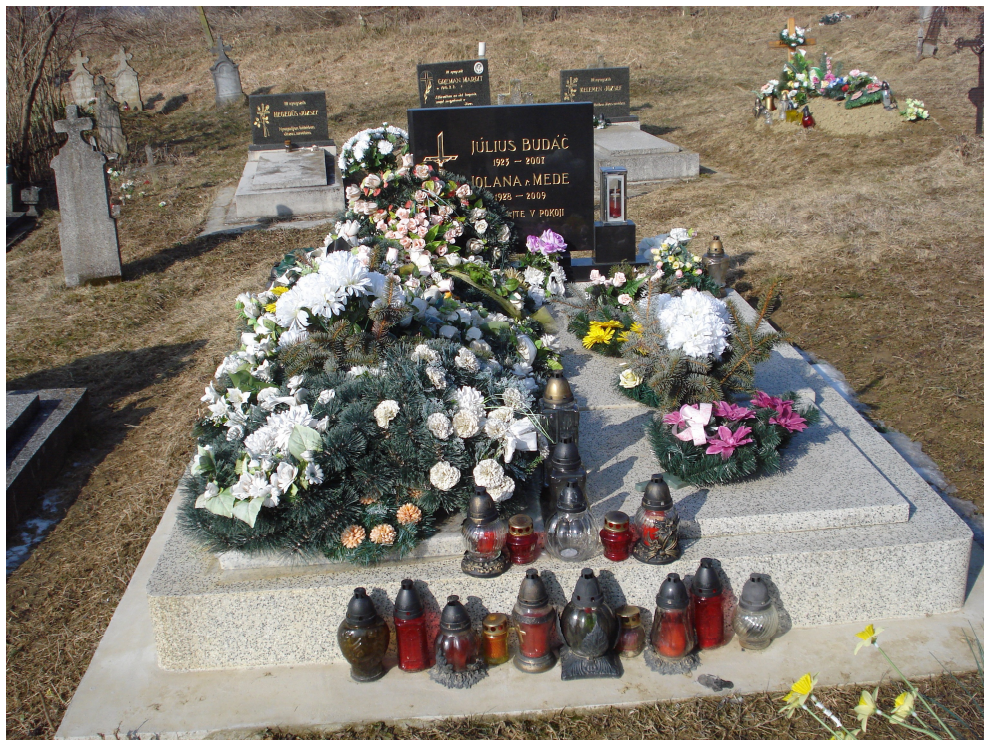
3. Ukázka obvyklého typu hrobu, únor 2009 (mramorový náhrobek a pomník). Hrob je ozdobený umělými květinami.