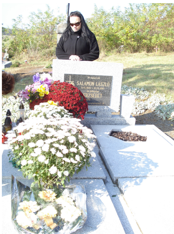
6. Žena držící smutek za zesnulého otce u hrobu svých rodičů, říjen 2009. Výzdoba je pouze na otcově straně.