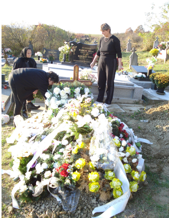
7. Přípravy svátku Všechny svatých, říjen 2009. V popředí fotografie je čerstvě zakopaný hrob, na němž jsou navršeny květinové věnce.