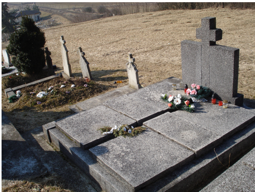
5. Pohled na hroby s nápísem z druhé strany, únor 2011. (Nápis směřuje k pěšině)