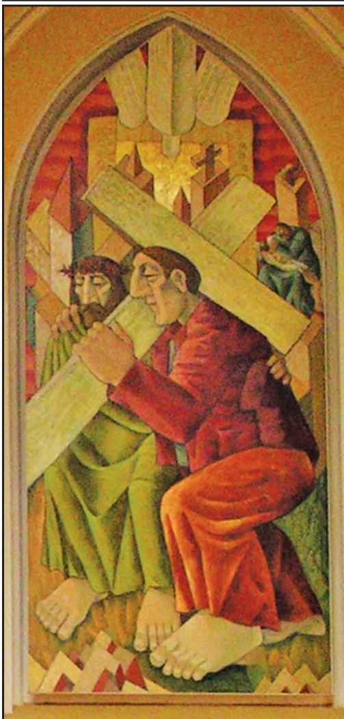
Cyklus obrazů od Miroslava Rady pro farní sbor ČCE - Praha Vinohrady