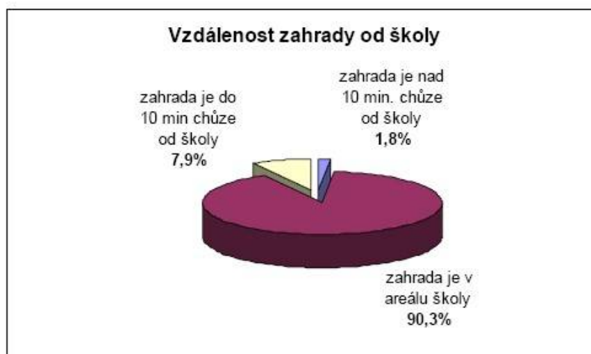
Graf IV – Vzdálenost zahrady od školy (Baueršimová, 2007).