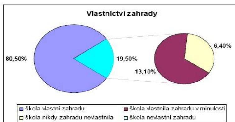
Graf I – Vlastnictví zahrady (Baueršimová, 2007).

Grafy jsou převzaty ze závěrečné zprávy průzkumu Stav školních zahrad při základních školách v České republice v rámci projektu „Školní zahrady jako přírodní učebny v České republice a v Německu,“ který byl proveden Chaloupkami o. p. s. za podpory Deutsche Bundesstiftung Umwelt. Závěrečná zpráva byla zpracována Baueršimovou (2007).