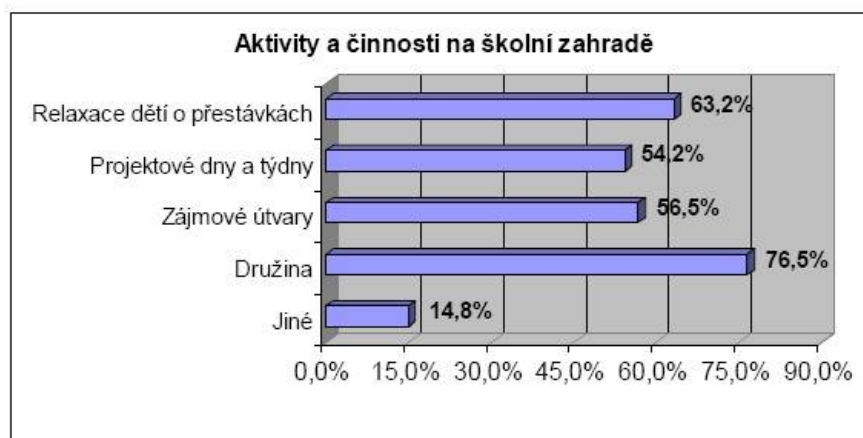
Graf III – Aktivity a činnosti na školní zahradě (Baueršimová, 2007).