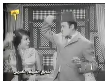
obr. 46 - Zubajdin byt přes den

Odlisný typ filmové scény představují scény demonstrací, jež mírně vybočují ze všeho, co se dá říct o ostatních scénách použitých ve filmu, zejména kvůli tomu, že jsou výrazně epičtějšího charakteru než cokoli jiného ve filmu použitého. Dají se také rozdělit do dvou skupin. První jsou uzavřené ulice. Jde v podstatě o kameru zabírající tok lidí korytem ulice ohrazené dvěma vysokými stěnami stejným způsobem, jakým by