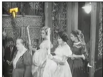
obr. 17 - sestry na Jāsīnově svatbě