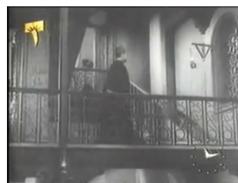
obr. 2 - stále v první scéně SA prochází domem a vyjde do prvního poschodí