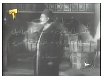
obr. 34 - dvůr na začátku filmu ve svém holém stavu