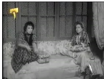
obr. 18 - sestry během své hádky