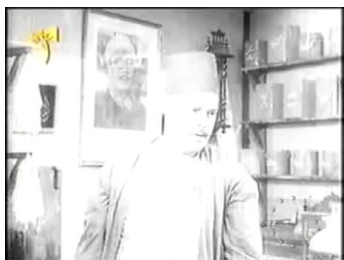
obr. 49 - přesvícená scéna

nebývá doma a do dění v rodině nezasahuje a již samotná jeho přítomnost má rušivou funkci.