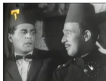
obr. 54 - dobře viditelné tváře obou

Zajímavě nasvícená je i scéna patriarchova ponížení britskými vojáky, s tím rozdílem od výše popsané scény, že SA na ni nevkróčí se světlem v zádech, ale s téměř oslňujícím frontálním osvětlením, vrhajícíím dlouhé stíny. Silné světlo odrážející se na jeho bílém oděvu neomylně zdůrazňuje důležitost SA v této scéně – jeho postava tak důrazně vyvstává v kontrastu s šedým pozadím, šedými britskými uniformami a černým oblekem jeho spoluzajatce ( obr. 55 ). Jeho synové, oděni v černé a krčící se ve stínu, celé scéně přihlíží jen jako neviditelné siluety ( obr. 56 ). Když se pak synové rozhodnou