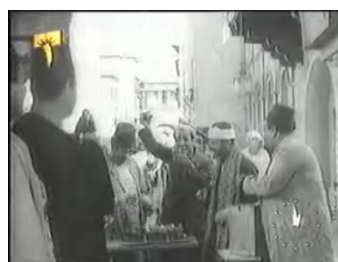
obr. 44 - výhled z obchodu v den propuštění wafdu, SA stojí vlevo a pozoruje situaci

Zajímavá svými kontrasty je scéna Zubajdina bytu, jež je dějištěm dvou zásadních aktů – opulentního „zásrubního“ večírku SA a Zubajdy se zpěvem a tancem a Jāsīnovy návštěvy u Zanuby, během níž tam zastihne otce a dozví se tak o jeho skrytém životě. Pro každou z těchto událostí se scéna změní takřka k nepoznání. Při večírku je místnost plná tančících a zpívajících lidí a naplno osvětlená ( obr. 45 ), takže působí slavnostně a společensky. Při tanci je také využit celý prostor scény, včetně přilehlého schodiště. Vzhledem k tomu, že Jāsīnovo velké odhalení se odehraje ve dne, kdy se v bytě žádná velká společenská událost nekoná ( obr. 46 ), vytváří prázdný byt až strohý všední dojem, který narušuje jen blýskavý taneční oděv (příslib rozjásaných večerů), za nímž se Jāsīn schovává ve skříni.