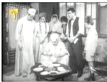
obr. 25 - centrální uspořádání osob u rodinné snídaně