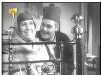
obr. 5 - veselý SA objímá manželku

Výsadní postavení v patriarchově životě má, jako v životě každého řádného muslima, víra. Tomuto aspektu jeho osobnosti se ale budeme věnovat později.