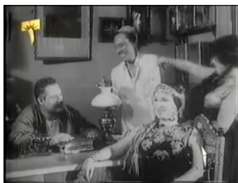
obr. 43 - Zubajda prošla obchodem a usadila se v zadní místnosti