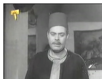
obr. 4 - a v polodetailu tváře je patrná návaznost na první scénu filmu

Nápadnější než rozdíly v syžetu jsou však posuny, k nimž došlo při převodu románu na filmové plátno v rámci fabule. Děj románu, který všechny události vztahuje