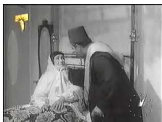
obr. 6 - SA a násilí