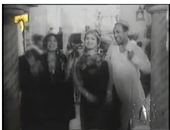
obr. 42 - Zubajda se Zanubou vchází do obchodu

vyjednává, nebo jako přední část obchodu s průchodem na ulici – při Zaghlulově propuštění jako by se obchod invazivně roztáhl až do ulice samotné, v níž patriarchův pomocník Hamzāwī nabízí kolemjdoucím čaj ( obr. 44 ).