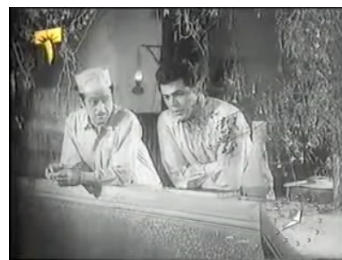
obr. 41 - bratři pozorují vojenské ležení dole na ulici

Zcela odlišná je situace se scénou patriarchova obchodu. O jeho prostorovém rozložení máme jasnou představu od začátku, protože obchod jako jedna ze scén vstupuje do filmu s postavou Zubajdy, přijíždějící ulicí. Vidíme tedy nejprve, jak se zpěvačka blíží ulicí ( obr. 42 ), vchází dovnitř a stále v rámci stejného záběru se přesunuje do zadní části obchodu, kde ji SA usadí ( obr. 43 ). Ačkoli se stále pohybujeme po klasické ose pohledu, jež znemožňuje záběr celé místnosti a omezuje zobrazení prostoru na stoosmdesátistupňový výsek, vidíme, že se všechno nachází na jednom místě (což se na rozdrobené scéně střechy stát nemohlo). Obchod je místem, kde vidíme SA bez jeho domácí přetvářky, ale i bez atmosféry absolutní důvěry a uvolnění, již vyznačuje v přítomnosti nejbližších přátel. Je to SA civilní, pečlivý, ale i veselý a příležitostně flirtující. Po představení obchodu jako scény příchodem Zubajdy se ve filmu objevuje již bez ustavovacího záběru, buď jako zadní část obchodu, kde SA