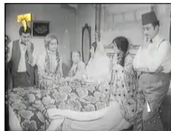
obr. 9 - Amīna jako symetrické jádro rodiny