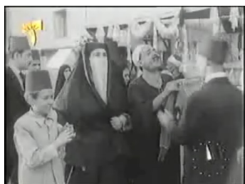
obr. 29 - Amīna na ulici

Do kategorie make-upu spadají i masky a další efekty vytvářené podobným způsobem, zde se to týká zejména krvavých skvrn na obětech potlačených demonstrací, včetně pro film nejpodstatnější krve na Fahmího čele.