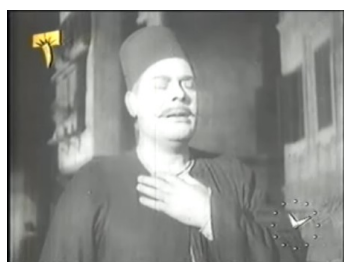
obr. 1 - retrospektivní narace: v první scéně filmu SA jde po ulici...

Ve filmu ale hlavně najdeme jednu podstatnou odchylku nejen od předlohy, ale i od její chronologické narace – celý film je rámován jednáním SA, směřujícího se s Fahmīho smrtí. První scéna zde totiž není nic jiného, než adaptace závěru poslední kapitoly knihy ( obr. 1–4 ). Je však nutno přiznat, že pokud měl režisér opravdu v úmyslu podat Bajna 'l-Qašrajn jako retrospektivní vyprávění z patriarchovy perspektivy, bylo by záhodno na ten časový skok alespoň upozornit. První scéna filmu ukazuje jen jeho zdrcený příchod domů a bez jakéhokoli syntaktického upozornění (zatmívačka, prolínačka) na ni ostrým střihem navazuje scéna s Fahmīm. Divák tak má všechny důvody domnívat se, že první scéna tu druhou i v ději chronologicky předchází, a na to, že se jedná o retrospektivní naraci, nemusí vlastně nikdy přijít.