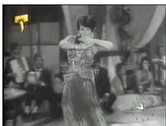
obr. 31 - Zanubīn třpytivý taneční oděv