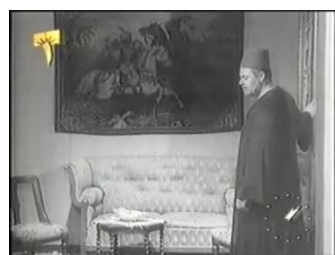
obr. 3 - v závěru filmu SA prochází obývacím pokojem