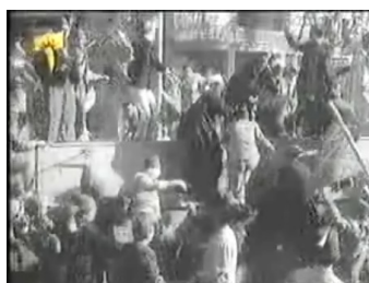
obr. 16 - a jeho poslední pohled patří skupině demonstrujících Egyptanů