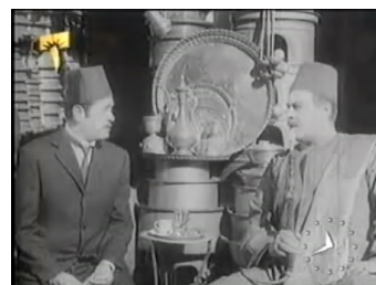
obr. 30 - podobnost SA a Jāsīna