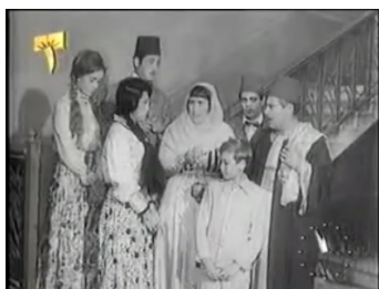
obr. 8 - Amīna jako symetrické jádro rodiny