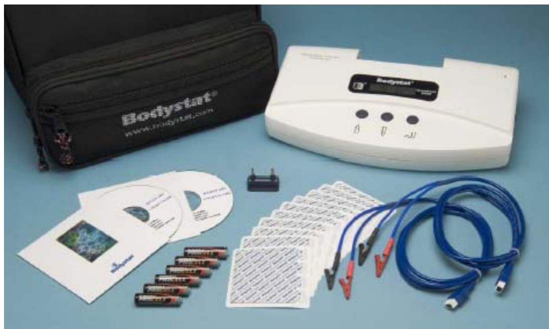
Příloha 3: Přístroj BIA Bodystat Quadscan 4000 a pozice subjektu při měření