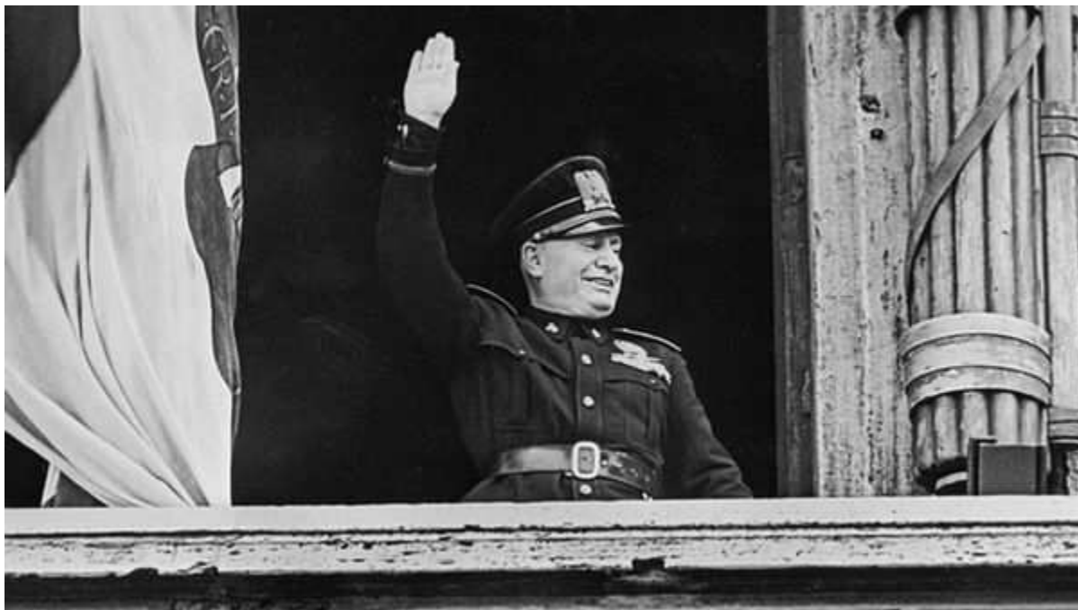
Obr č. 1: Benito Mussolini - Řím, piazza Venezia