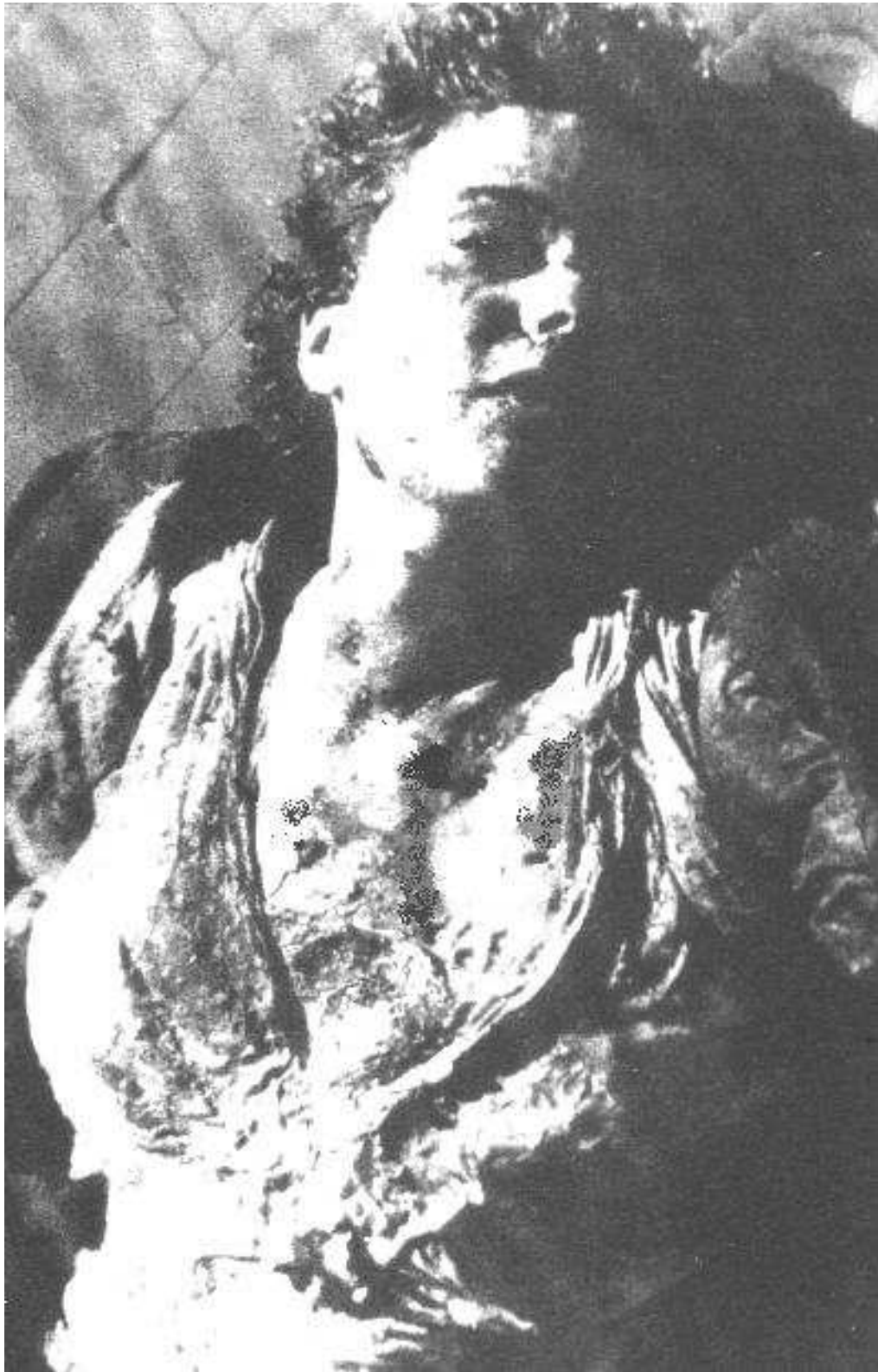
Obr. č. 4: Claretta Patacci, Miláno