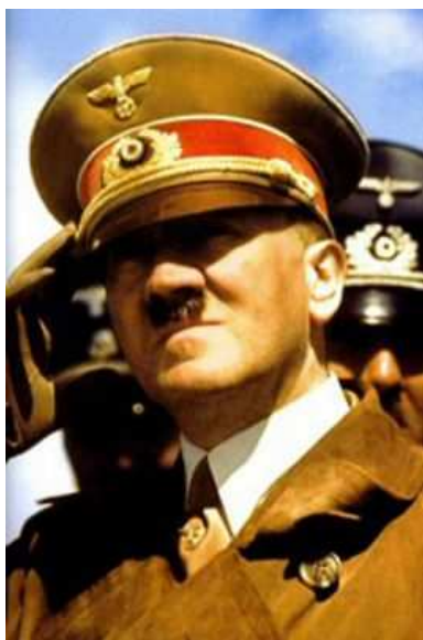
Obr č. 2: Adolf Hitler