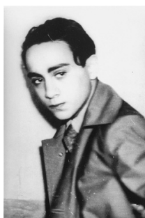
Obr.č. 6: Ernst Vom Rath