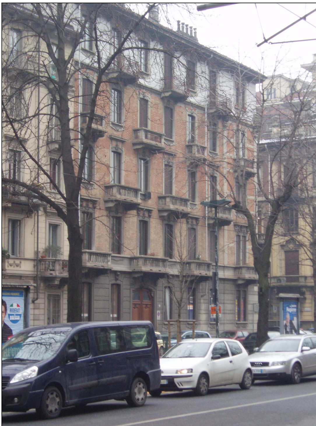
Obr. č. 11, bydlíště Prima Leviho – Turín