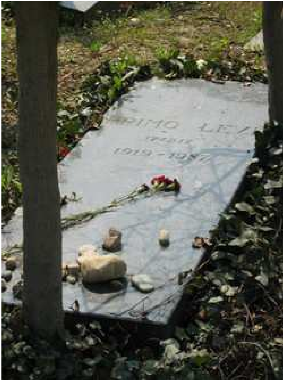
Obr. č. 10: hrobka Prima Leviho, Turín