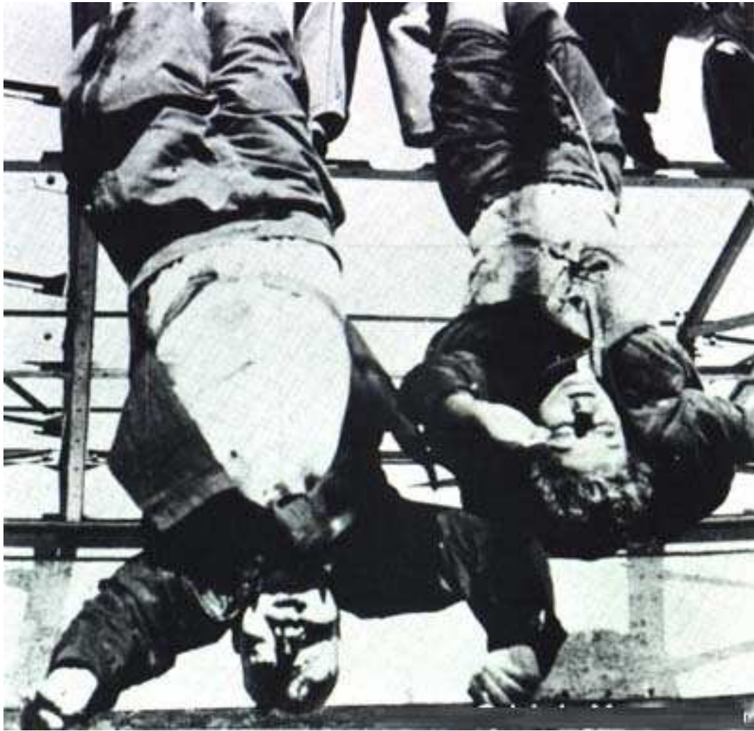
Obr. č. 3: Benito Mussolini a Claretta Patacci, Miláno