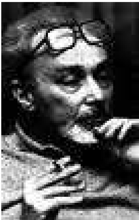
Obr. č. 9: Primo Levi