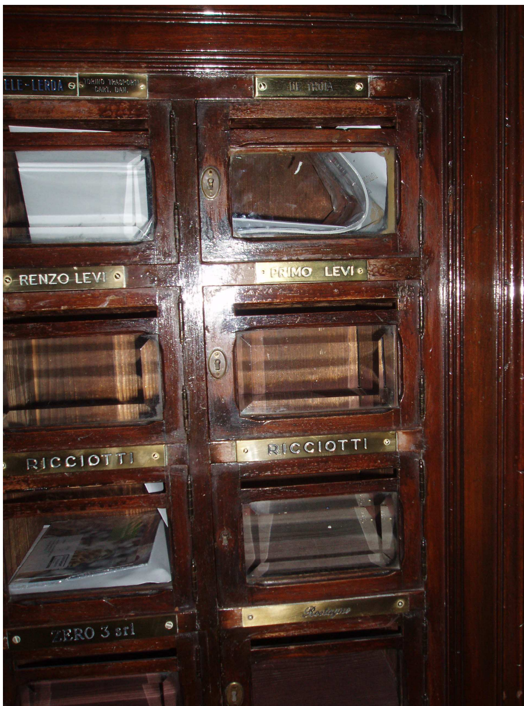
Obr. č. 13, poštovní schránka Prima Leviho, Turín