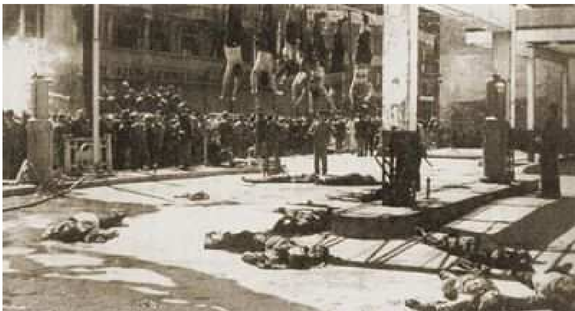
Obr. č. 5: poprava stoupců fašismu, Miláno