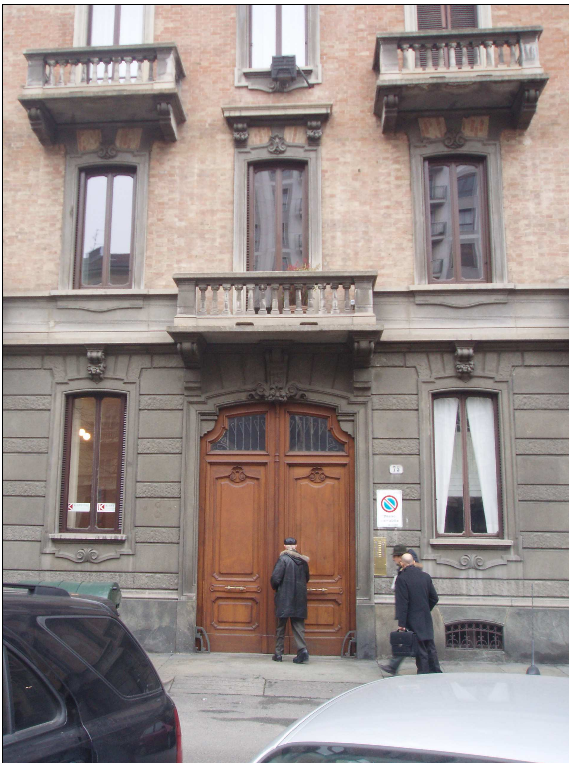
Obr. č. 12, bydlíště – vchod Prima Leviho – Turín