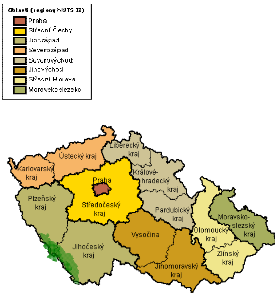
Obrázek 2. Mapa regionů NUTS II a NUTS III (krajů)