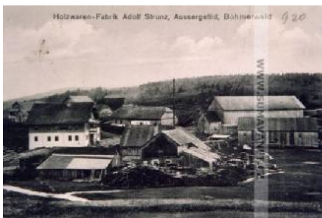
Obrázek 5. Dřevařský podnik Adolfa Strunze