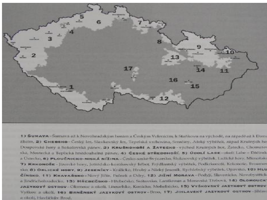
Obrázek 4. Členění a názvy území, která obývali Němci do roku 1945