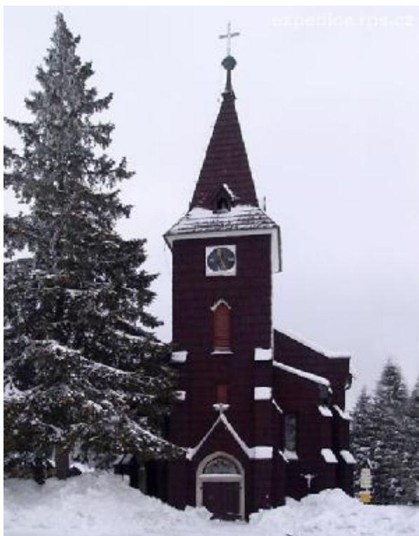
Obrázek 6. kostel sv. Štěpána na Kvildě