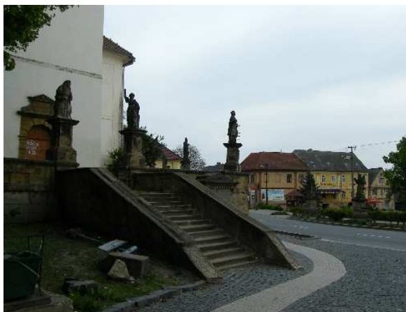
12. Liběšice, sochy na ohradní zdi kostela