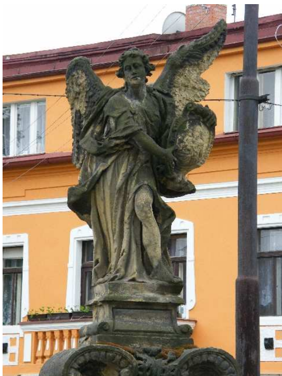
41. Liběšice, anděl nesoucí kartuši se sv. Stanislavem Kostkou