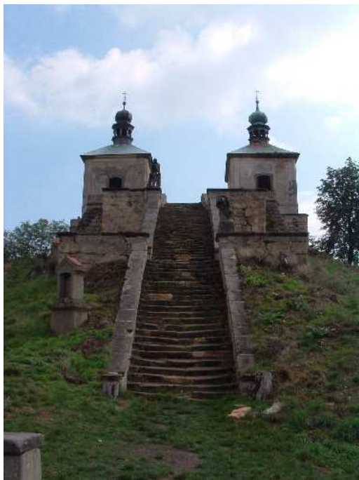
50. Ostré u Úštěka, poutní místo