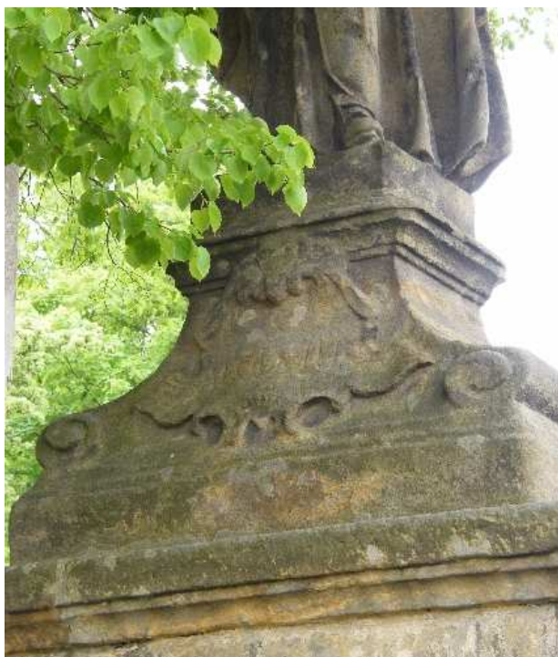
24. Liběšice, sokl sochy sv. Aloise Gonazgy