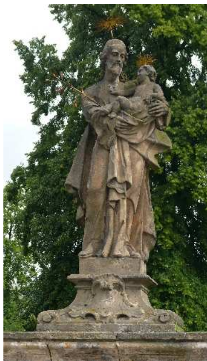
17. Liběšice, socha sv. Josefa na ohradní zdi rezidence