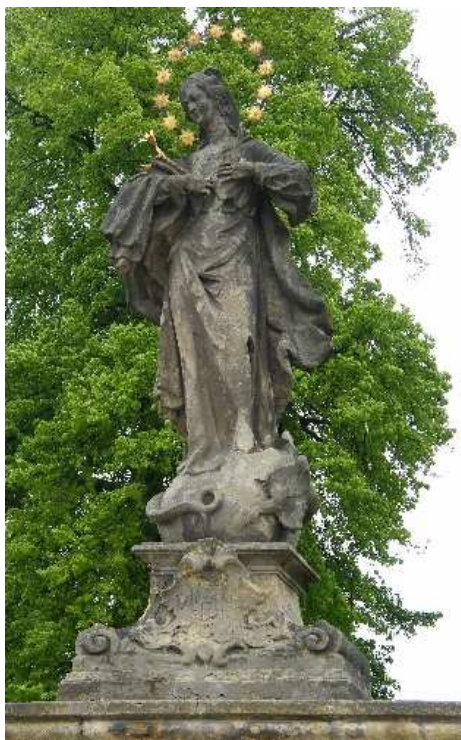
18. Liběšice, socha Panny Marie Immaculaty na ohradní zdi rezidence