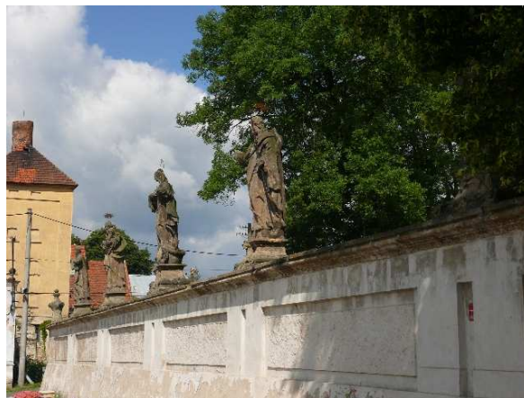
11. Liběšice, pohled na řadu soch na ohradní zdi rezidence