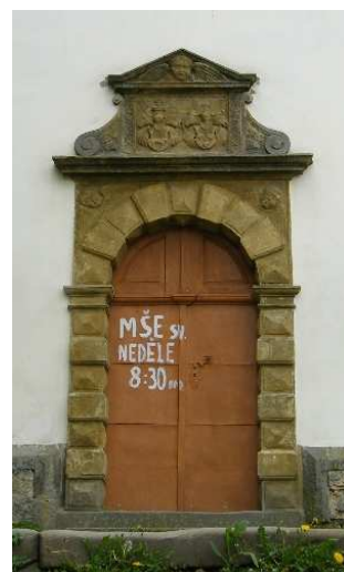
2. Liběšice, portál kostela