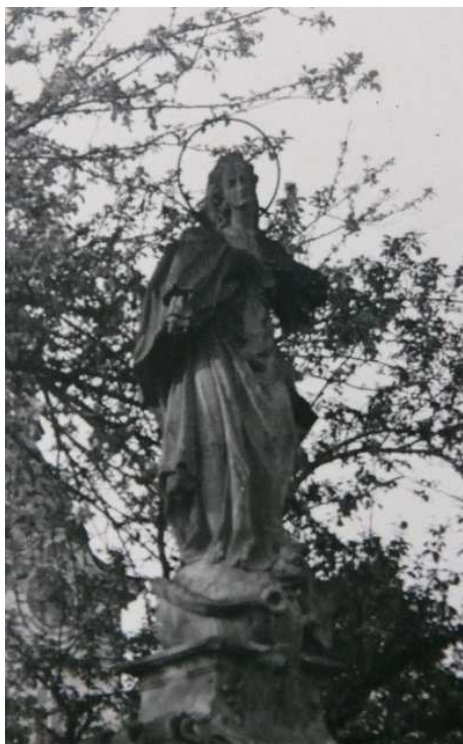
20. Liběšice, socha Panny Marie, fotografie z roku 1944