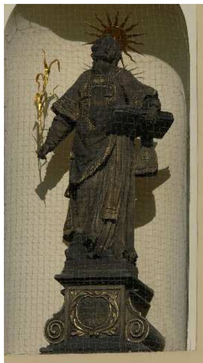
47. Litoměřice, socha sv. Štěpána na průčelí katedrálního kostela