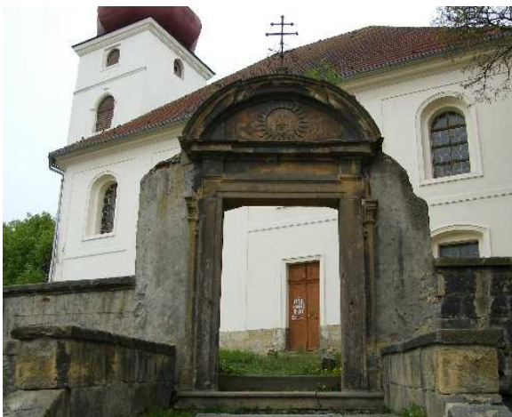
5. Liběšice, brána ke kostelu