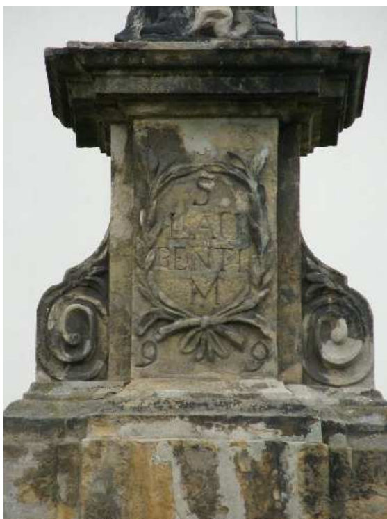
28. Liběšice, sokl sochy sv. Vavřince