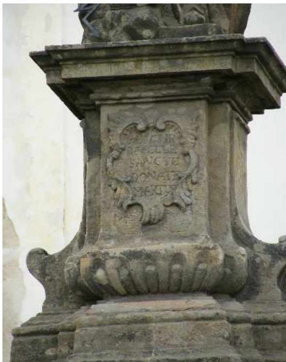
30. Liběšice, sokl sochy sv. Donáta