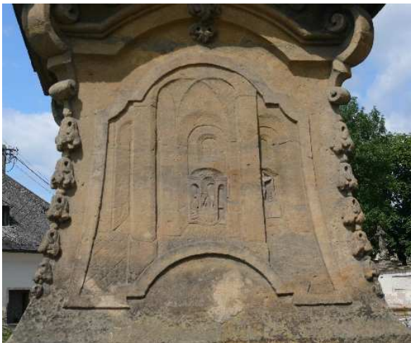
38. Liběšice, reliéf na soklu sousoší sv. Jana Nepomuckého, sv. Jan před králem