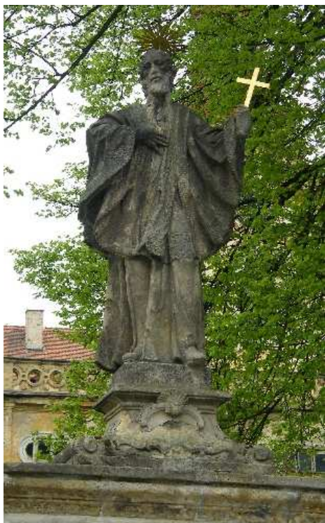
22. Liběšice, socha sv. Františka Xaverského na ohradní zdi rezidence