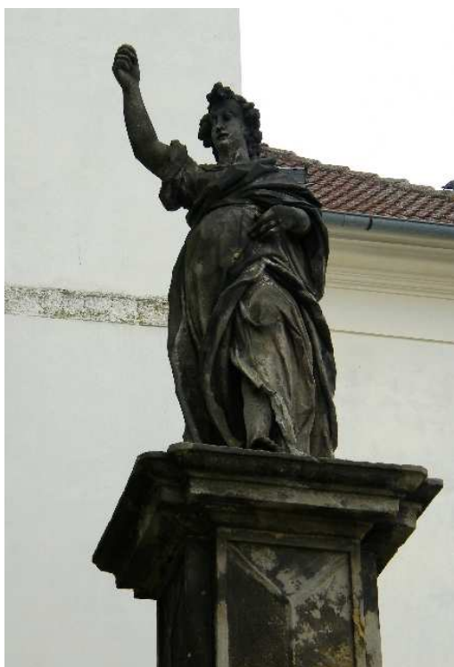
26. Liběšice, socha Archanděla Gabriela na ohradní zdi kostela