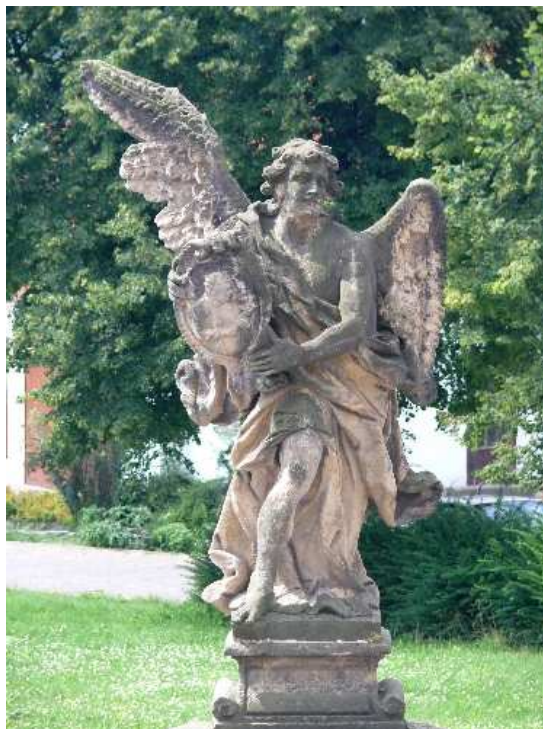
40. Liběšice, anděl nesoucí kartuši se sv. Aloisem Gonzagou