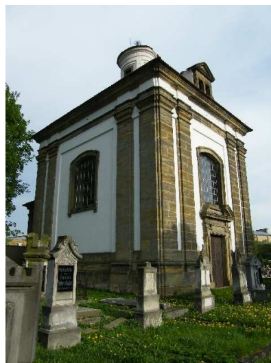
6. Liběšice, kaple sv. Františka Xaverského