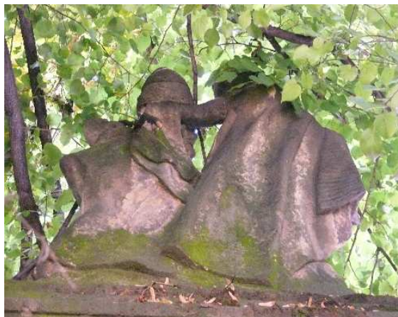
13. Liběšice, putti na pilíři zámecké bráně, kvůli větvím jsou vidět jen ze zadní strany