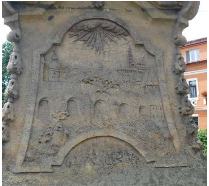
36. Liběšice, reliéf na soklu sousoší sv. Jana Nepomuckého, shození těla sv. Jana do Vltavy