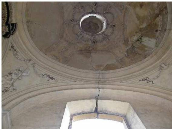
10. Liběšice, prasklina v jižní stěně kaple sv. Františka Xaverského