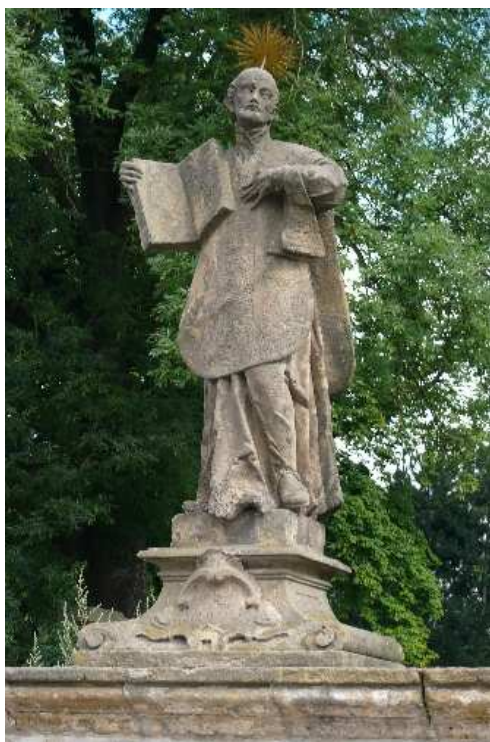
16. Liběšice, socha sv. Ignáce z Loyoly na ohradní zdi rezidence