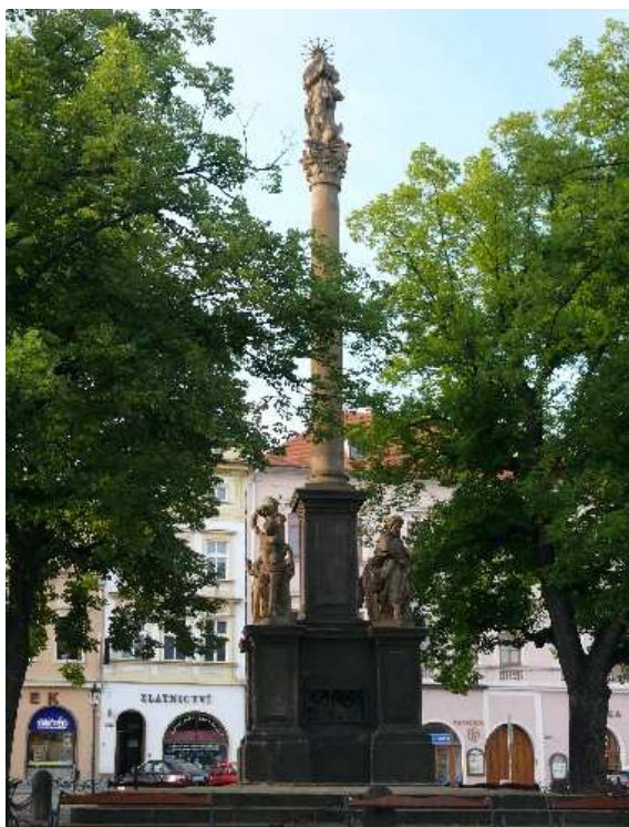
46. Litoměřice, morový sloup na náměstí