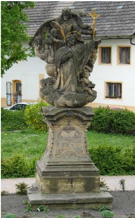
35. Liběšice, sousoší sv. Jana Nepomuckého mezi anděly