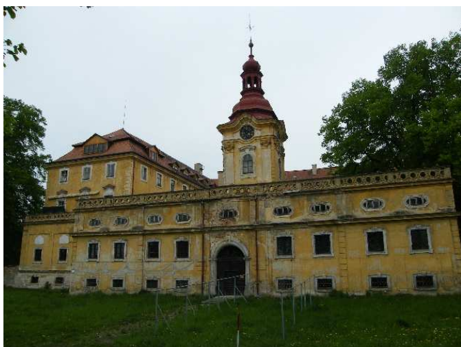
1. Liběšice, pohled na jezuitskou rezidenci od jihu