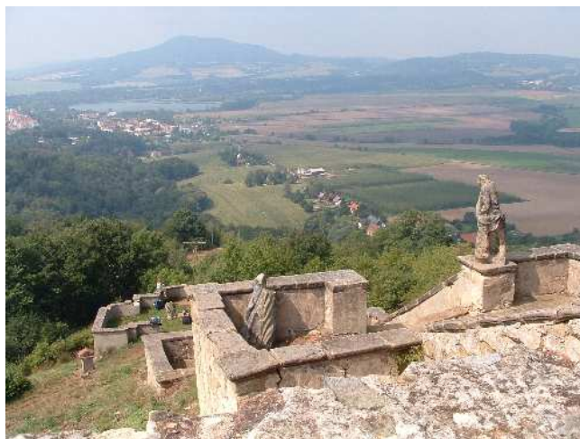
51. Ostré u Úštěka, schodiště s torzem sochařské výzdoby