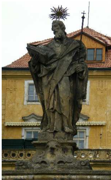
21. Liběšice, socha sv. Jakuba Většího na ohradní zdi rezidence