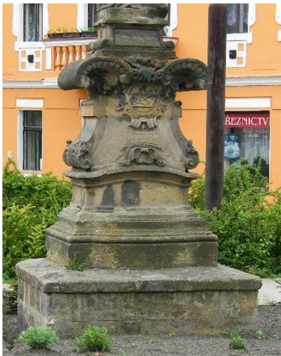
39. Liběšice, sokl sochy anděla ze skupiny soch kolem sv. Jana Nepomuckého