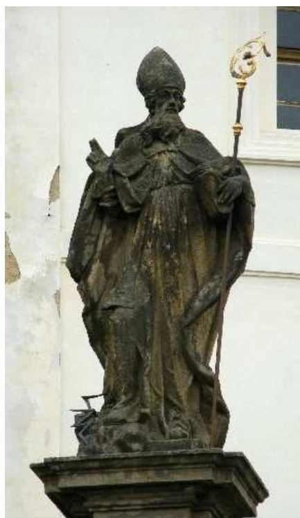
29. Liběšice, socha sv. Donáta na ohradní zdi kostela