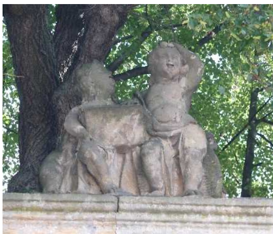
14. Liběšice, putti na druhém pilíři brány