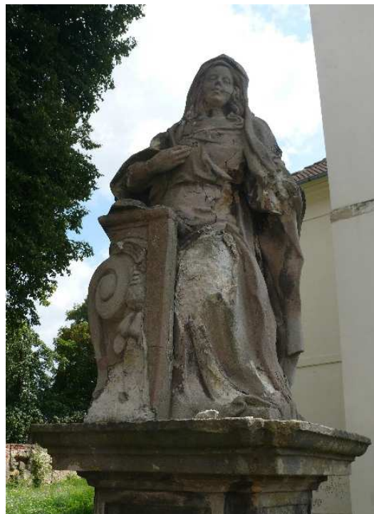
25. Liběšice, socha Panny Marie na ohradní zdi kostela