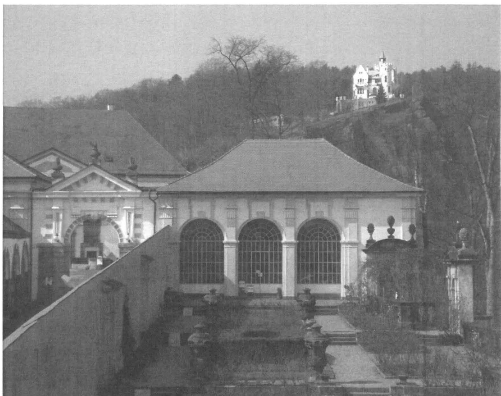
Obr. č. 8 Sala terrena v Růžové zahradě a Horní zámecká brána