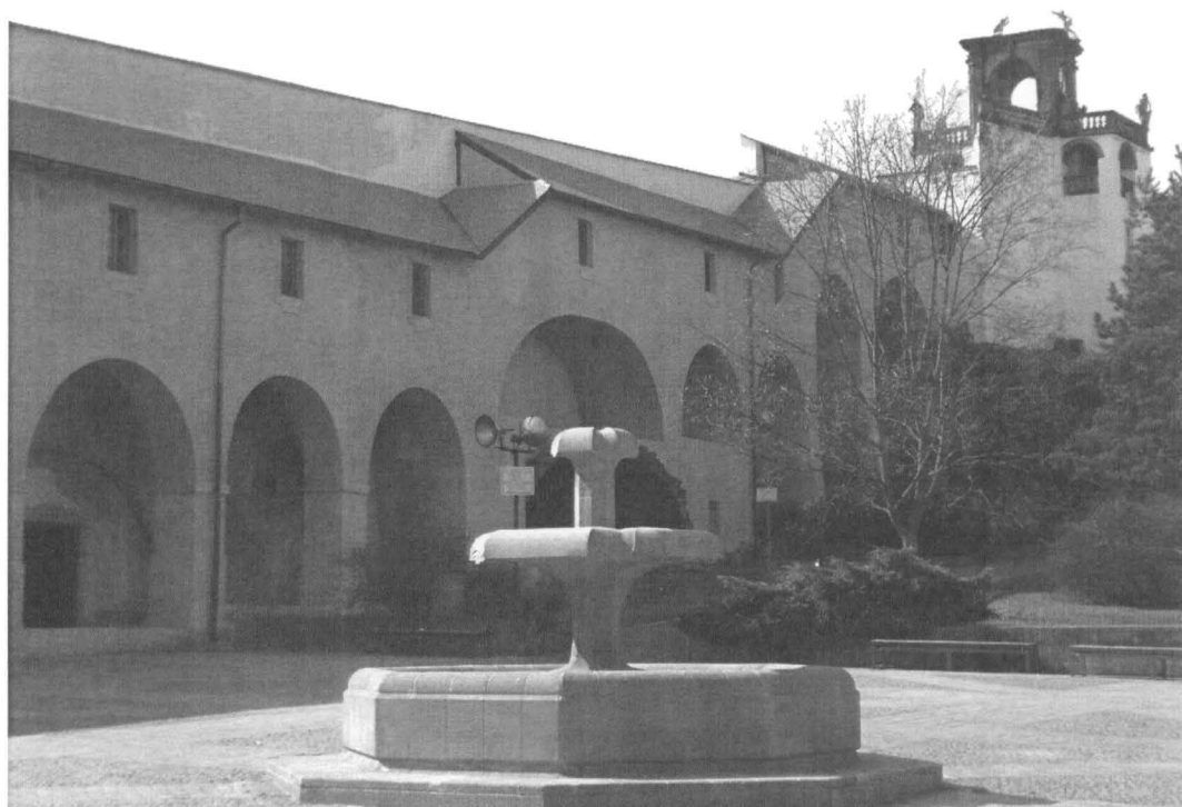
Obr. č. 4 Pilířové arkády nesoucí krytou chodbu