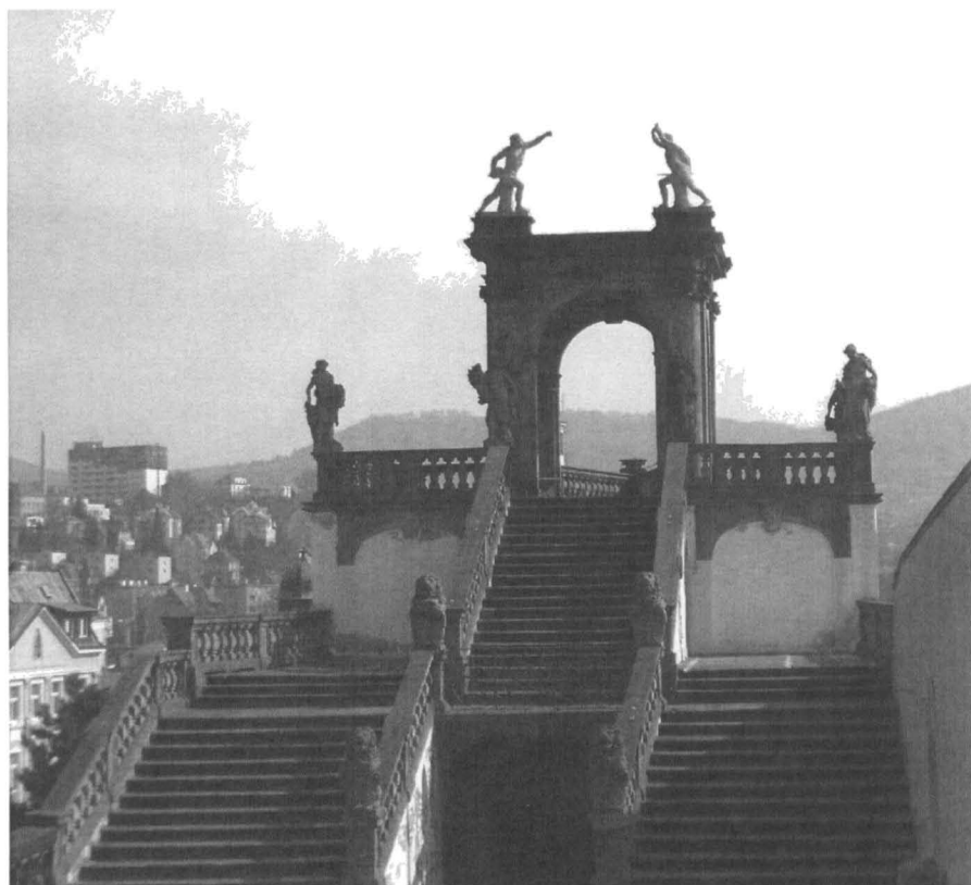
Obr. č. 9 Gloriet v Růžové zahradě