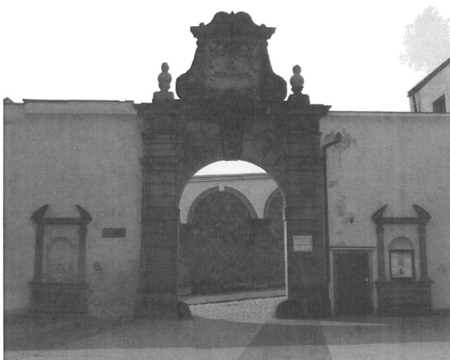
Obr. č. 7 Křížová brána