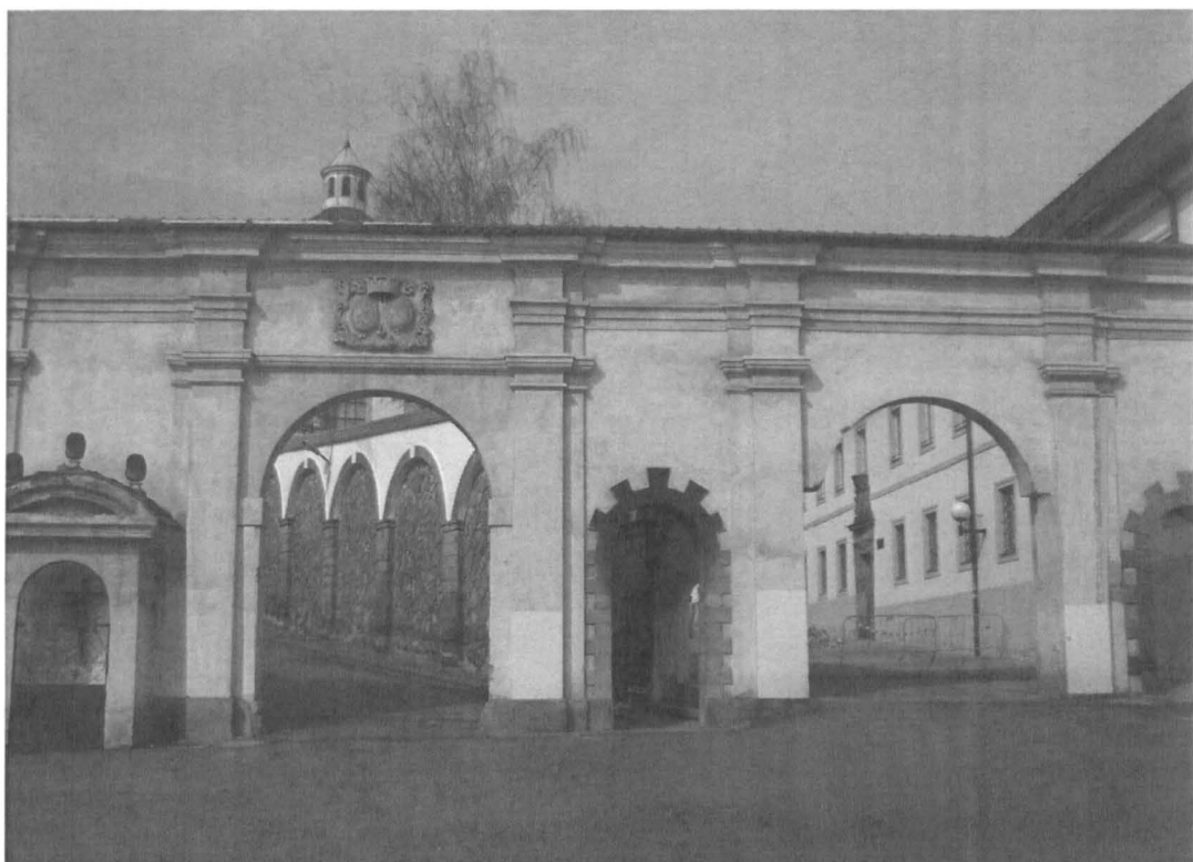
Obr. č. 6 Dolní zámecká brána