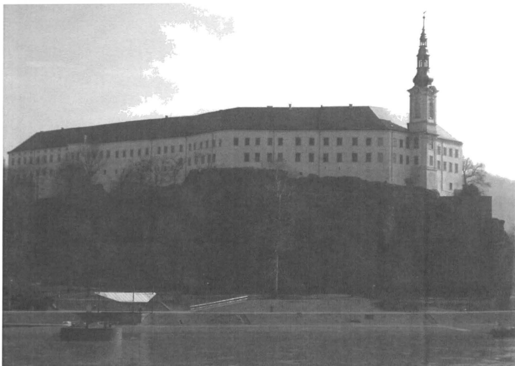
Obr. č. 1 Zámek Děčín