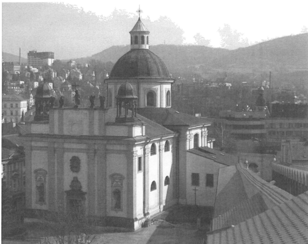
Obr. č. 3 Kostel sv. Kříže s pohledem na část kryté chodby