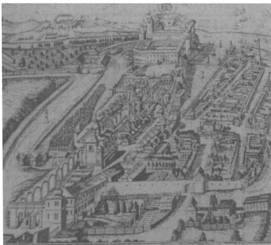
Obr. č. 2 Rytina Děčina z roku 1712 1