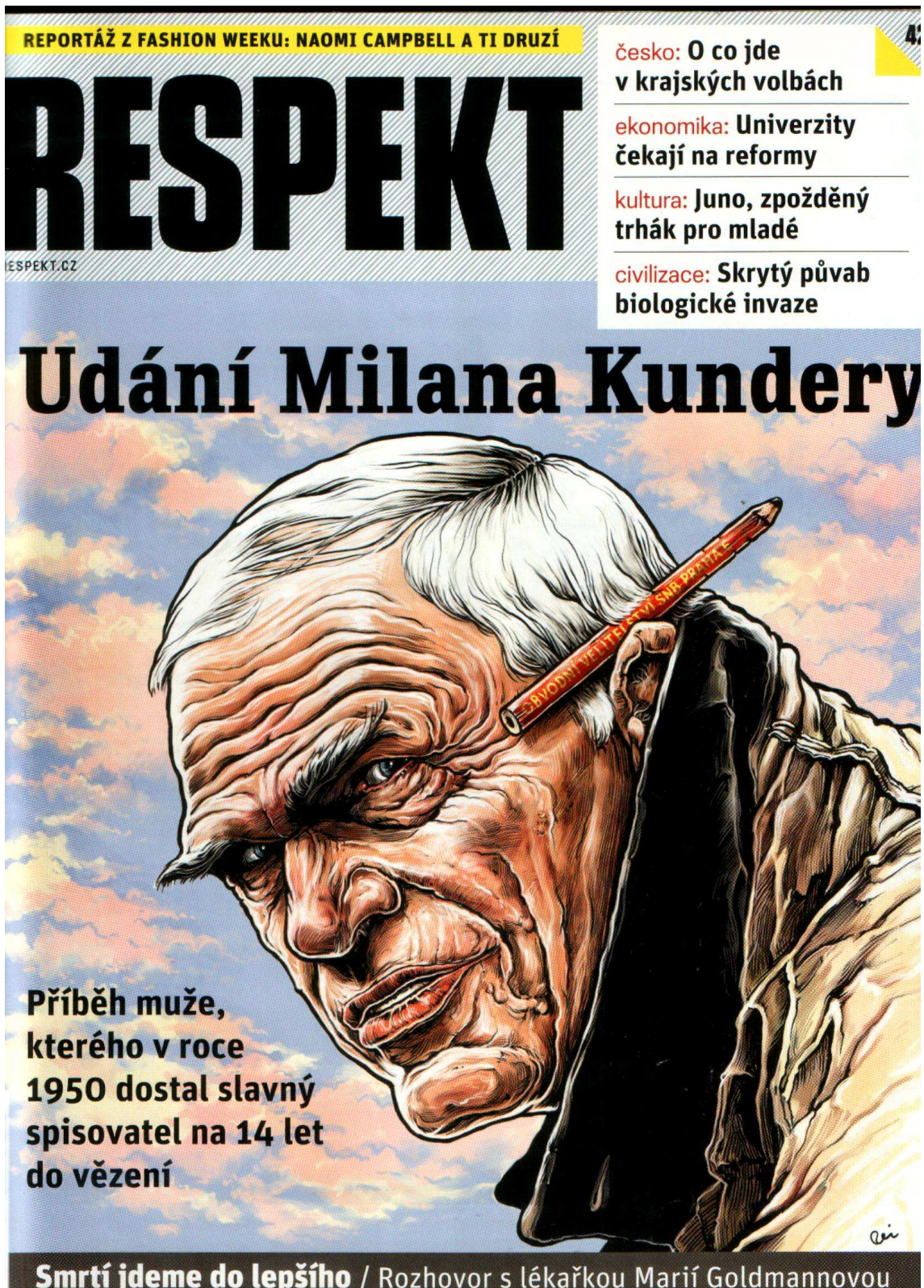
Příloha č. 3: Obálka 42. čísla časopisu Respekt (obrázek)