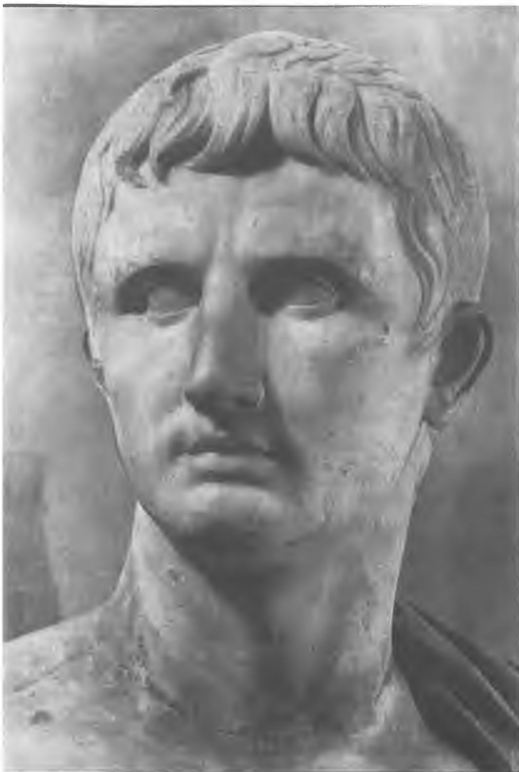
Příloha č. 1: Octavianus Augustus jako Jupiter, detail, Petrohrad Ermitáž