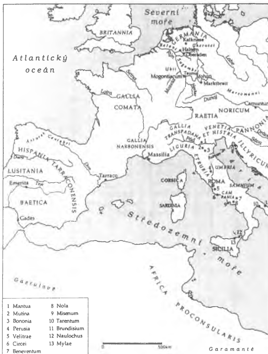
Mapa římské říše