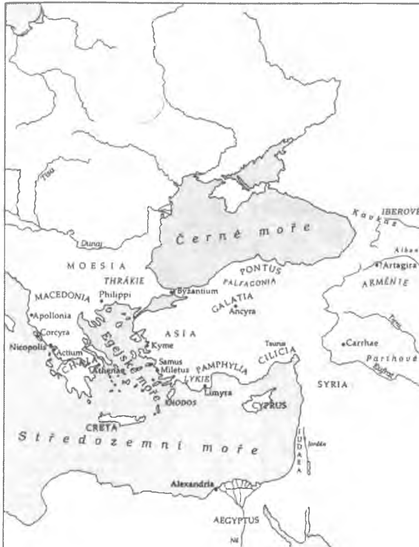
Příloha č. 2: Mapa římské říše

Zdroj: ECK, W.: Augustus , Vyšehrad, 2004.