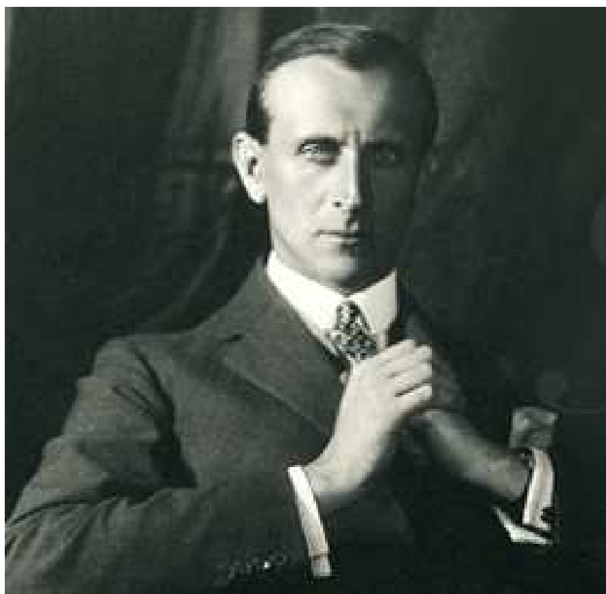
Příloha 6: Fotografie – Maxmilián Ervín Lobkowicz