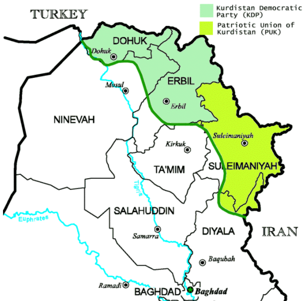
Příloha č. 5: Rozdělení iráckého Kurdistanu mezi KDP a PUK (obrázek)

Zdroj: http://www.globalsecurity.org/military/world/war/images/kurdistan_2002_control1.gif