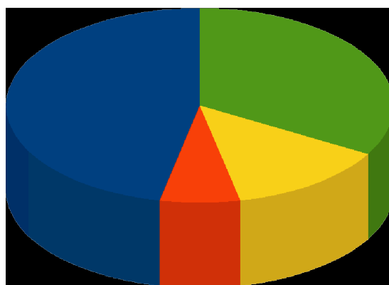
Graf č.2: Zaměstnání účastníků projektu dva roky po jeho ukončení.