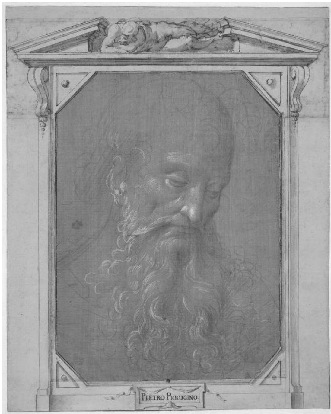
4. Pietro Perugino: Hlava starého muže s vousy, kresba olověným a stříbrným pisátkem na okrově tónovaném papíře, vysvětlována bělobou, 246 × 178 mm, Londýn, British Museum.