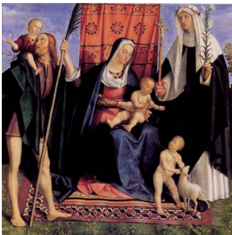
12. Galeazzo Campi: Madona s dítětem a malým sv. Janem, sv. Kryštofem a sv. Rosou (či sv. Kateřinou ze Sieny), konec 2. desetiletí 16. století, 120 × 120 cm, Cremona, Museo civico.