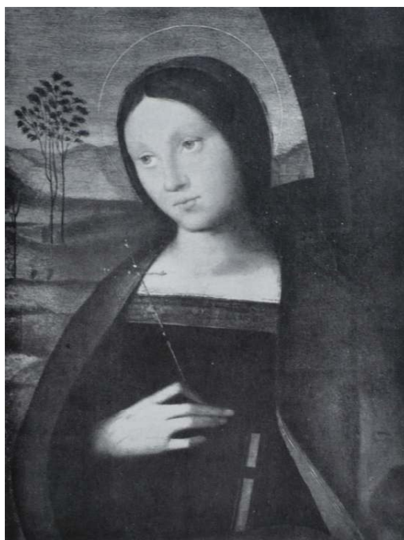
8. Boccaccio Boccaccino: Polopostava Světice, 1496-1497, fragment.