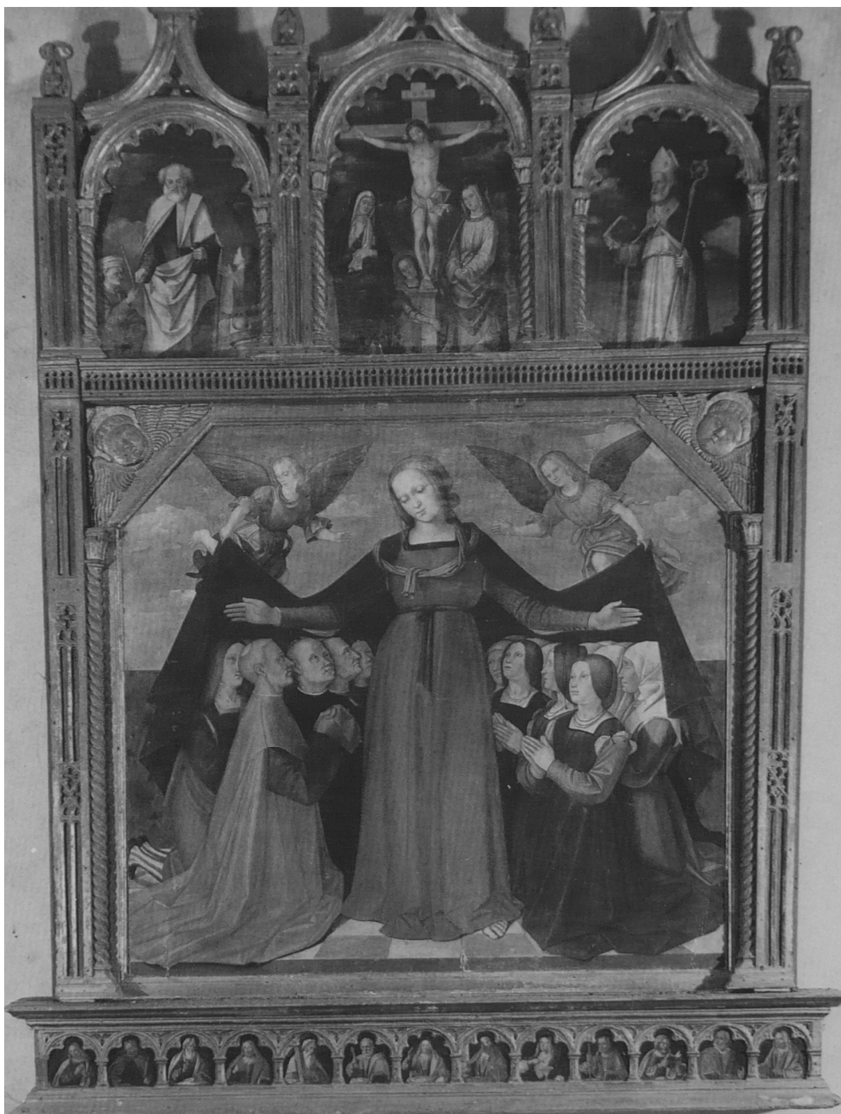
16. Tommaso Aleni: Polyptych, před koncem 1. desetiletí 16. století, 220 × 160 cm, San Giovanni in Croce, farní kostel.