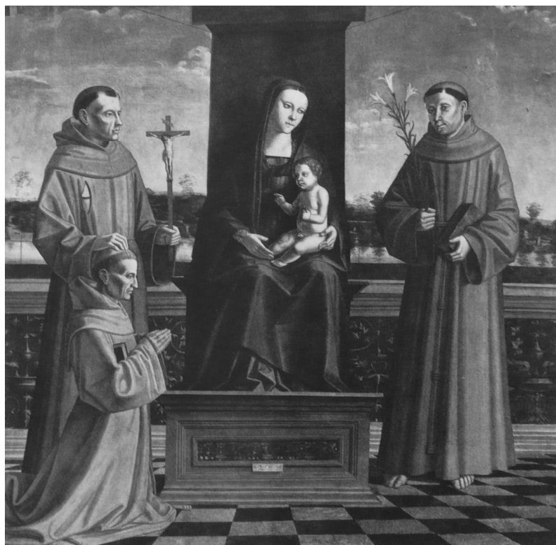
10. Tommaso Aleni: Madona s dítětem, sv. Antonínem Paduánským a sv. Františkem doporučujícím donátora, 1500, 195 × 195 cm, Cremona, Museo civico.