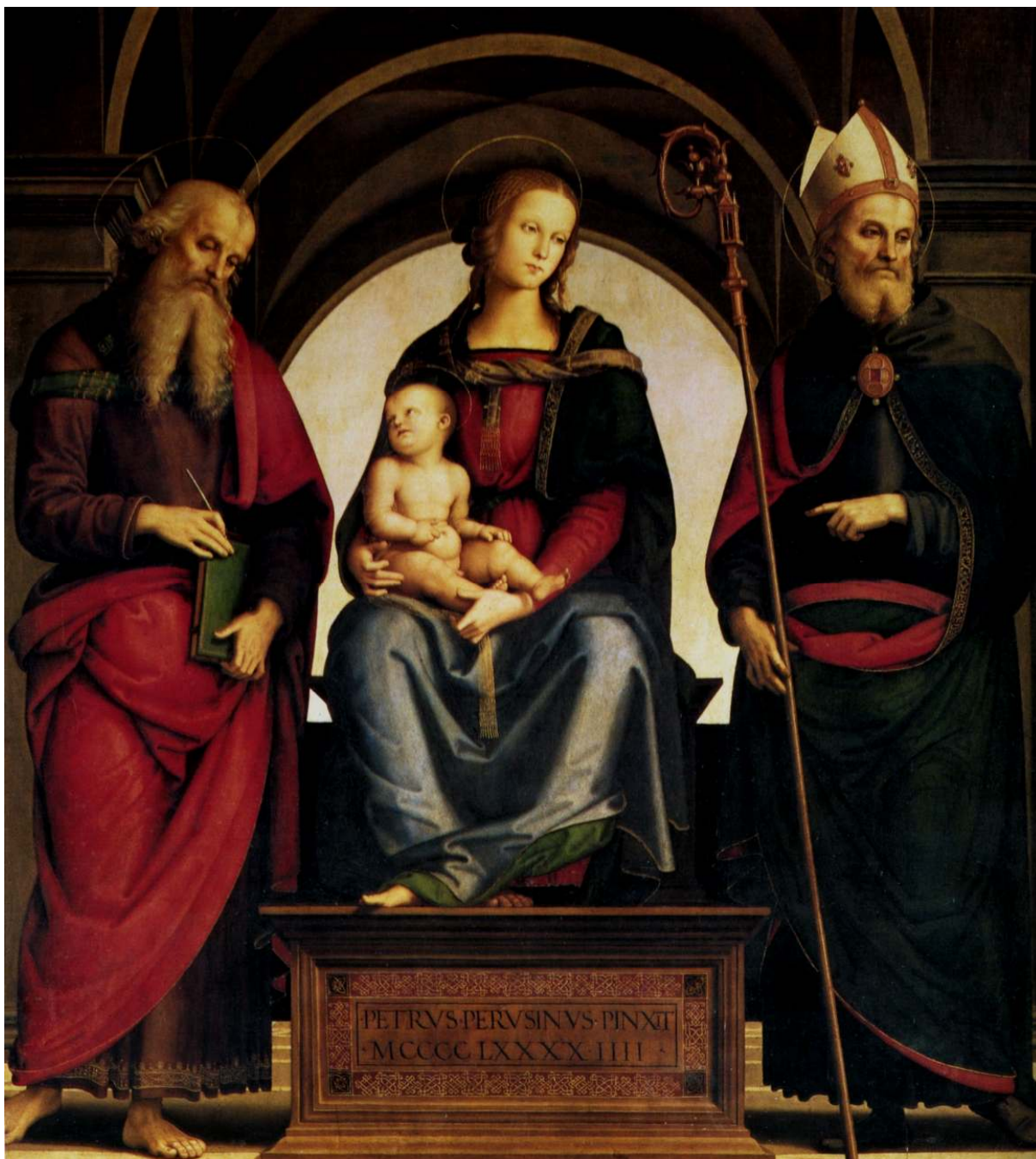
3. Pietro Perugino: Madona s dítětem, sv. Jakubem a sv. Augustinem, 1494, olej, dřevo, 170 × 160 cm, Cremona, kostel Sant'Agostino.