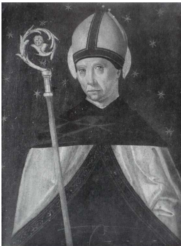
7. Boccaccio Boccaccino: Sv. Augustin, 1496-1497, fragment polyptychu, Poughkeepsie, Vassar College.