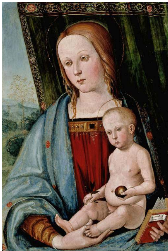
23. Galeazzo Campi: Madona s děckem, 1. desetiletí 16. století, 60,6 × 42,5 cm, Cambridge, Fitzwilliam Museum.