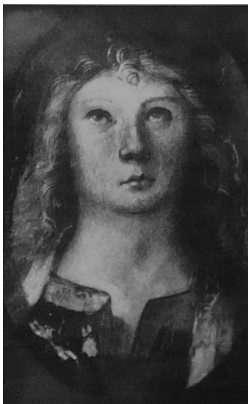
5. Boccaccio Boccaccino: Hlava blahoslaveného augustiniána, 1497, freska, 32 × 28 cm, Cremona, Museo civico.