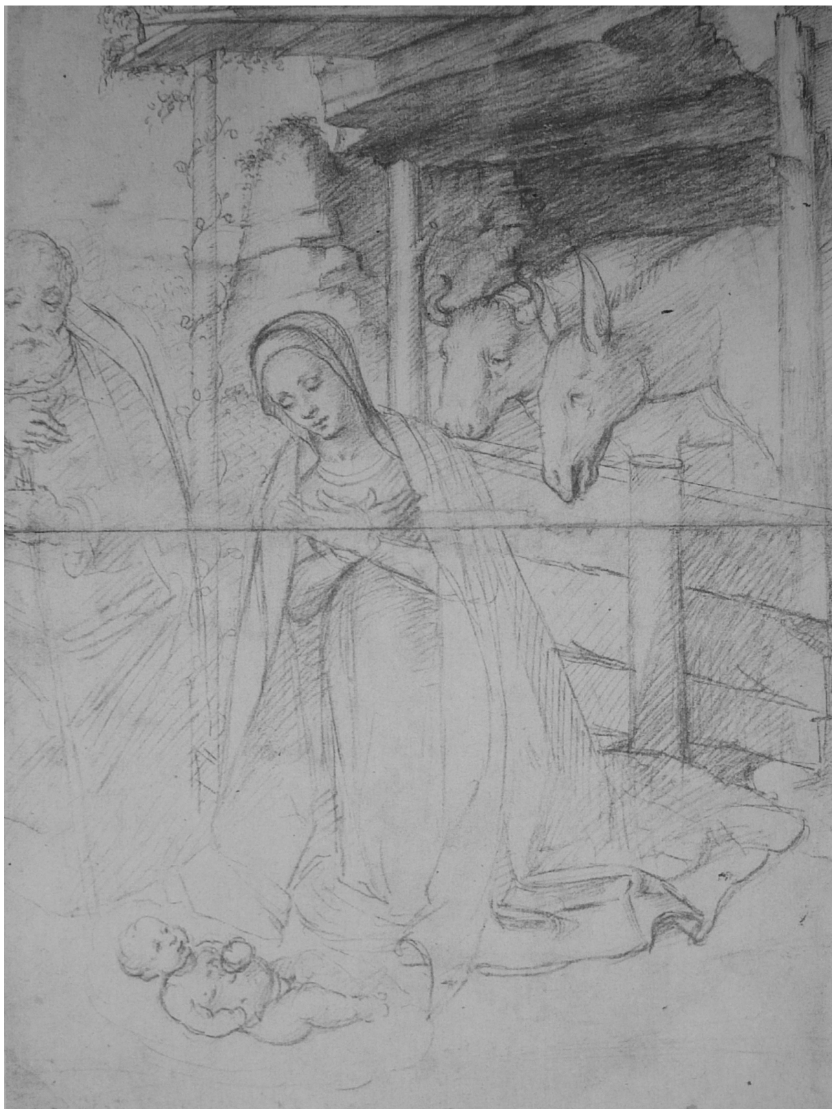
14. Tommaso Aleni: Adorace narozeného Krista (recto), kresba rudkou, 379 × 276 mm, Teplice, Regionální muzeum.