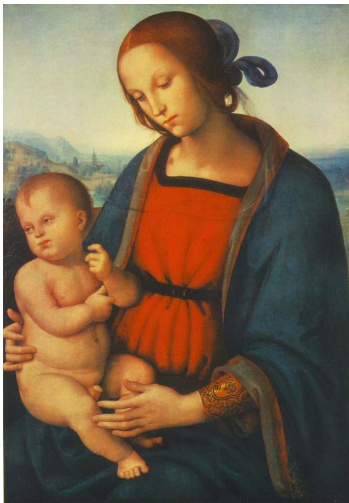
1. Pietro Perugino: Madona s dítětem, kolem roku 1501, olej, dřevo, 70 × 51 cm, Washington, National Gallery.