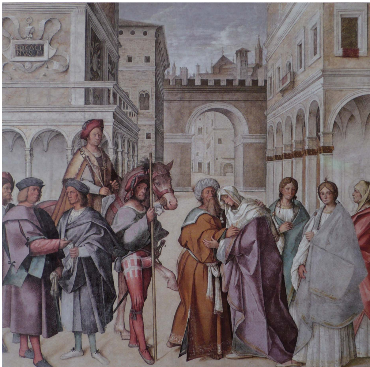
9. Boccaccio Boccaccino: Setkání Jáchyma s Annou u Zlaté brány, 1514-1519, freska, Cremona, dóm, stěna hlavní lodi.