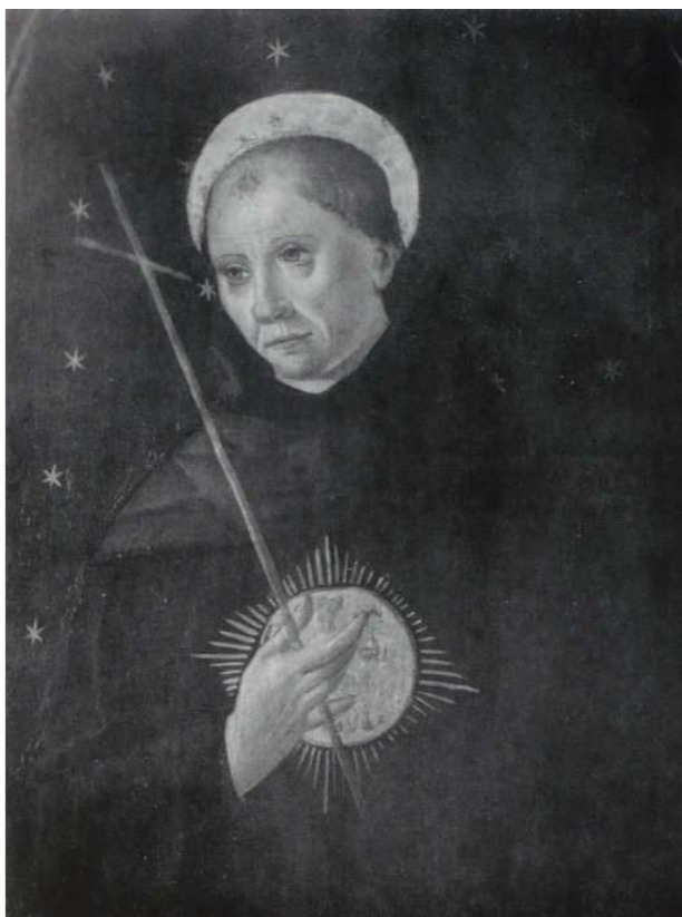
6. Boccaccio Boccaccino: Sv. Mikuláš Tolentinský, 1496-1497, fragment polyptychu, Poughkeepsie, Vassar College.