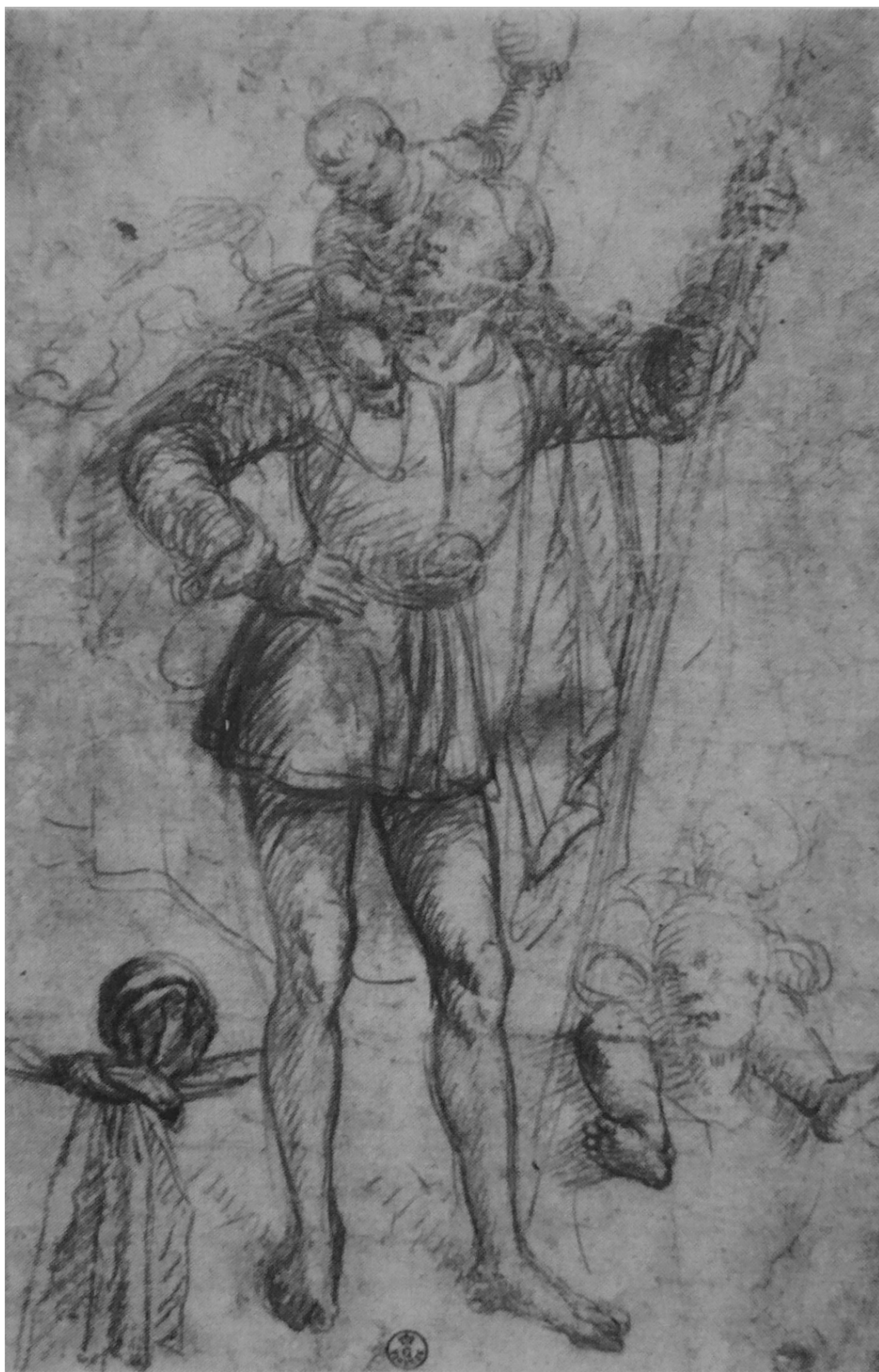
21. Galeazzo Campi: Sv. Kryštof, 1516, kresba rudkou a tužkou na světlém papíře, 297 × 190 mm, Florencie, Uffizi, Gabinetto dei disegni e stampe.