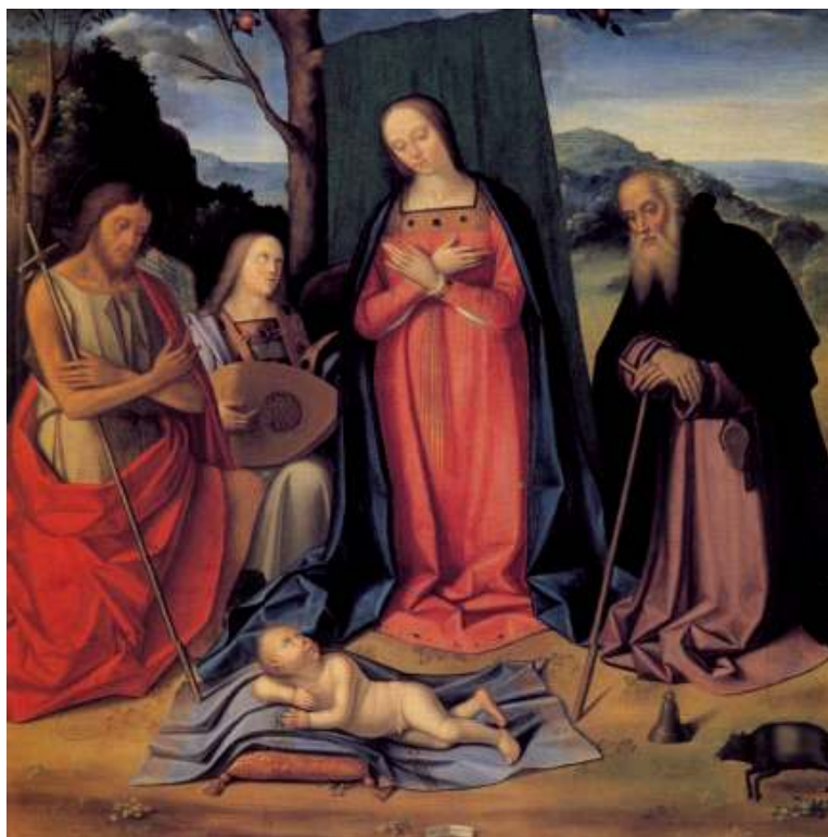
11. Tommaso Aleni: Madona adorující děcko se sv. Janem Křtitelem, sv. Antonínem opatem a andělem, 1515, 125 × 125 cm, Cremona, Museo civico.