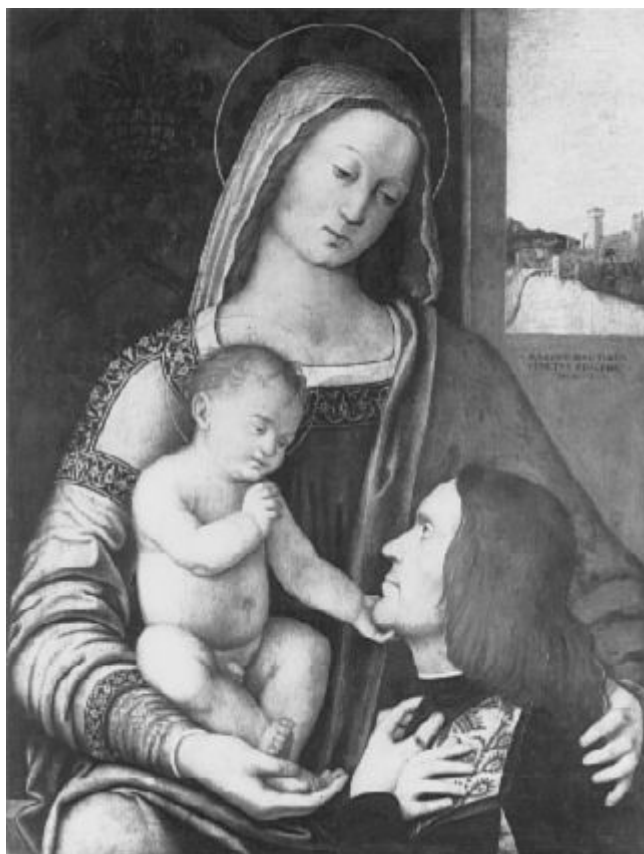
26. Marco Marziale: Madona s dítětem a Tommasem Raimondim, 1504, olej, dřevo, 68 × 52 cm, Bergamo, Accademia Carrara.