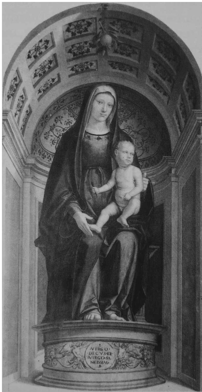
18. Tommaso Aleni: Madona s dítětem, Cremona, kostel Sant'Agostino.