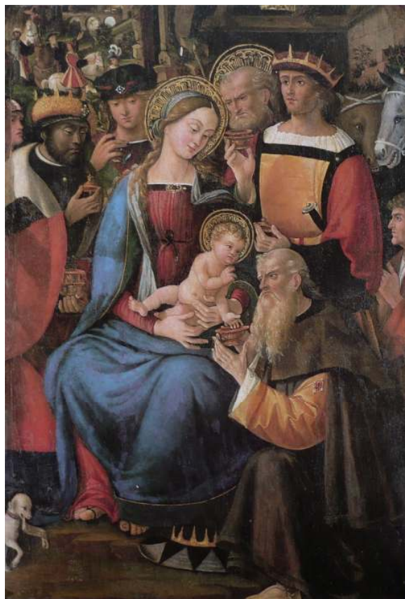
24. Francesco Casella: Klanění tří králů, 1510, 122 × 87 cm, Vercelli, Museo Borgogna.