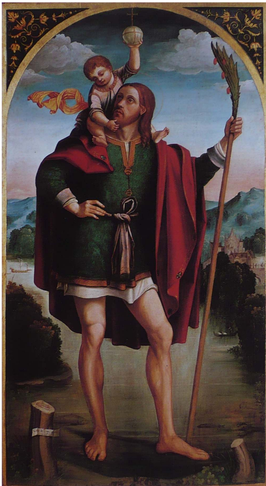
20. Galeazzo Campi: Sv. Kryštof, 1516, 170 × 94,5 cm, Viadana, kostel Santa Maria in Castello.