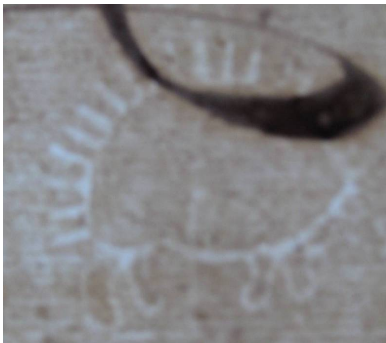
Vodoznak č. 3 (obr. 3) 491