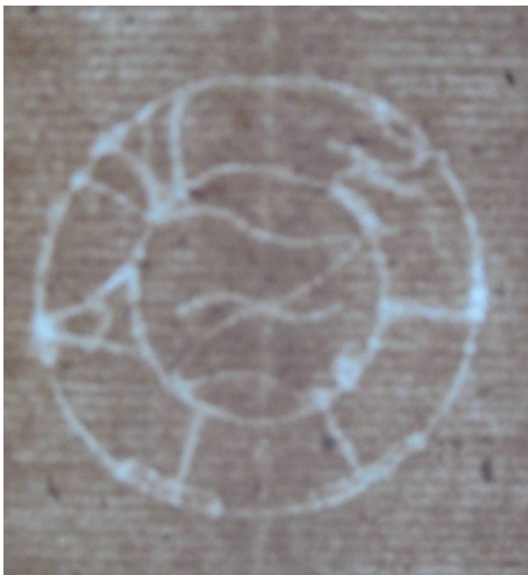
Příloha č. 2 Vyobrazení posla