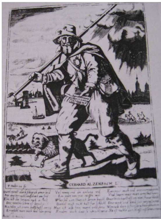
(obr. 4) 492