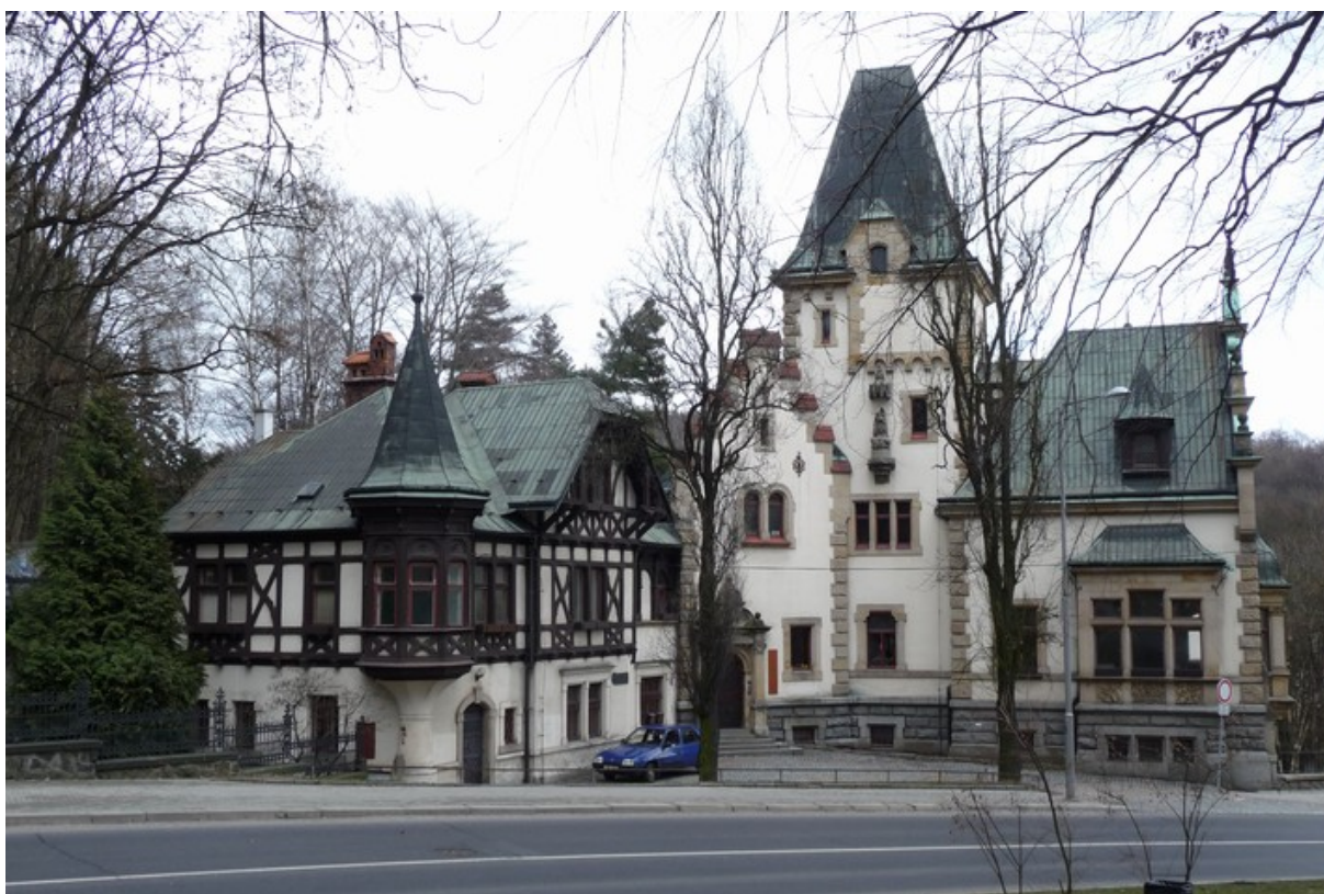
Liebigova vila v Jablonecké ulici, okouzující ukázka historizující architektury konce 19. století v Liberci.

Antropologie vysvětluje také další podstatný význam architektury. Architektura a její hmotné projevy, stavby, se jako součásti světa hmotných artefaktů, produktů lidské činnosti, výrazně podílejí na zaznamenávání a předávání kultury v čase, de facto na zachovávání soudržnosti naší civilizace. Na druhou stranu má však kultura nepostradatelný význam pro fungování architektury, kterou interpretuje, vysvětluje a komunikuje. „Významuplná reprezentace je umožněna komunikativním kontextem kultury, v němž jsme vždy situováni a který by snad měl být označen jako komunikativní prostor,“ 25 píše Veselý.