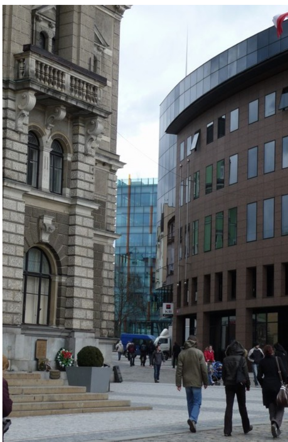
Pohled z Benešova náměstí přes budovy radnice a Komerční banky k centru Liberec Plaza – kontrast tradiční a moderní architektury.

Metodologie sbírání údajů pro tvorbu mentálních map využívá především formy řízených rozhovorů či dotazníkové metody, které mohou být doplněny projektivními testy. Nejprve si vždy musíme vymezit zkoumaný prostor a nějak ho ohraničit. Teprve poté můžeme vhodně položenými dotazy zjišťovat subjektivní preference dotazovaných – jak prostorové, tak estetické, přičemž odpovědi musí vždy obsahovat preferenční volby. Výsledky se pak mohou faktorově analyzovat a prezentovat v mapové formě. Mapy, které zohledňují např. estetické, kvalitativní hledisko, se nazývají „nepřímé mentální mapy“ a ukazují především, jak lidé kategorizují životní, pracovní, urbanistické, krajinné i interpersonální prostředí. Allan Gyntel vymezuje osm faktorů struktury popisu postojů člověka k prostředí. Jsou to: vztah k místu a ochota se v jeho prospěch angažovat, adaptace k prostředí, zdroj podnětů a libých emocí, důvěra v prostředí, antikvářský postoj, potřeba soukromí a mechanická orientace v prostředí. 20 Prostor, které kladně působí na lidskou psychiku a pozitivně ji stimuluje, by pak mělo především uspokojovat naše základní potřeby a touhy jako je pohodlí, klid, rozmanitost, srozumitelnost, možnost ztotožnění apod.