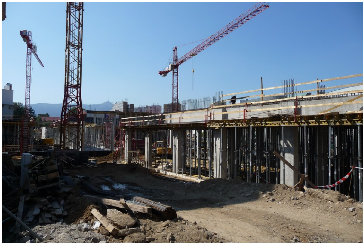
Liberec, centrum města, září 2009.

„Je smutné, že již pouhé staveniště začínáme vnímat spíše jako formu hrozby než jako pozitivní příslib něčeho, co nás čeká.“ 1