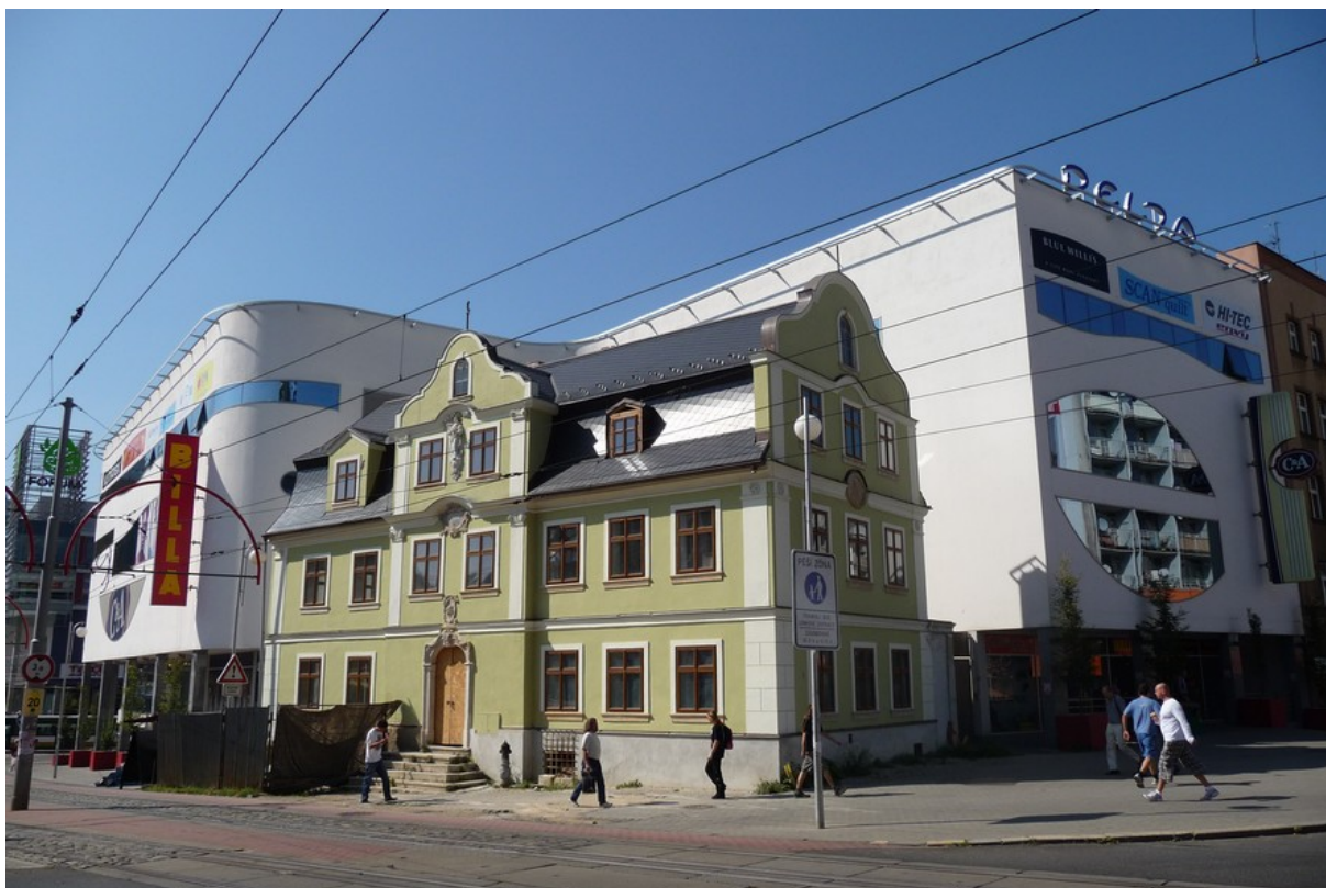
Bezprostřední styk tradiční a moderní architektury v centru Liberce. Nákupní centrum Delta mezi ulicemi Fügnerovou a Revoluční, doslova objímající nejstarší kamennou libereckou stavbu – dům U zeleného stromu.