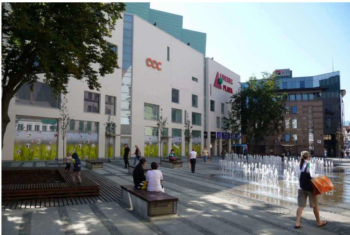
Jeden z mála nových městských prostorů v centru Liberce vytvořený pro chodce a pro rekreační využití času. Kombinace dřevěných laviček, vodotrysků a alespoň minimálního množství zeleně vytváří přinejmenším příjemnou iluzi klidu v rušném centru.