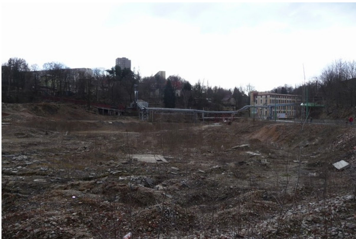
Areál bývalé Textilany, jaro roku 2009.