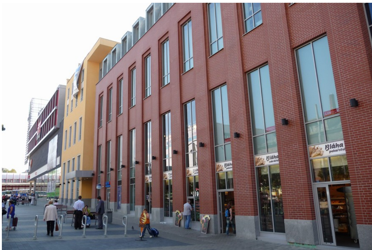
Zásadní proměna dolního centra města – na jaře roku 2009 otevřené nákupní a zábavní centrum Forum Liberec.

K září roku 2009 je postavena přibližně jeho první polovina – několikapatrové nákupní centrum, které se napojilo na již dříve postavené patrové nadzemí parkoviště pro osobní automobily mezi ulicemi Dr. Milady Horákové a Blažkovou. Beze zbytku vyplňuje plochu mezi ulicemi Fügnerova a Blažkova a tvoří nepřehlédnutelnou dominantu dolního centra města. Prozatímní fasáda je složena z několika nesourodých částí, které díky užitým materiálům, barvám, i architektonickému stylu, vytvářejí dojem více samostatných budov.