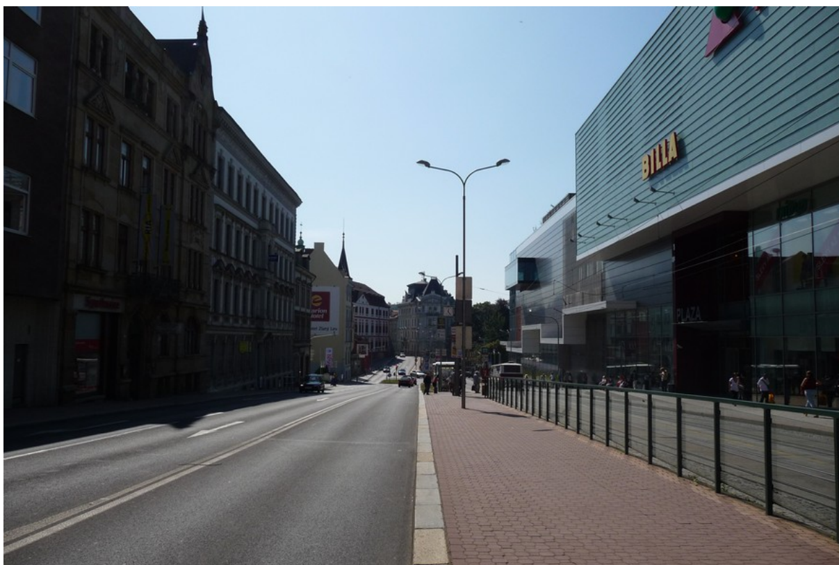
Nově vytvořený městský prostor v Liberci, pohled dolu Palachovou ulicí.