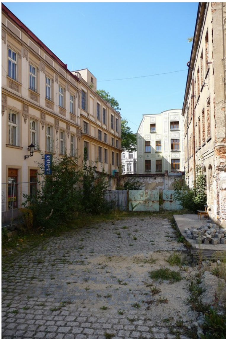
Nevyužitý prostor mezi Pražskou a Moskevskou ulicí, centrum města.

Liberec má ve svém jádru relativně velké množství menších, ale i velmi rozlehlých nevyužívaných ploch. Část z nich vznikla v nedávné době zbouráním dřívější zástavby kvůli novým developerským plánům (areál bývalé Textilany, OD Ještěd ad.), část jich už ale naopak potkávají den co den Liberečané i více než století. První i druhý případ vzbuzují jak u laické, tak u odborné veřejnosti mnoho aktuálních otázek po jejich konkrétním budoucím využití. Ty přitom zapadají do širší oblasti problematiky rekonstrukce historických center měst či využití průmyslového odkazu naší minulosti. Při hledání odpovědí na tyto otázky si však nejprve musíme ujasnit, jaké priority má naše společnost, jaké hodnoty vyznává a jakých cílů chce dosáhnout. Teprve poté je možno začít pracovat na jejich realizaci.