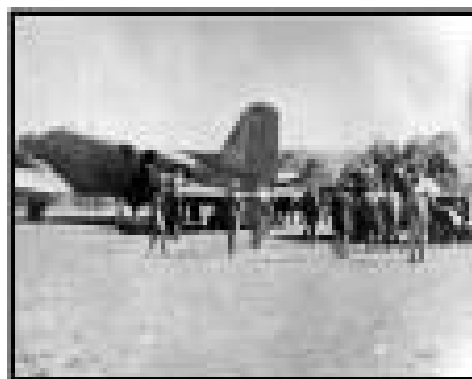
Jedna ze mnoha evakuací z Galovičova pole v srpnu 1944