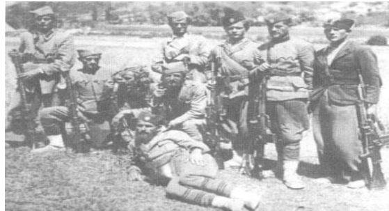
Oddíl příslušníků Jugoslávského vojska ve vlasti