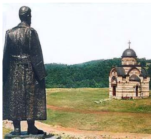
Pomník generála Mihailoviče na Ravne Goře