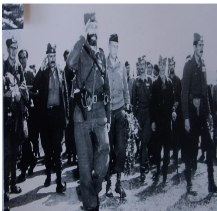
Generál Mihailovič na přehlídce četnických oddílů