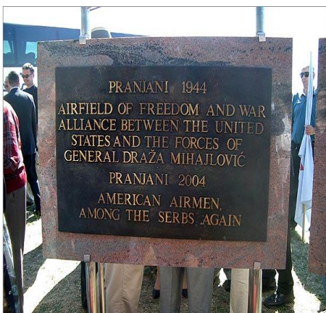
Pamětní cedule Muzea operace Halyard v Pranjani