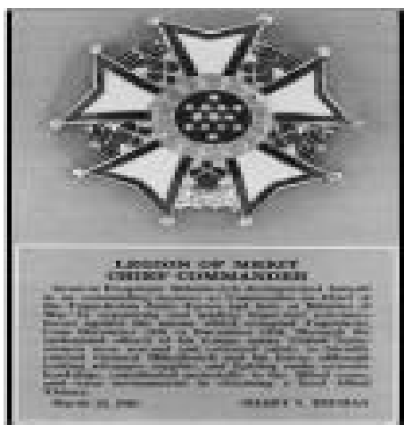
Posmrtné udělení Řádu cti generálu Mihailovičovi americkým prezidentem Harry Trumanem, březen 1948