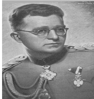
Plukovník Mihailovič krátce před druhou světovou válkou