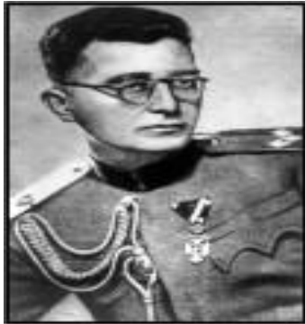
Plukovník Dragoljub Mihailovič v roce 1937 jako vojenský atašé v ČSR.