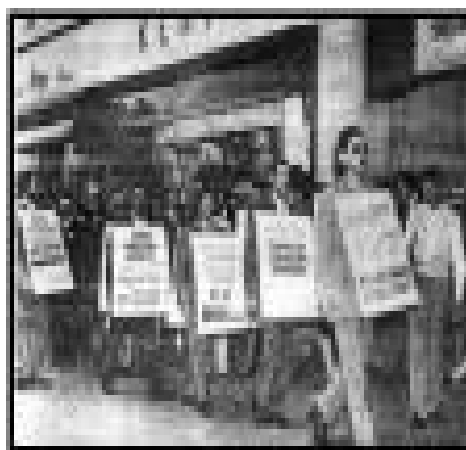
Foto z téhož protestu