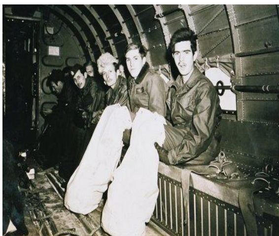
Zachránění spojenečtí letci těsně před odletem ze Srbska