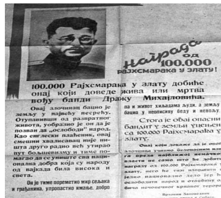
Zatykač na Dražu Mihailoviče z konce roku 1941