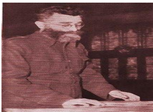
Dražo Mihailovič před soudem v létě 1946