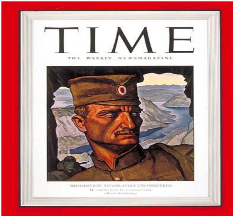
Mihailovičův „portrét“ na titulní stránce amerického magazínu Time