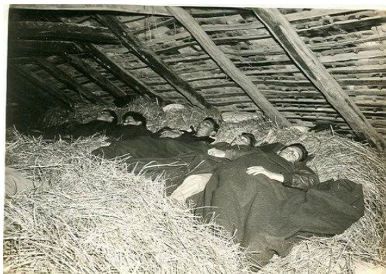
Američtí letci, zachránění četniky při operaci Halyard