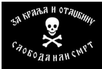
Bojová zástava ravnogorských četniků („За крале а за vlast – Svobodu nebo smrt“)