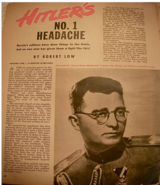
Oslavný článek na Mihailoviče v západním tisku