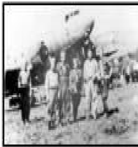
Četníci a američtí letci před transportním letounem u Pranjani