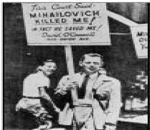
Demonstrace na Mihailovičovu podporu, svolaná americkými letci před ambasádu komunistické Jugoslávie, 1946