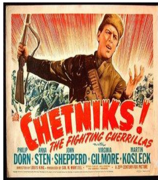
Plakát k filmu „Četnici – bojující guerilly“ z roku 1943