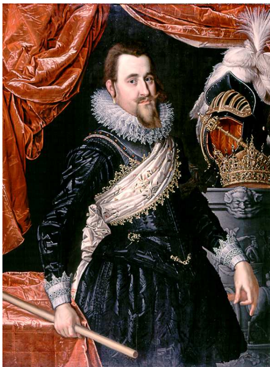
Kristián IV. , dánský a norský král (Pieter Isaacs, 1611- 1616)