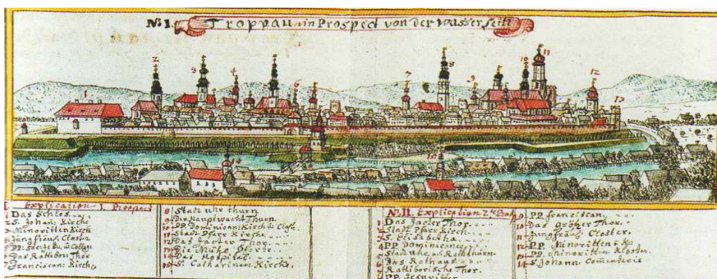
Opava, kolorovaná kresba Fridricha B. Wenera (kolem 1750)