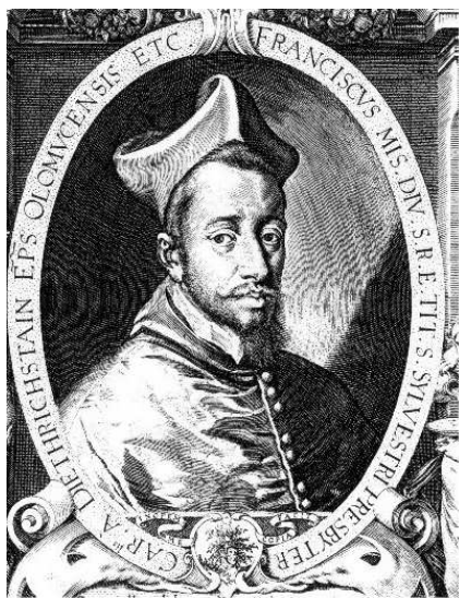
František z Ditrichštejna olomoucký kardinál