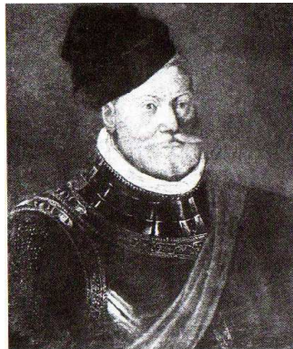
Ladislav Velen ze Žerotína