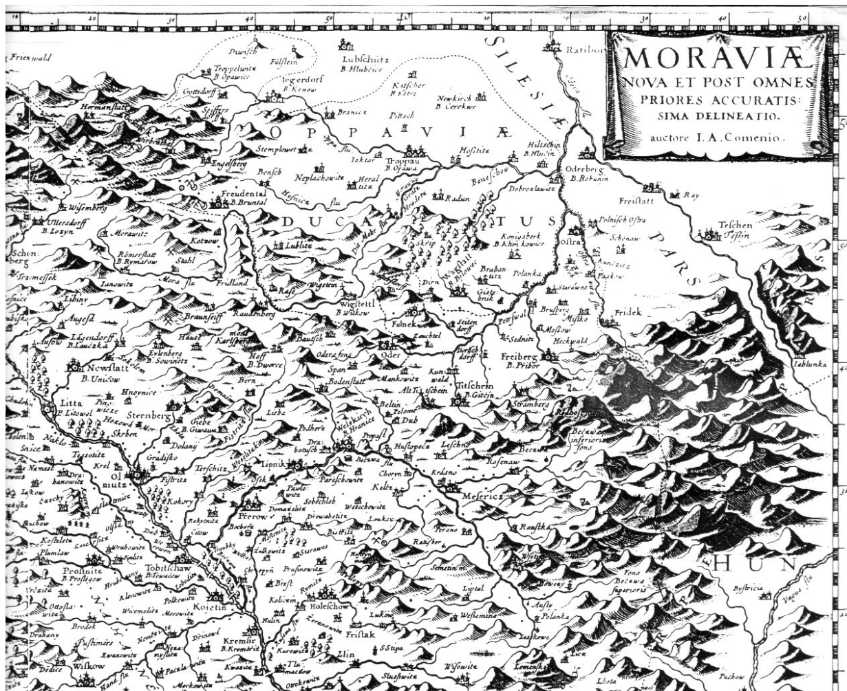
Morava, výřez z mapy Jana Ámose Komenského (1627)