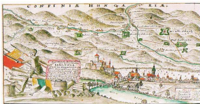
Plán jablunkovských šancí na slezsko-uherské hranici s pohledem na Těšín