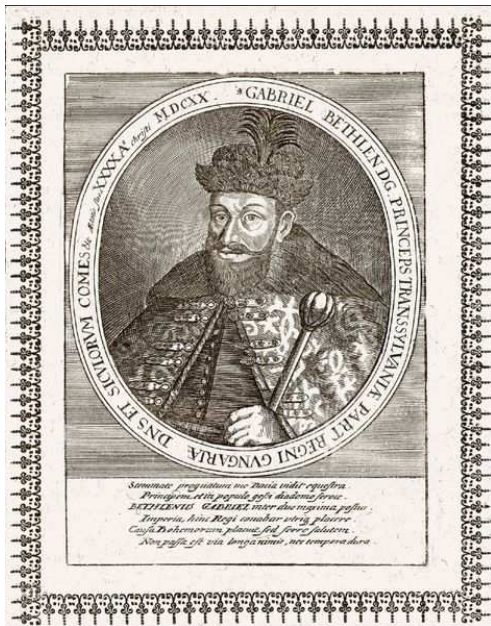
Petr Arnošt hrabě z Mansfeldu