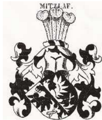
Erb rodu Mitzlaffů