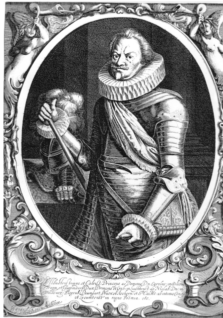
Karel z Lichtenštejna kníže opavský a krnovský