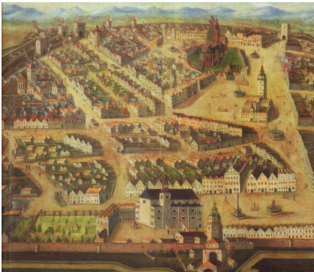
Opava, výřez z tzv. požárního obrazu (po 1689)