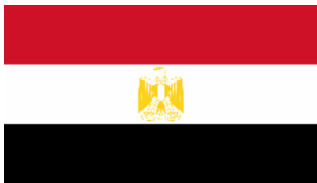
Státní vlajka Egypta 2