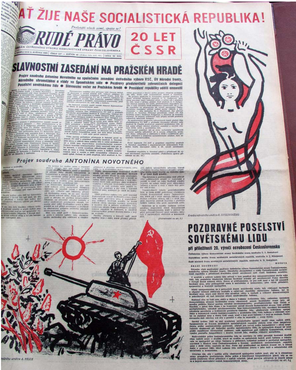
Rudé právo, 9. květen 1965 (Rudé právo, ročník 45, číslo 127, vyšlo 9. května 1965, s 1) Dvacet let od osvobození republiky