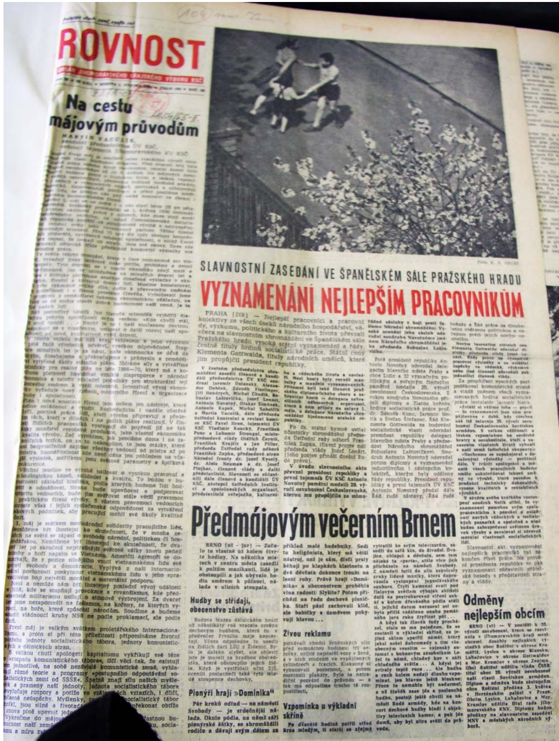
Rovnost, 1. máj 1965 (Rovnost, ročník 80, číslo 103, vyšlo 1. května 1965, s 1) Sváté práce